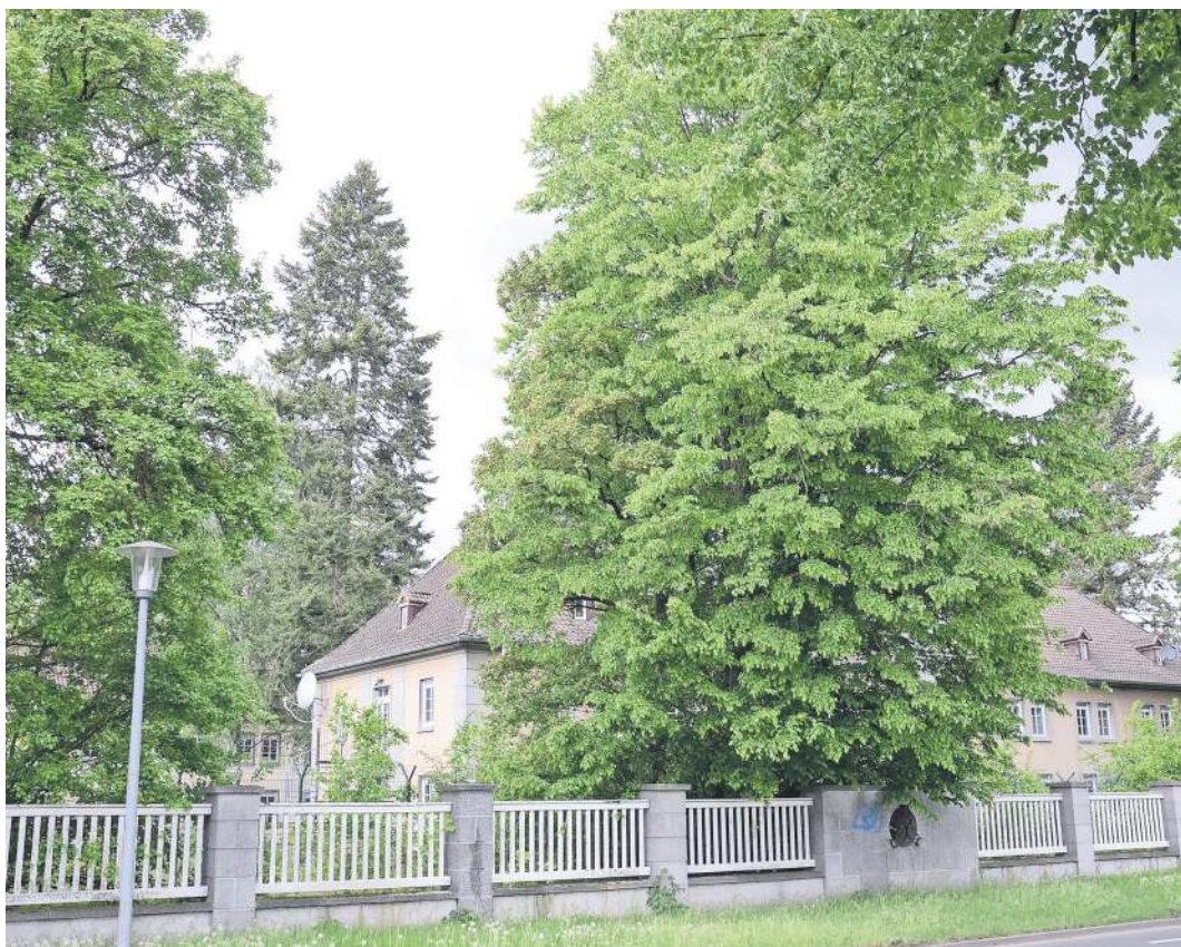
Die Liegenschaft Hohe Wende in Celle ist in der Überprüfung für die Nutzung durch die Bundeswehr.