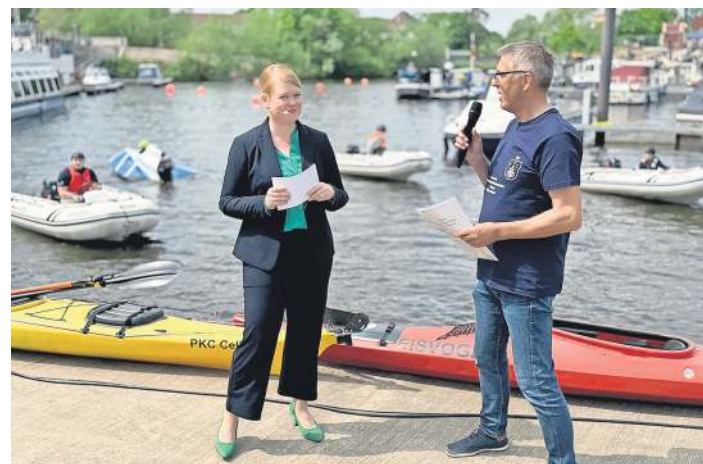
Moderation beim Celler Hafenfest.

Während des Hafenfestes präsentierte sich der Yacht-Club Celle an beiden Veranstaltungstagen. Besonders die Jugendabteilung zeigte dabei großes Engagement und Begeisterung. Mit viel Einsatz und Teamgeist repräsentierten die jungen Mitglieder den Verein und machten deutlich, wie wichtig die Nachwuchsarbeit im YCC ist.