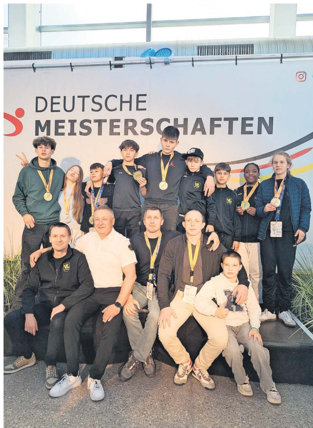
Die erfolgreichen Westerceller Teilnehmer bei der Deutschen Meisterschaft Jugend.

Den ersten Titel bei seinen ersten Meisterschaften erkämpfte