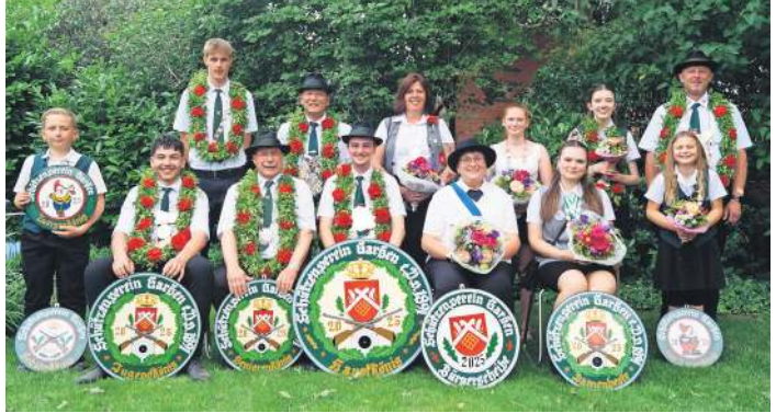
Das Königshaus 2025/26.

Weitere Informationen zu Ausstellungen und Veranstaltungen gibt es auf der Internetseite des Bomann-Museums unter www.bomann-museum.de .