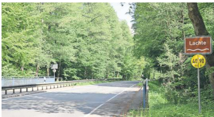
In der Sprache wurde das Tempo auf 80 reduziert.

Auf Grundlage von der Straßenverkehrsordnung und der verkehrspolitischen Strategie „Vision Zero“ besteht angesichts der wiederholt tödlichen Unfälle ein unmittelbares Handlungsgebot. Ab sofort gilt auf dem gesamten Abschnitt eine Höchstgeschwindigkeit von 80 Stundenkilometer. Im Bereich der S-Kurve wird zusätzlich ein Überholverbot eingerichtet. Ein Hinweispiktogramm „Unfallgefahr“ soll die Akzeptanz der Beschränkung erhöhen. Die Verkehrswacht flankiert die Maßnahmen mit einer Hinweiskampagne.