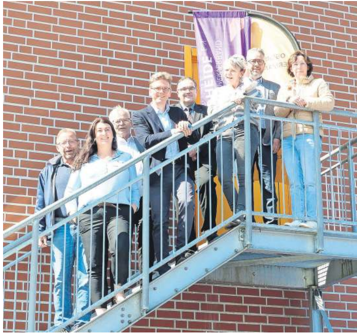
Die Kooperation zwischen den teilnehmenden Betrieben und Schulen ist ein Konzept mit Erfolg.

Der Ausbildungsflyer des Unternehmerverbandes erscheint jedes Jahr in neuer Auflage und wird den Schülern zur Verfügung gestellt. Infos gibt es auch online unter www.meine-zukunftinsuedheide.de .