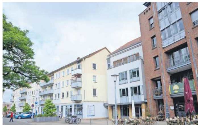
Viele Firmen und Institutionen haben hier ihren Sitz.

Die Sparkasse Celle-Gifhorn-Wolfsburg hat auf dem Lauensteinplatz eine Filiale. Dort wurde in die Sicherheit des SB-Geldautomaten investiert und die Baumaßnahmen abgeschlossen.