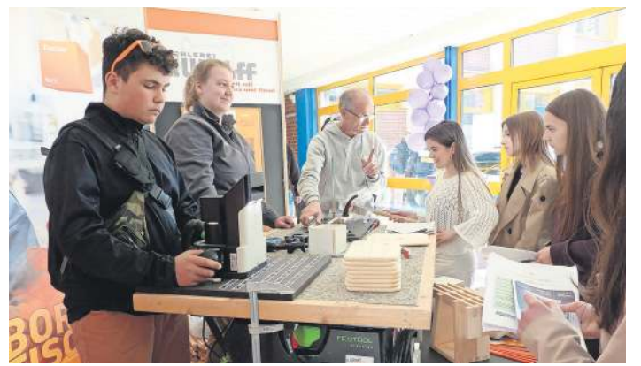
Schülerinnen und Schüler konnten an den Messeständen aktiv mitmachen.