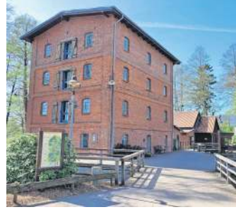
Vor der Kulisse der historischen Wassermuhle findet im Juni erneut das Muden Open Air statt. Foto: J. Muller

MUDEN. Der Sommer kann kommen: Der Ticketverkauf fur das Muden Open Air unplugged ist gestartet. Am Samstag, 13. Juni, verwandelt sich die historische Wassermuhle in Muden erneut in eine stimmungsvolle Open-Air-Buhne - gemutlich, akustisch und voller Emotionen. Musikliebhaber durfen sich auf ein hochkartiges Line-up freuen: Mit „The Sparrows“ kommt ein beeindruckendes Duo aus der Region nach Muden, das