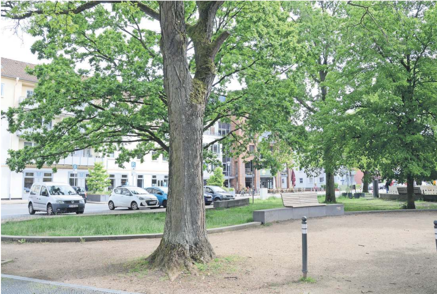
Der Lauensteinplatz lädt zum Verweilen ein.