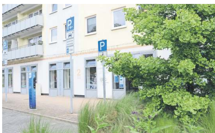
Die Zweigstelle der Stadtbibliothek ist hier zu finden.

Auch vom in der Nähe liegenden Heeseplatz gibt es etwas Neues zu berichten. Die Mohren-Apotheke erweitert ab dem Frühjahr dieses Jahres ihre Räumlichkeiten, um ihr Angebot für den Stadtteil Heese-Neustadt weiter auszubauen. Durch die Vergrößerung entstehen zusätzliche Beratungsplätze, die eine noch diskretere und intensivere Betreuung ermöglichen. Zudem sollen neue Services das gesundheitliche Angebot vor Ort stärken und den steigenden Bedürfnissen der Kundinnen und Kunden gerecht werden. Mit der Erweiterung setzt die Mohren-Apotheke ein klares Zeichen für die wohnortnahe Versorgung und unterstreicht ihre Bedeutung als wichtiger Anlaufpunkt im Stadtteil. Die Modernisierung schafft mehr Raum für persönliche Beratung, Serviceleistungen und ein angenehmes Ambiente. Während der gesamten Umbauphase bleibt die Apotheke selbstverständlich durchgehend geöffnet und steht den Bürgerinnen und Bürgern wie gewohnt zuverlässig zur Verfügung.