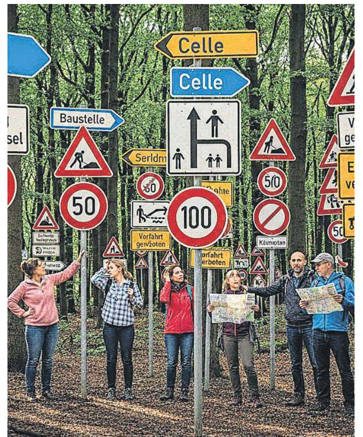
Ein Wald aus Wegweisern verschluckt jede klare Orientierung.

Die Stadt rechnet damit, dass die komplette Überprüfung der Beschilderung zwei bis drei Jahre in Anspruch nehmen wird. Die Aktion soll schrittweise auf das gesamte Stadtgebiet ausgeweitet werden.