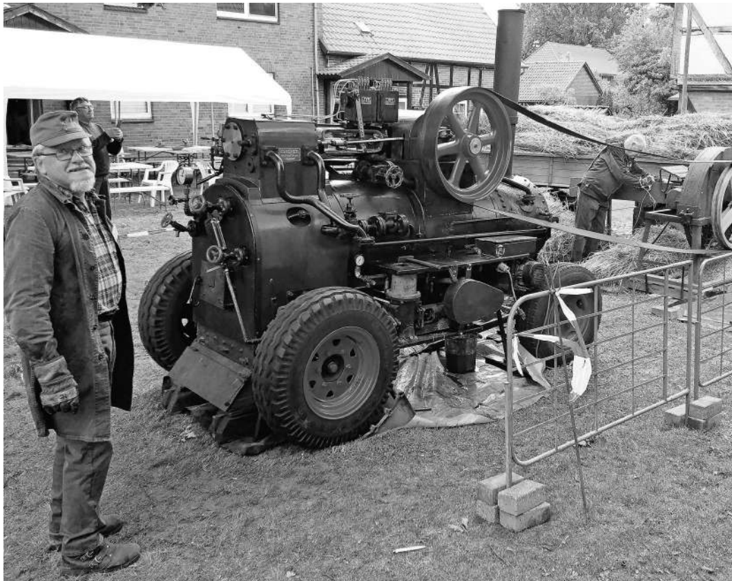
Die Dampflokmobile wird angeheizt.

Die Museumskaffeestube bietet selbstgebackenen Kuchen an. Der Eintritt ist frei.