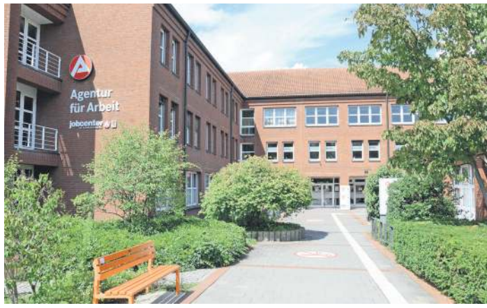
Die Agentur für Arbeit in Celle.

Die Unterbeschäftigung lag nach vorläufigen Angaben im