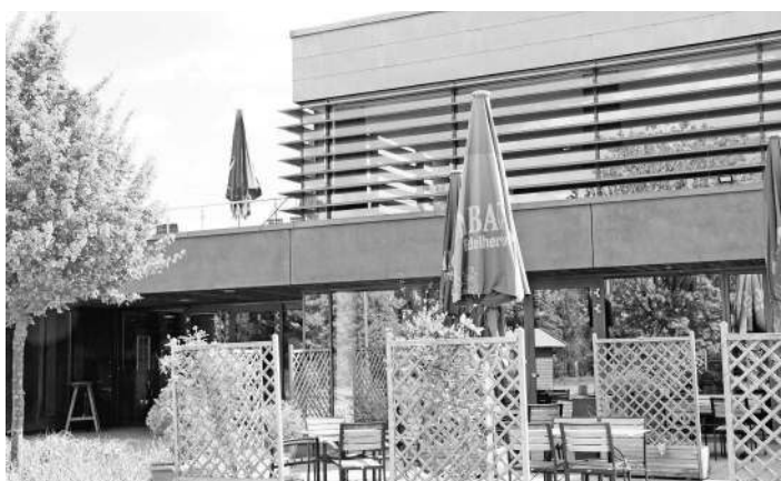
Der Fachtag fand im 4-Generationen-Park Wathlingen statt.

Der Fachtag machte deutlich: Gemeinsam, vernetzt und mit klarem Blick auf die Bedürfnisse der Kinder können alle Beteiligten den Übergang von der Kita in die Schule nachhaltig stärken und positiv gestalten.