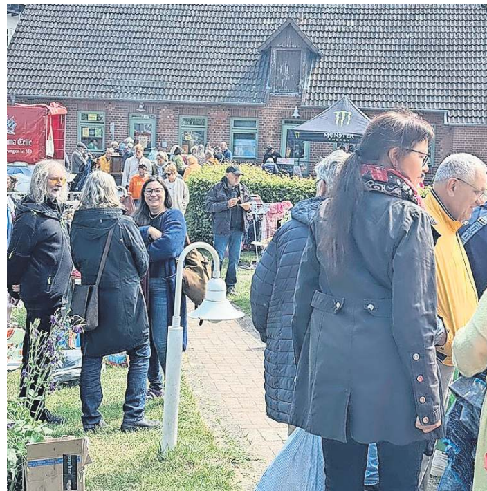
Der achte Stadtteilflohmarkt im Hehlentor lädt zum Stöbern und Verweilen ein.

Picknickkörbe mit Essbarem dürfen mitgebracht werden, ein Getränkeangebot steht vor Ort zur Verfügung. „Zahl was du magst“ – Der Eintritt ist frei. Vor Ort gibt es die Möglichkeit einen angemessenen Betrag in den „Hut“ zu werfen, diesen erhalten die Künstlerinnen und Künstler vollständig.