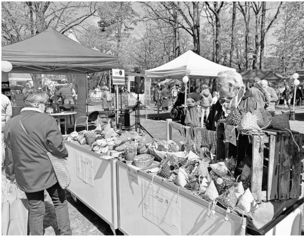
Das Frühlingsfest lockte viele Besucherinnen und Besucher an.

Und Schoeps ist sich sicher: „Der Wunsch danach ist vorhanden.“ Er appelliert an die Stadtverwaltung: „Lassen Sie uns das gemeinsam ausprobieren.“