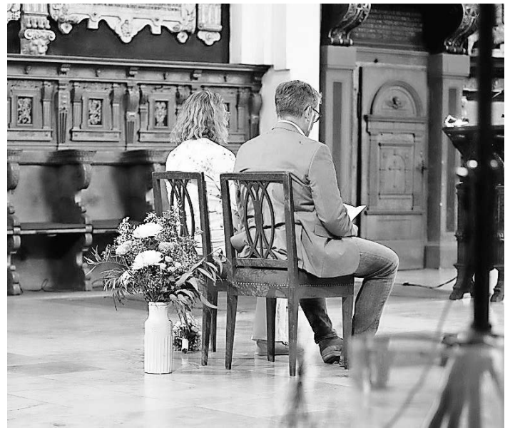
Eine Trauung im vergangenen Jahr.

Am zweiten Wettkampftag waren die Strapazen des ersten Tages deutlich spürbar, doch Zimmer blieb fokussiert und motiviert. Im Sprint bewies sie erneut Nervenstärke und konnte sich nach einem verhaltenen ersten