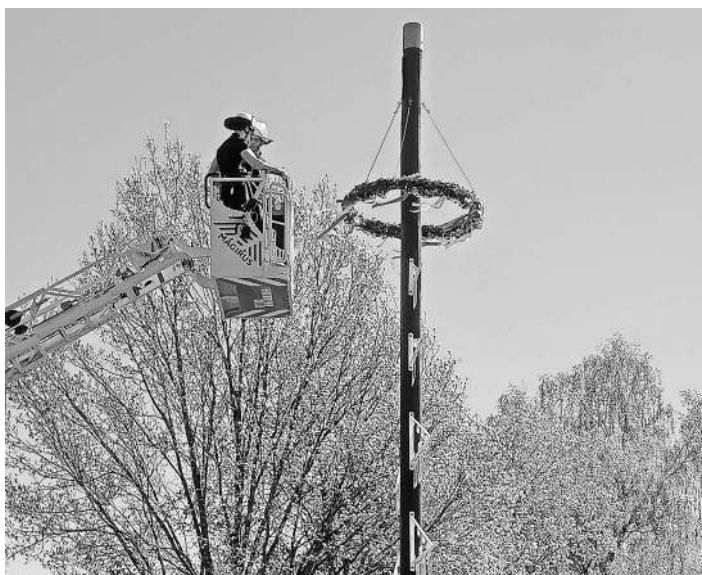
Beim Aufstellen des Maibaumes.