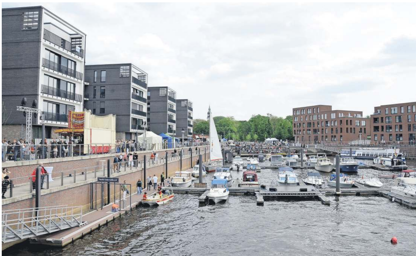
Das Hafenfest lockte am vergangenen Wochenende zahlreiche Besucher an.

CELLE. Am Mittwoch, 3. Juni, von 15.30 bis 17.30 Uhr laden die TrauerLebensWelten von Hospiz Celle wieder zum Gesprächskreis für Trauernde ein. Hier kann man im geschützten Raum und im Austausch mit anderen, offen über die persönliche Situation sprechen – unabhängig davon, wie lange der Verlust schon zurückliegt. Das Treffen findet im Zentrum für ehrenamtliche Hospizarbeit in der Guizettistraße 3 statt. Anmeldung bitte bis Mittwoch, 27. Mai, per Mail an trauer@hospiz-celle.de oder unter Telefon 05141/2199006. Vor der ersten Teilnahme wird zudem um ein Einzelgespräch gebeten; bitte einen Termin unter obiger Telefonnummer vereinbaren.