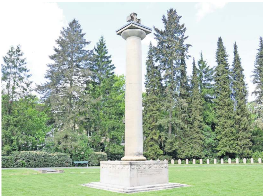
Der Gedenkbereich mit der Erste-Weltkrieg-Säule auf dem Celler Stadtfriedhof.