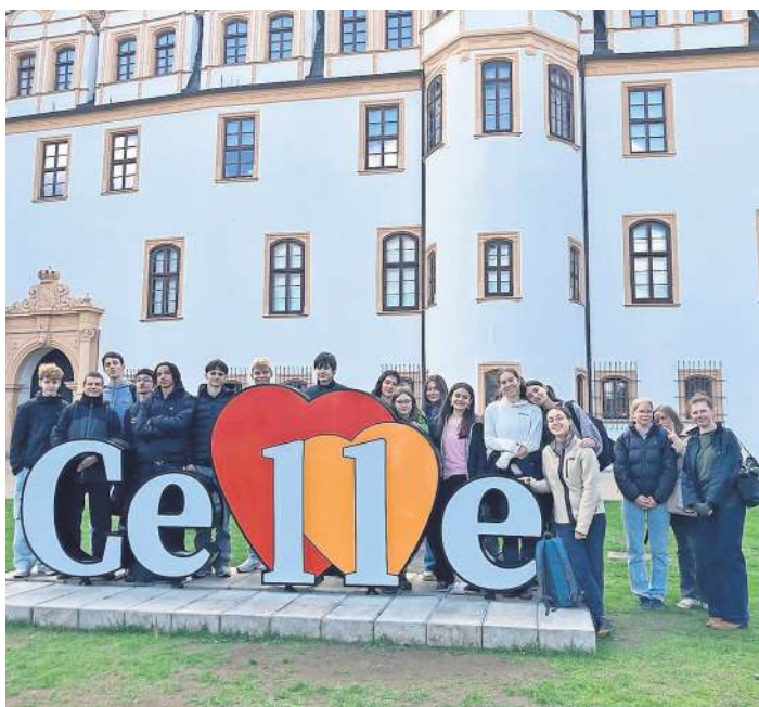
Die Schüler vor dem Schloss.

Am Samstagmorgen traten die Gäste aus Frankreich mit vielen schönen Erinnerungen im Gepäck ihre Rückreise an. Einige der Jugendlichen haben ihr Wiedersehen schon geplant, vielleicht wird der Wunsch nach längerfristigen Freundschaften also wahr. Und der nachfolgende Jahrgang freut sich schon auf die nächste Begegnung mit den Schülerinnen und Schülern aus Meudon.