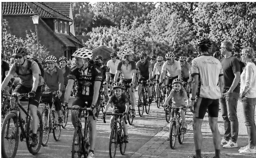
Die Rad-Touren-Fahrt „Oberes Örtzetal“ feiert in diesem Jahr Jubiläum.

Für alle Teilnehmer gilt eine Helfpflicht sowie die Einhaltung der Straßenverkehrsordnung. Die Teilnahmegebühren betragen für das RTF für Erwachsene zehn Euro, für BDR-Mitglieder acht Euro und für das Volksradfahren fünf Euro. Kinder und Jugendliche fahren bis 18 Jahren kostenfrei mit. Ob als sportliche Herausforderung oder entspannter Ausflug ins Grüne - die 20. RTF „Oberes Örtzetal“ verspricht einen unvergesslichen Tag auf dem Rad. Wer noch Training braucht: Für Interessierte aus Müdens Umgebung bietet der MTV Müden (Örtze) Trainingsangebote an. Schon jetzt treffen sich Rennrad-sportler/-innen donnerstags und Mountainbiker dienstags jeweils um 18 Uhr zum gemeinsamen Training in der Gruppe an Müdens Turnhalle.