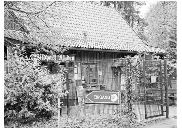
Der Wildpark Müden.

bildeten Zootierpfleger sowie einen zertifizierten Falkner für die Greifvogelhaltung geleitet werden. Als Auflage ist bis zum 31. Dezember 2026 eine Sicherheit, zum Beispiel in bar oder in Form einer Bankbürgschaft, in Höhe von 55.600 Euro zu hinterlegen. Sie stellt sicher, dass im Falle einer Schließung oder Insolvenz die Tiere für mindestens sechs Monate ordnungsgemäß versorgt werden können, ohne dass öffentliche Mittel herangezogen werden müssen. Die bestehende Greifvogelvoliere ist nicht Bestandteil der erteilten Genehmigung. Es wurden tierschutzrechtliche Mängel festgestellt - darunter Überbesatz, fehlende Schlaf- und Ausweichbereiche sowie tierschutzwidrige Haltung bestimmter Arten. Zudem wurden bauliche Veränderungen ohne Anzeige vorgenommen. Der Betreiber hat innerhalb von zwei Monaten aktualisierte Bauvorlagen sowie ein Konzept zur tierschutzgerechten Umgestaltung einzureichen.