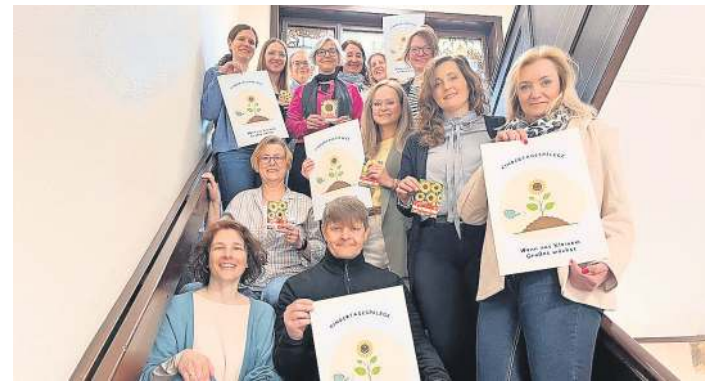
Die Mitarbeiterinnen und Mitarbeiter der Fachberatung Kindertagespflege des Landkreises Celle mit den Postkarten mit einem Dankesgruß und Sonnenblumensamen für die Tagespflegepersonen.

„Aktuell werden im Landkreis Celle rund 350 Kinder im Alter von null bis drei Jahren in der Kindertagespflege betreut“, erklärt Jugend- und Sozialdezernentin Dr. Wiebke Wietschel. Den Mitarbeiterinnen und Mitarbeitern der örtlichen Familienbüros, die den Eltern als Ansprechpartner für die Vermittlung von Betreuungsplätzen in der Kindertagespflege zur Verfügung stehen, wurde die Aktion im Rahmen eines Austauschtreffens durch die Fachberatung Kindertagespflege des Landkreises Celle vorgestellt.