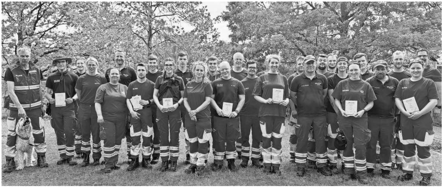
Teilnehmer der DLRG übten verschiedene Einsatzabläufe während der Helfergrundausbildung im Bezirk Celle.

„Wir werden die Situation natürlich weiter beobachten“, verspricht der OB.