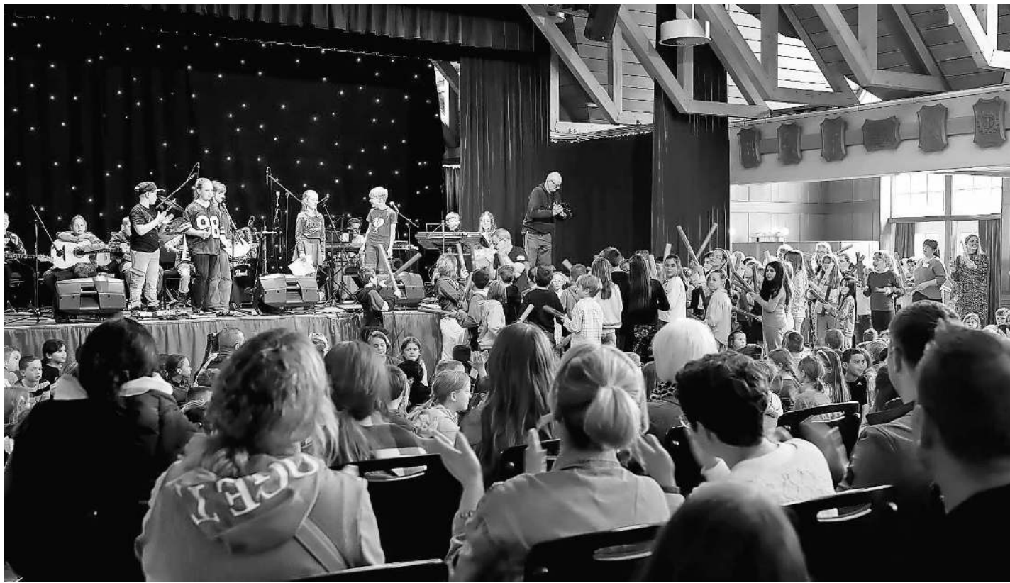
Die Abschlussveranstaltung im Stadthaus Bergen.