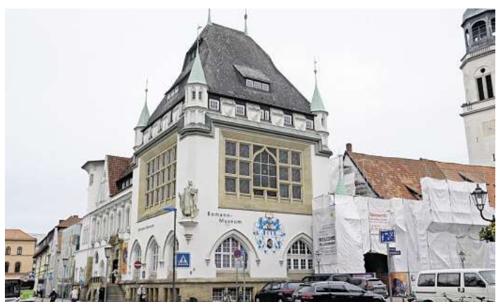
Im Bomann-Museum findet eine Führung statt.

Alltag völlig anders aussehen, als zu Zeiten unserer Eltern und Großeltern. Bei Gegenständen wurden Funktionen überdacht, Formen dem Zeitgeschmack angepasst oder die Technik weiterentwickelt. Die rapide Veränderung der Arbeitswelt hat Hunderte von ausgestorbenen Berufen hinterlassen. Früher selbstverständliche Accessoires wie der Pelzkragen sind seit Jahren im Sinne des Artenschutzes verpönt.