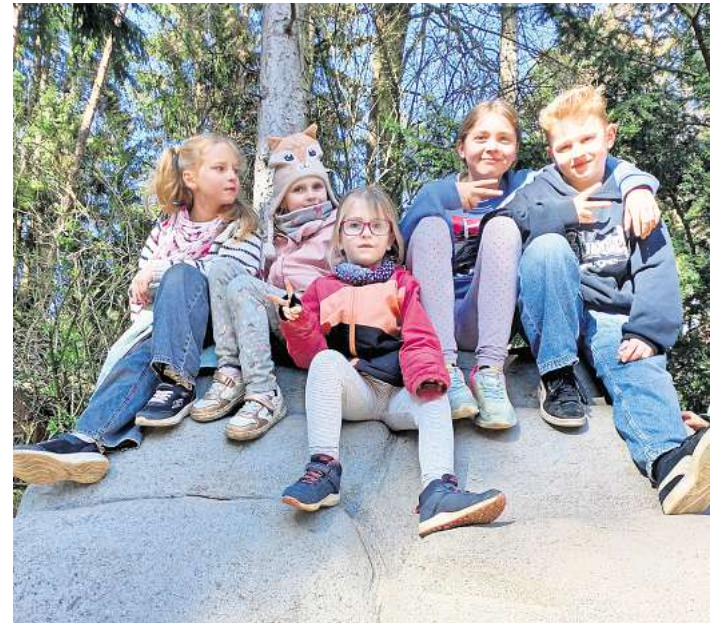
Die Ferienpassaktionen zu Ostern wurden gut angenommen.