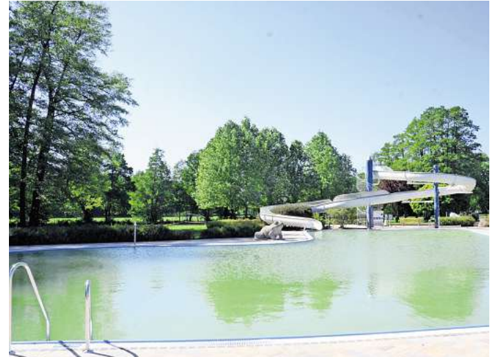
Überall im Landkreis öffnen die Freibäder.

Das Waldschwimmbad Herrenbrücke in Faßberg ist aufgrund von Sanierungsarbeiten derzeit noch geschlossen.