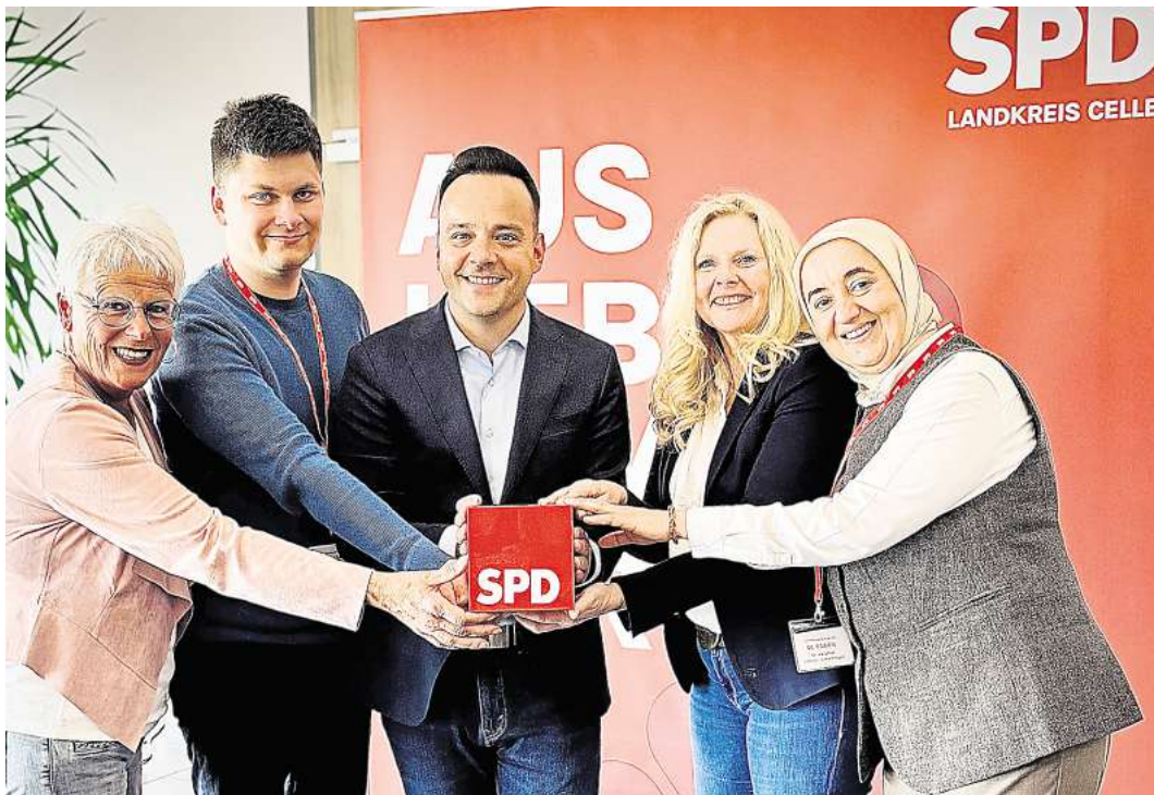
Die Spitzenkandidaten in den fünf Wahlbereichen zur Kreistagswahl.

Die vielfältigen Aktionen wurden sehr gut angenommen und konnten die Osterferien für die Kinder bereichern.