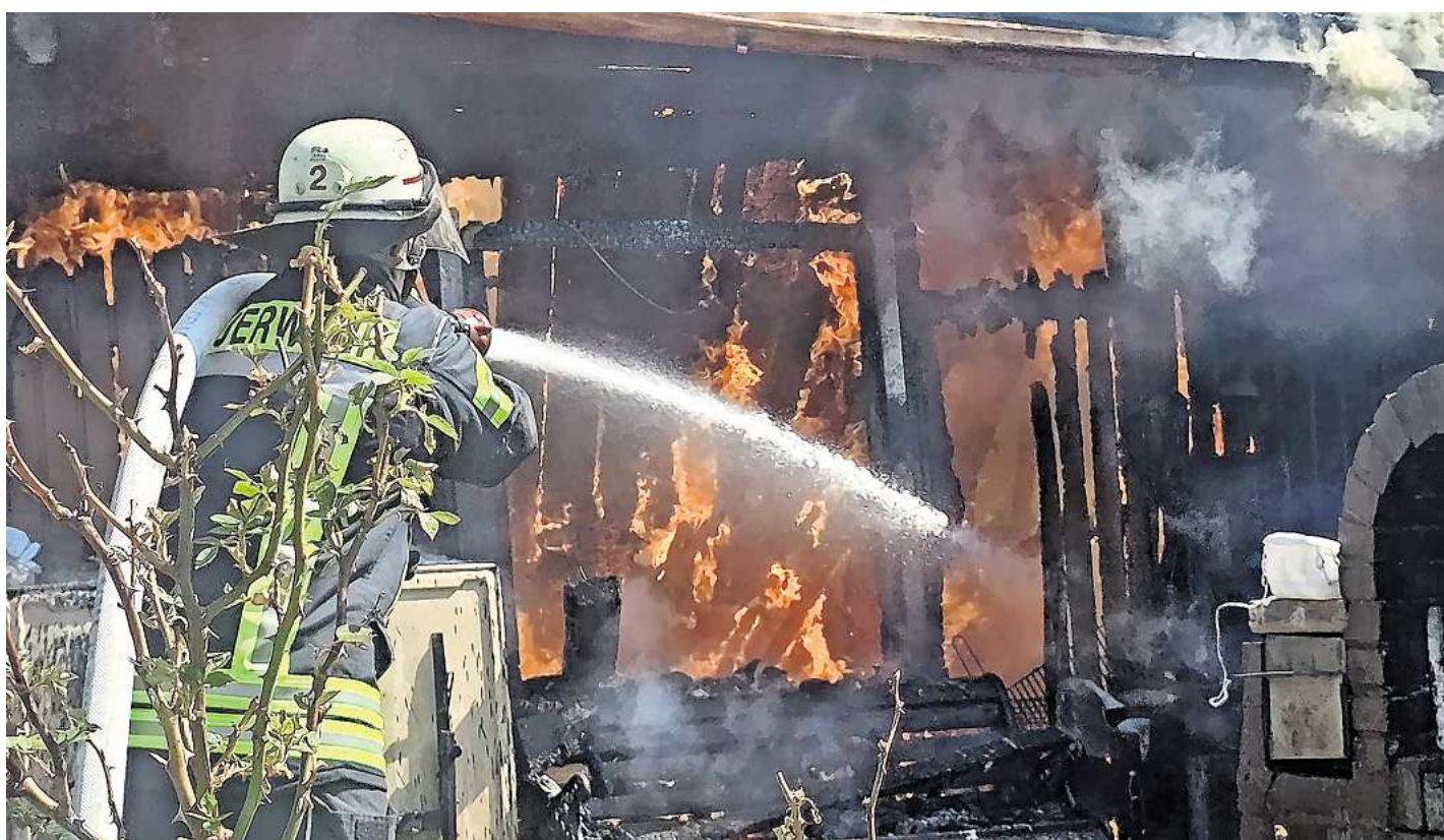
Bei der Brandbekämpfung.