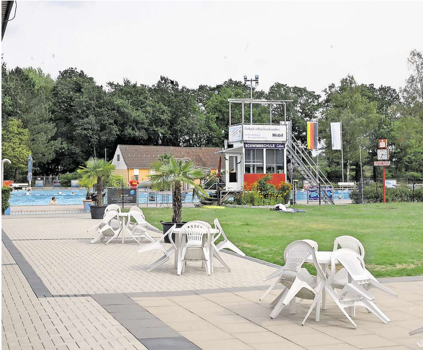
Das Freibad Westercelle erwartet die Gäste.

Schwimmen, planschen, sonnenbaden – im Landkreis Celle startet die Freibadsaison