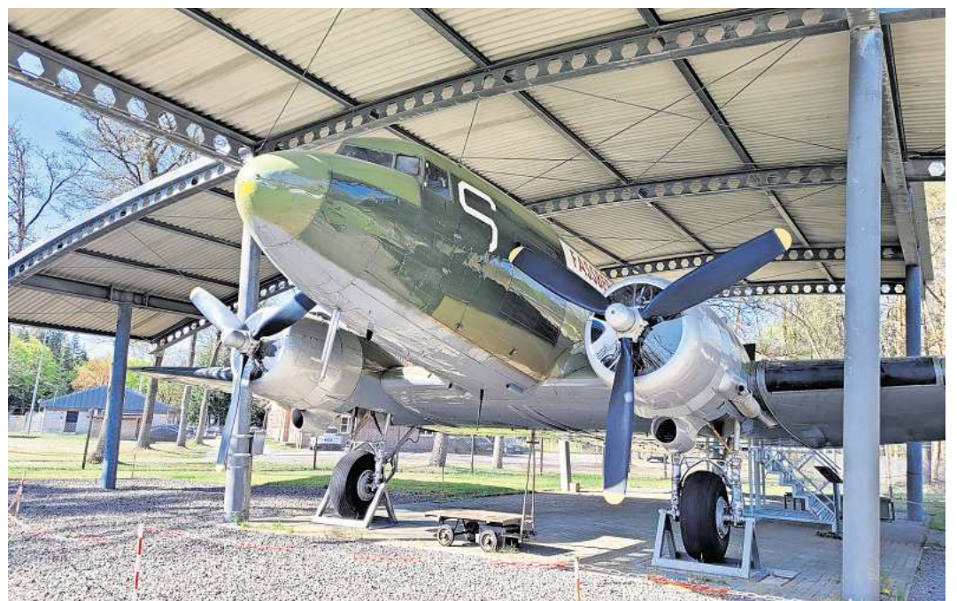
Anlässlich des Internationalen Museumstages ist der Eintritt ins Luftbrückenmuseum am 17. Mai kostenlos.

Brücken bauen - zwischen Generationen, Kulturen und unterschiedlichen Lebensrealitäten. Sie fördern Dialog statt Polarisierung und schaffen Räume, in denen Vielfalt als Bereicherung erlebt wird. Das Motto unterstreicht, dass Museen zu mehr Austausch, Teilhabe und einem respektvollen Miteinander beitragen.