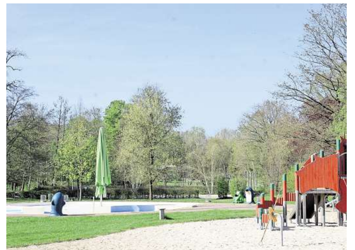
Die Freibäder sind für die neue Saison bereit.