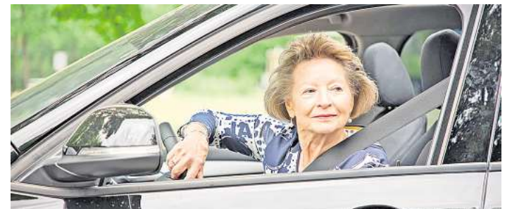
Das Programm „sicher mobil“ soll älteren Menschen Mut machen, sich im Straßenverkehr souverän zu bewegen.

zunächst einem der beteiligten Verbände anschließen, die Anmeldung ist unkompliziert. Für dieses Ehrenamt sollte man Freude an der Arbeit mit älteren Menschen haben und mit Begeisterung den spannenden Prozess der sicheren Verkehrsteilnahme begleiten. Angehende Moderatorinnen und Moderatoren sollten Spaß daran haben, lebensnahe Ratschläge und Hintergrundinformationen zur gefahrlosen Teilhabe am Straßenverkehr zu vermitteln. Aktuell liegt das Einstiegsalter bei den Moderatorinnen und Moderatoren zwischen 45 und 65 Jahren. Für jede Moderation gibt es eine Aufwandsentschädigung. Alle Infos gibt es unter www.dvr.de/praevention/programme/sicher-mobil . (djd)