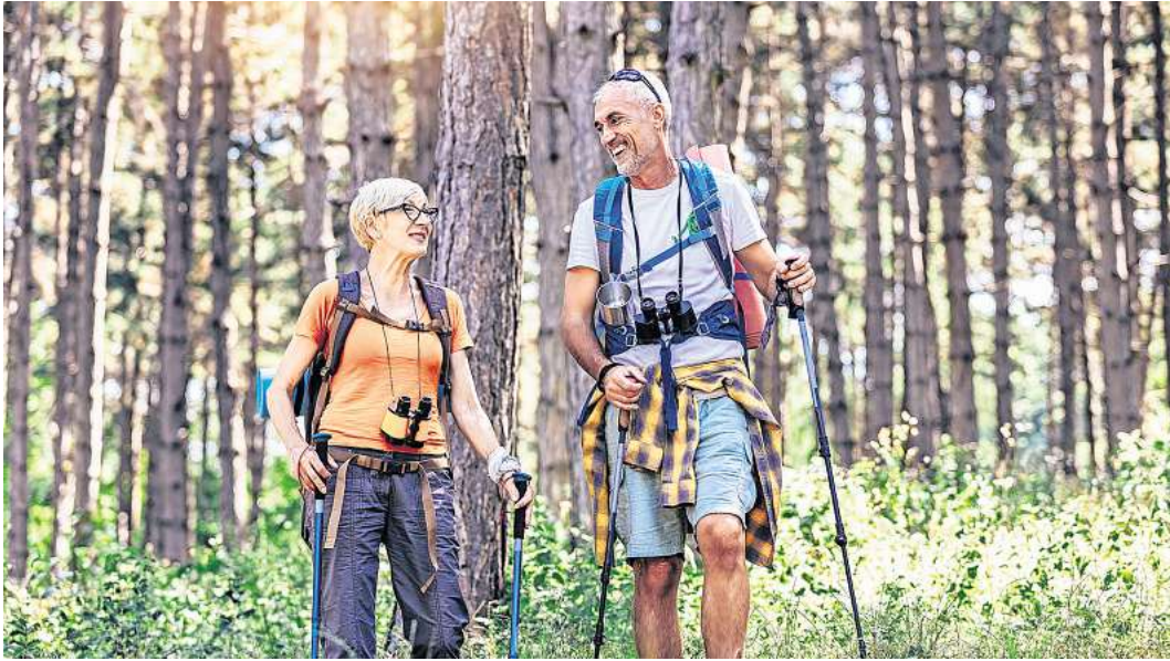
Gemeinsame Wanderungen in der Natur machen Spaß, sind gut für die Gesundheit und helfen dem Körper dabei, wertvolles Vitamin D bilden zu können.