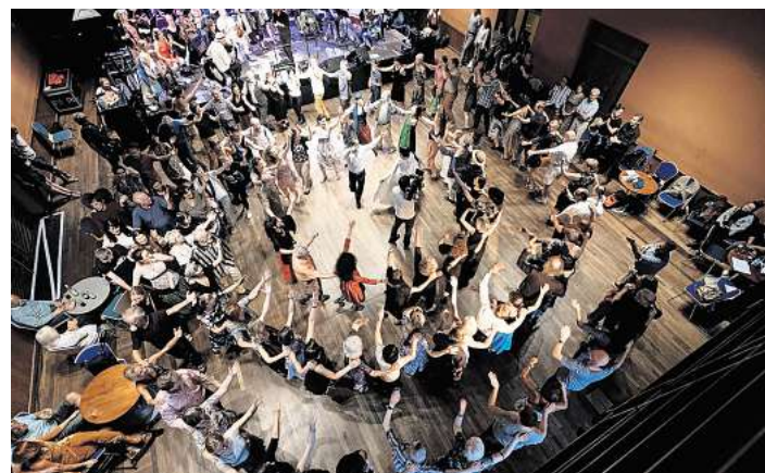
Jiddische Tänze stehen im Mittelpunkt eines Workshops im Celler Stadtarchiv.