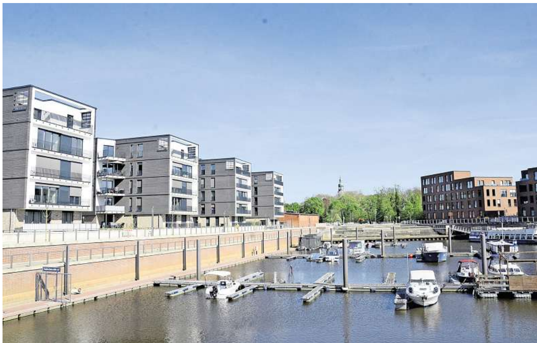
Der Hafen von Celle.

Für alle, die sich für altes Handwerk interessieren, modernes Design und hochwertiges Material schätzen sowie regionale Produkte bevorzugen, ist ein Bummel über diesen Markt ein Muss. Geöffnet ist „Exklusiv & Schön“ Samstag von 10 bis 18 Uhr und Sonntag von 11 bis 17 Uhr. Der Eintritt ist frei.