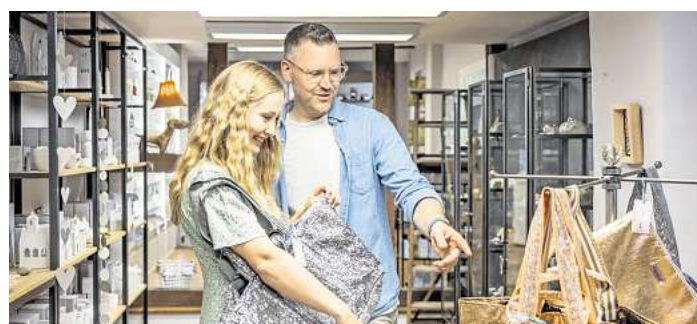
Die Shoppingmöglichkeiten in der Innenstadt sollen bald um weitere kreative Geschäftsideen bereichert werden.

Interessierte können bis Mitte Mai eine Kurzbewerbung per Mail an marketing@celle.de senden. Gesucht werden interessante Konzepte, hochwertige Produkte und engagierte Menschen aus Celle und der Region, die Lust haben, gemeinsam neue Wege zu gehen.