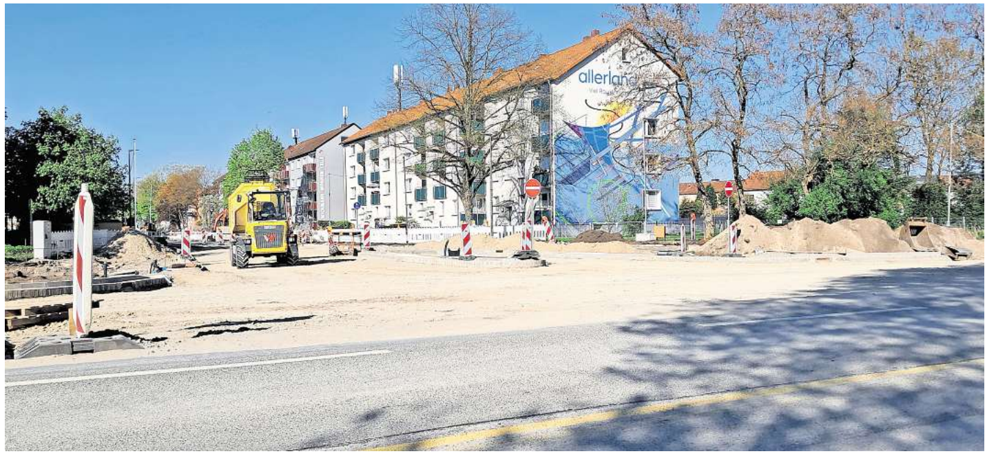
Die Welfenallee, Einmündung Wilhelm-Heinichen-Ring: Keine Durchfahrt für Busse bis 13. Mai.