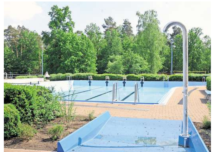
Jetzt müssen nur noch die Temperaturen stimmen.