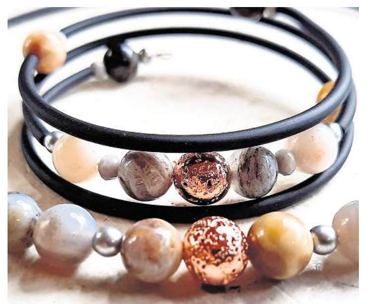
Auch Schmuck wird angeboten.

Der international bekannte Pianist Alexander Vorontsov wird um 20 Uhr ein Open-Air-Konzert direkt am Wasser ge-