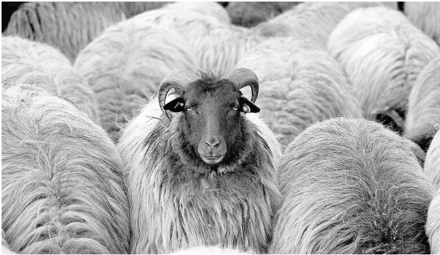
Kunst am Heidschnuckenweg können Besucher im neu geschaffenen „KunstRaum“ in Müden bewundern.