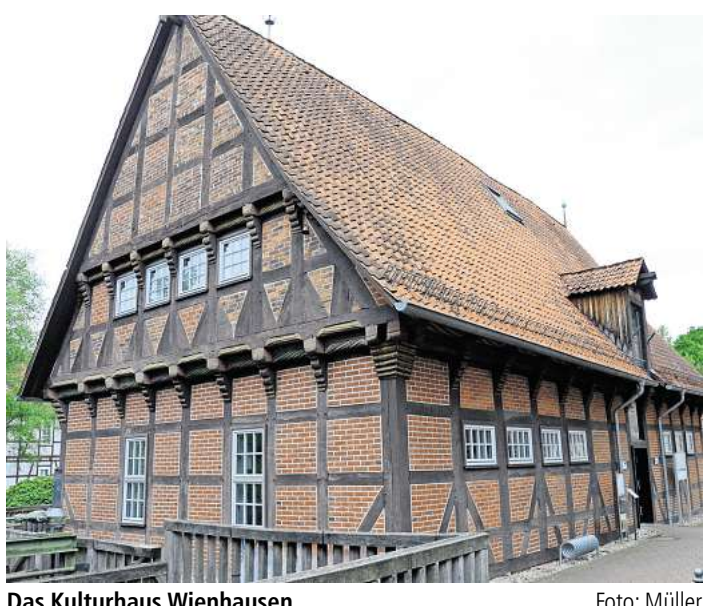
Das Kulturhaus Wienhausen.

7 Zimmer | 157 m² | 249.900,- € Festpreis Impuls 157 Wärmepumpe, Sicherheitsfenster 3-fach verglast, Rolläden, Gästezimmer im EG, inkl. Ausbaureserve, Drempel 1,31 m ☎ 0531/87 70 40 Westermann Massivhaus GmbH, 38122 BS, Steinberganger 2