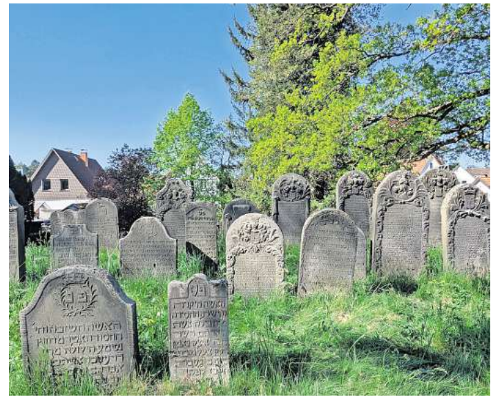
Der jüdische Friedhof in Celle.

„Das Ehrenamt ist das Herz unserer Gesellschaft. Mit diesem Ehrenamtspreis möchte ich den vielen engagierten Menschen im Wahlkreis Danke sagen und ihr Engagement würdigen, wie es auch angebracht ist“, so Wille.