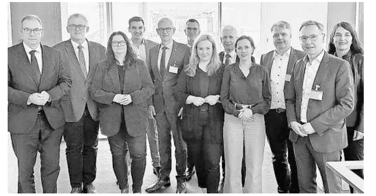
Beim Treffen in Berlin mit Vertretern der Landkreise Celle, Heidekreis und Uelzen und den Bundestagsabgeordneten ging es um die Zukunft der Verkehre auf der Schiene.

Gleichzeitig gilt: Die Diskussion um eine Neubaustasse ist mit erheblichen Unsicherheiten verbunden – auch hinsichtlich der konkreten Ausgestaltung.