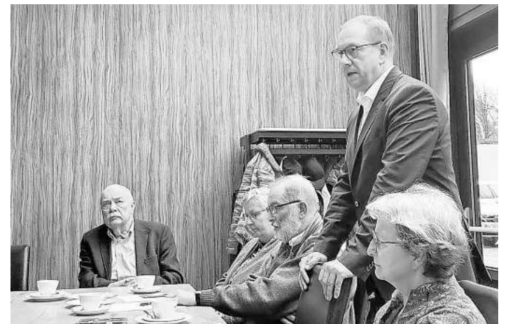
Henning Otte sprach bei der Senioren Union.

Die Veranstaltung bot den Teilnehmern einen interessanten Einblick in die Arbeit des Wehrbeauftragten und unterstrich die Bedeutung des direkten Dialogs zwischen Politik und Bürgern.