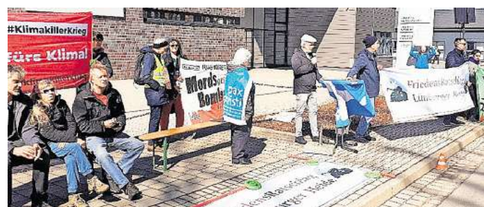
Vor dem Rheinmetall - Verwaltungsgebäude in Unterlüß.

Der Ostermarsch in Unterlüß zeigte einmal mehr - Friedensengagement lebt von der Vielfalt seiner Akteure, der Stimme der Jugend und dem Zusammenspiel von gesellschaftlichen Gruppen - ein deutliches Signal gegen Aufrüstung und für eine humane Zukunft.