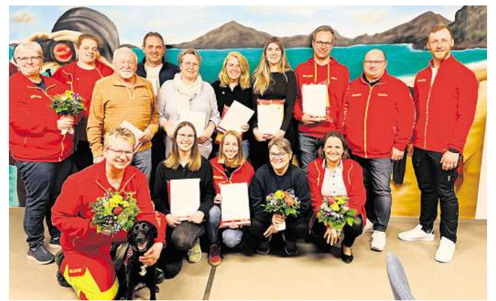
Die Jahreshauptversammlung der DLRG-Ortsgruppe Unterlüß.

Die Veranstaltung endete mit dem Appell, politische Entscheidungen stärker an langfristiger finanzieller Stabilität auszurichten. Dabei wurde auch die Bedeutung von Freiheit und Eigenverantwortung hervorgehoben – Werte, die aus Sicht der FDP eine zentrale Rolle für die zukünftige Entwicklung spielen.