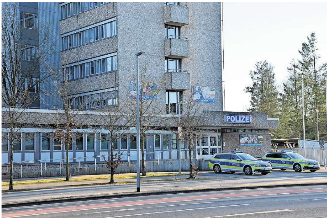
Polizeidienststelle in Celle.

Für weitere Informationen rund um den Kleidermarkt können sich Interessierte unter Telefon 0173/ 744979 melden.