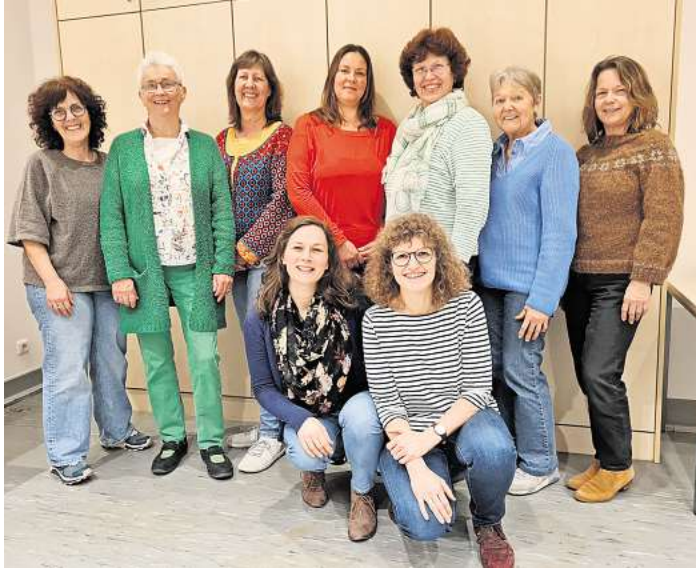
Der neugewählte Vorstand.