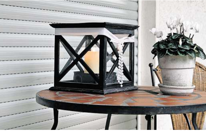
Fachmännisch geplanter Sonnenschutz reduziert im Winter die Heizenergieverluste über Fenster und Türen.