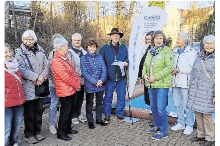
Empfang am Wassertretbecken des Kneipp-Vereines.

Interessierte können Clemens Weg auf Instagram verfolgen und auch gern über kontakt@bodo-spendenlauf.de mit Spenden unterstützen.