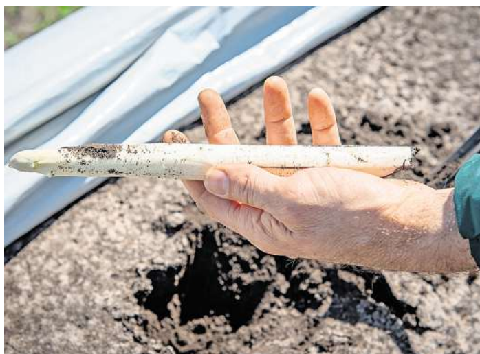
In Niedersachsen hat die Spargelernte begonnen. Mit steigenden Temperaturen sind wachsende Erntemengen zu erwarten.

gen. Neben der Arbeit auf den Feldern gilt es jetzt gleichzeitig die Vermarktung vorzubereiten und das Personal zu schulen. Zur Unterstützung befinden sich bereits Saisonarbeitskräfte auf den Betrieben – zumindest da, wo die Ernte schon losgeht.