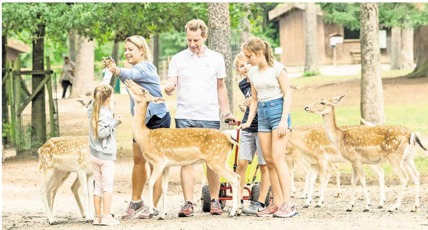
Zwischen Schlagzeilen und Alltagsorgen bieten Freizeitparks Familien einen Ort für Erinnerungen, Leichtigkeit und Abenteuer bei flexibler Reiseplanung und überschaubaren Kosten.

Am 15. April, um kommunale Verkehrsplanung und am 20. Mai, um Kinderbetreuung und Ganztagsangebote. Eine Anmeldung wird erbeten. Ziel der Veranstaltungsreihe ist der offene Austausch zwischen Politik und Bürgerschaft.