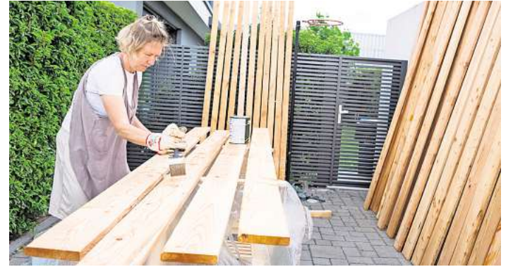
Alte und auch neue Terrassendielen bleiben länger haltbar und ansehnlich, wenn sie mit einer Lasur oder mit Holzöl behandelt werden.