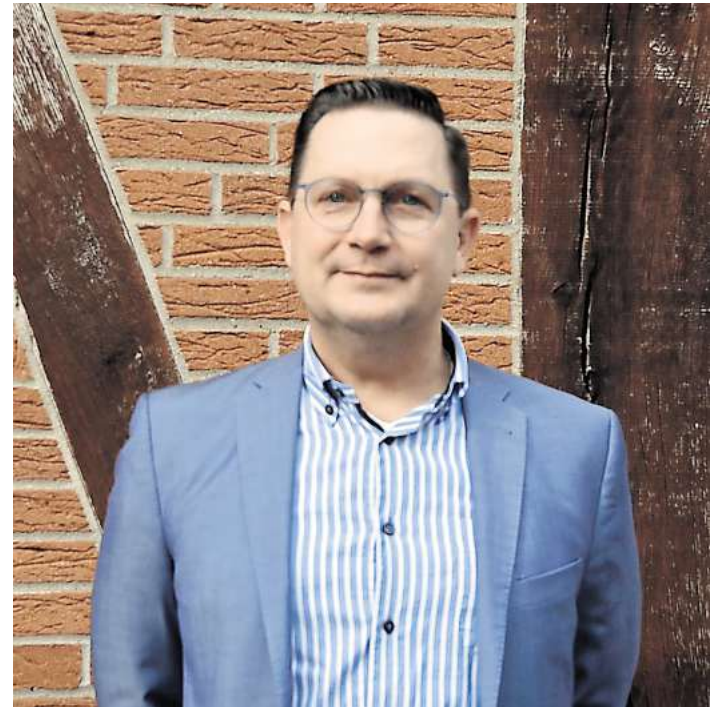
Alexander Wille Mdl.

Abschließend kündigt Wille an, das Thema weiter mit Nachdruck im Landtag voranzutreiben: „Wir als CDU werden dafür sorgen, dass die NPOG-Novelle nicht zu einer weiteren Beruhigungsschraube wird: Wir begleiten das Verfahren kritisch, stellen jede Verzögerung öffentlich und bringen Verbesserungen ein, damit am Ende nicht langwierige Prüfungen, sondern echter Schutz herauskommt.“