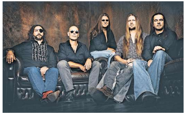
Purple Rising.

Da die Teilnehmerzahl begrenzt ist, bittet der Museumsverein um Anmeldung in der Geschäftsstelle, mittwochs von 10 bis 12 Uhr unter Telefon 05141/124512 oder per Mail an info@museumsvereincelle.de