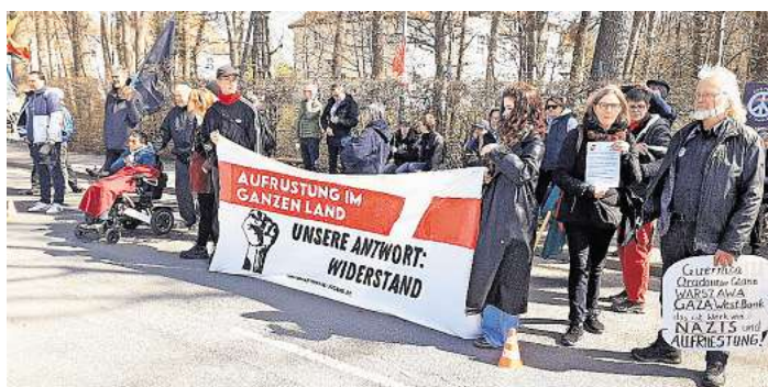
Der Ostermarsch 2026 mit Jugendgruppen, Friedensinitiativen und gesellschaftliche Vertreter.

UNTERLÜSS. Vergangenen Samstag versammelten sich rund 250 Menschen in Unterlüß zu einem eindrucksvollen Ostermarsch 2026. In dem kleinen Dorf mit 3.400 Einwohnern machten die Teilnehmenden unter dem Motto „Es sind nicht unsere Kriege – wir wollen Frieden“ auf die Gefahren von Militarisierung und Rüstungsproduktion aufmerksam. Der Friedensmarsch führte durch das Dorf und endete vor dem Verwaltungsgebäude des Rüstungskonzerns Rheinmetall.