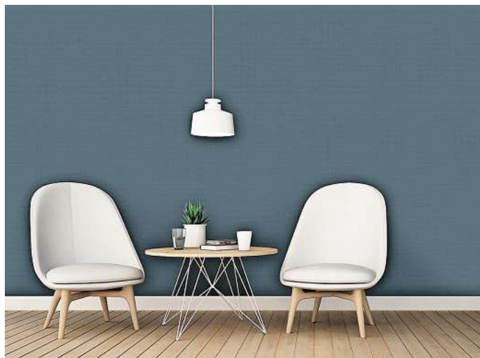
Glasfasertapeten sehen nicht nur gut aus, sie können auch die Raumakustik verbessern und den Heizenergieverbrauch senken.

sentlich langsamer ins Mauerwerk, es wird also schneller warm im Raum. Das spart Energie. Gleichzeitig verbessert sich die Akustik - die Tapete ist in die Schallabsorberklasse E eingestuft und reduziert störenden Hall. Das macht sich vor allem in größeren Räumen deutlich bemerkbar. Das Glasfasergewebe ist zudem emissionsfrei, was sich positiv auf das Raumklima auswirkt. Die Multitalente aus Glasfaser werden in Rohweiß geliefert und können in allen denkbaren Farben gestrichen werden. Zudem gibt es sie in zwei verschiedenen Struktur-Designs. (txn)