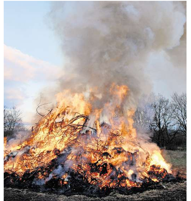
Wir wünschen allen unseren Lesern, Kunden und Zustellern ein frohes Osterfest.

Und wie wird das Osterfest in Österreich und der Schweiz gefeiert? In der Schweiz gibt es zahlreiche Bräuche, wobei man das Osterfest von Kanton zu Kanton ganz unterschiedlich feiert. Der Ostersonntag beginnt dort genau wie hier in Deutschland vielerorts mit der Suche nach Ostereiern, die vom Osterhasen in der Nacht zuvor versteckt wurden. Im italienischsprachigen Kanton Tessin finden zum Beispiel am Gründonnerstag und am Karfreitag Osterprozessionen statt, mit denen die biblische Passionsgeschichte dargestellt wird. In einer in der Nähe von Genf gelegenen Ortschaft dekoriert man zu Ostern die Brunnen mit Bändern, Zweigen, Blumen sowie bunten Eiern. Der Ursprung hierfür ist ein alter deutscher Brauch. Die Verteilung von Käse, Brot und Wein gehört in einzelnen Ortschaften im Kanton Wallis zu einer sehr alten Tradition zum Osterfest. Osterfestspiele mit zahlreichen Konzerten werden in Luzern aufgeführt. In einem Dorf bei Bern werden am Nachmittag des Ostersonntag Holzstecken geworfen. Das wird „Knütteln“ genannt, eine Tradition, die früher im gesamten Emmental ver-