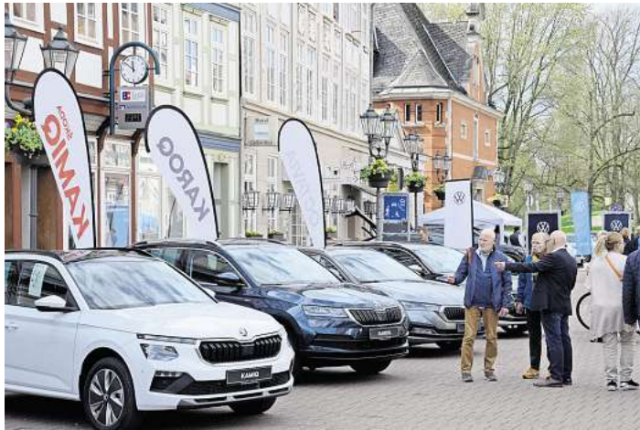
Fahrspaß, Innovation und Highlights.

Die Auto-Show kann von 11 bis 18 Uhr besucht werden.