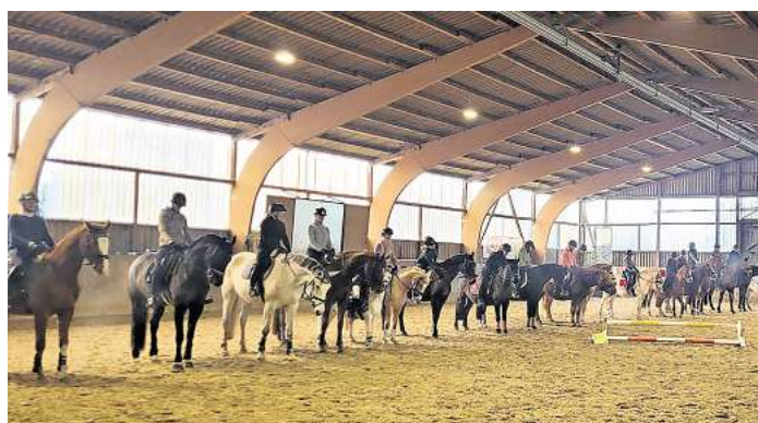
Am Jahresabschluss haben 19 Pferde und Ponys teilgenommen. Der Verein wächst und hat immer mehr aktive Mitglieder – besonders im Nachwuchsbereich.