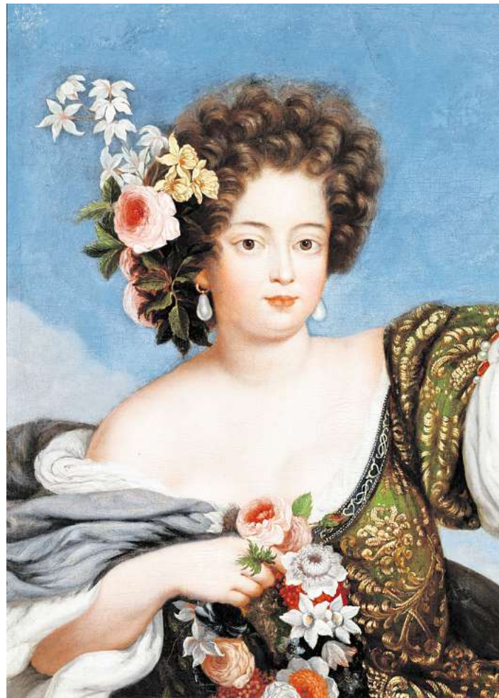
Sophie Dorothea von Braunschweig-Lüneburg als Flora.

Das Residenzmuseum greift diese bewegende Geschichte mit einem vielfältigen Programm auf. Bereits am Vormittag beginnt der Eléonore-Tag mit einem Gottesdienst in der evangelisch-