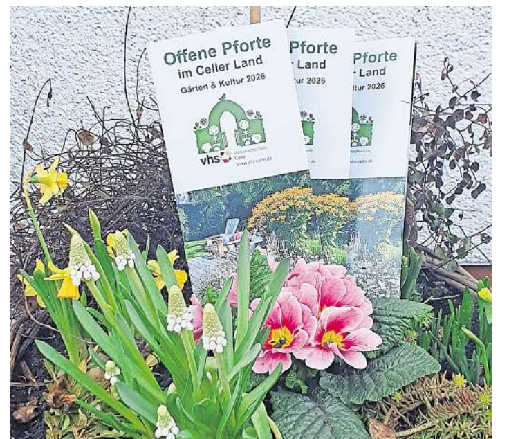
Die neue Broschüre „Offene Pforte 2026“ ist da.

Alle Gärten mit Beschreibung und Öffnungszeiten stehen in der frisch erschienenen Broschüre „Offene Pforte im Celler Land 2026“ und auf der Homepage www.offene-pforte-celle.de . Die Broschüre ist bei der vhs Celle, Trift 20, erhältlich sowie im Heilpflanzengarten, der Tourismus-Information und vielen Geschäften und Gärtnereien in und um Celle.