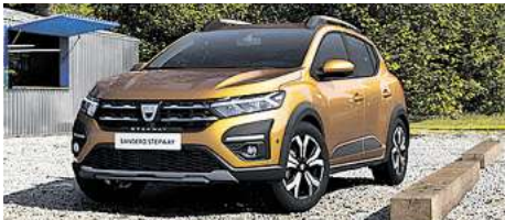
Der Dacia Sandero Stepway.