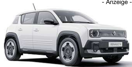
Der Renault 4.

Dacia Sandero Stepway: Gesamtverbrauch kombiniert (l/100 km): 5,7–7,2; CO 2 -Emission kombiniert (g/km): 116–131; CO 2 -Klasse: D. Dacia Bigster: Gesamtverbrauch kombiniert (l/100 km): 4,7–5,5; CO 2 -Emission kombiniert (g/km): 106–124; CO 2 -Klasse: C–D.