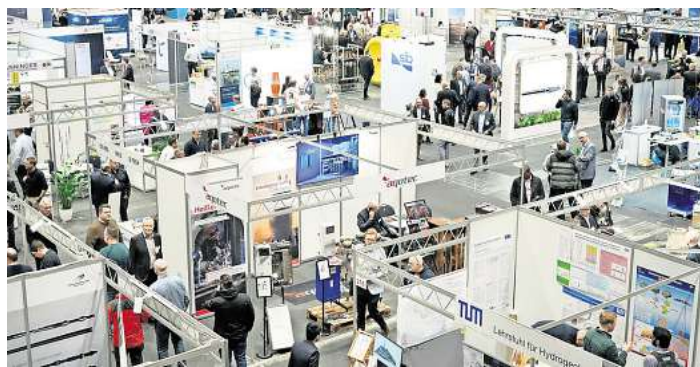
Auf der GeoTherm trafen sich Experten aus Industrie, Wissenschaft und Politik zum Branchenaustausch.

Vor diesem Hintergrund richtet sich der Blick bereits auf die nächste zentrale Branchenveranstaltung: die Celle Drilling – International Conference for Advanced Drilling Technology, die im