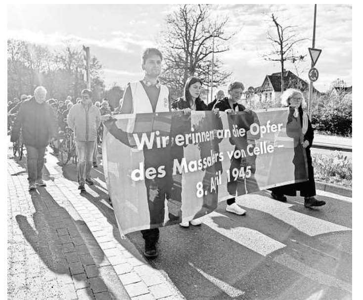
81. Jahrestag des Massakers von Celle.

aus der Luft angegriffen, die Bomben galten dem Bahnhof, auf deren Gleisen ein Güterzug mit zirka 3.800 KZ-Häftlingen und Zwangsarbeitern auf die Weiterfahrt wartete. Hunderte dieser Menschen kamen sofort ums Leben, die Überlebenden flohen Richtung Innenstadt oder Neustädter Holz. In den kommenden Tagen wurden sie durch SS, Volkssturm, Hitlerjugend, Wehrmacht, Polizei und Zivilisten gejagt und ermordet. Die Verfolger erschossen mindestens 170 Menschen. Für den Todesmarsch zu schwache Überlebende internierten sie in der Heidekaserne, wo die Verfolgten ohne Wasser und Brot bis zu ihrer Befreiung am 12. April 1945 ausharren mussten. Zirka 2.000 Menschen wurden von den Peinigern auf einen Todesmarsch nach Bergen-Belsen gezwungen.