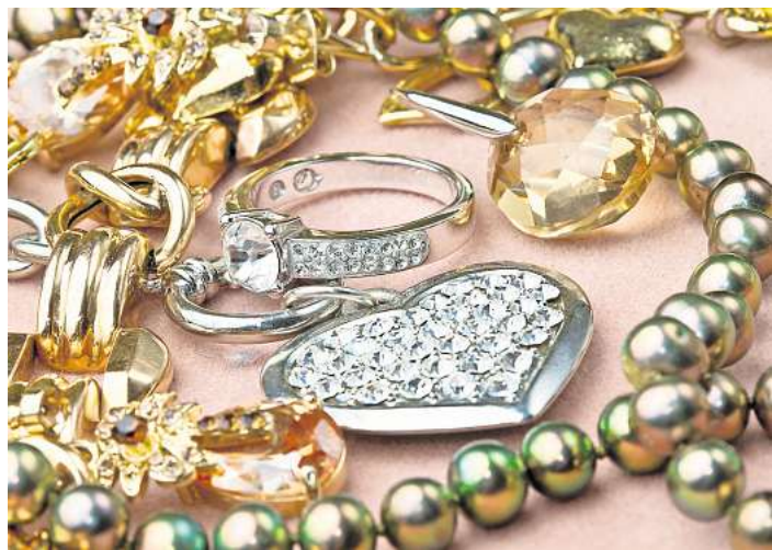
Auch Schmuck und Mäntel geraten ins Visier dubioser Händler.

ressierte Berufskollegen anzubieten. Infos auf der Web-Seite www.bdb-celle-uelzen.de . Gäste sind immer willkommen. Sehr beliebt sind die Fachvorträge mit aktuellen Themen. Hier bietet der BDB eine Plattform zur Vernetzung der Fachkollegen aus der Branche. Absoluter gesellschaftlicher Höhepunkt dürfte am 9. Januar 2027 wieder der 29. Neujahrsempfang im Celler Schlosstheater mit bis zu 300 Gästen aus fast allen BDB-Landesverbänden Deutschlands und Gästen aus Politik und Wirtschaft werden.