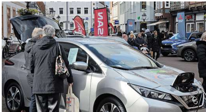
Von Assistenzsystemen bis zum digitalen Cockpit.

Die Celler Auto-Show zeigt damit deutlich – das Auto der Zukunft ist nicht nur ein Fortbewegungsmittel, sondern Teil eines umfassenden, nachhaltigen Mobilitätskonzepts. Die Veranstaltung bietet Besucherinnen und Besuchern die Möglichkeit, sich aus erster Hand über diese Entwicklungen zu informieren und die Trends von morgen schon heute zu erleben.