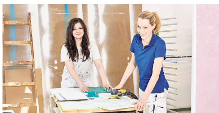
Eine Ausbildung im Handwerk.

Von den Betrieben, die Teilzeitmodelle umgesetzt haben, bewertet eine Mehrheit die Erfahrungen als „herausfordernd,