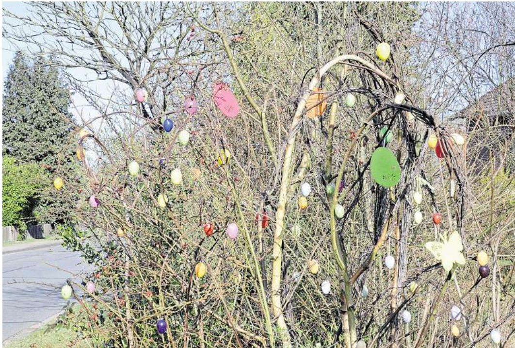
Osterdeko in den Gärten.

So gibt es zahlreiche Ostertraditionen und Bräuche, um schöne Feiertage zu erleben. Frohe Ostern.