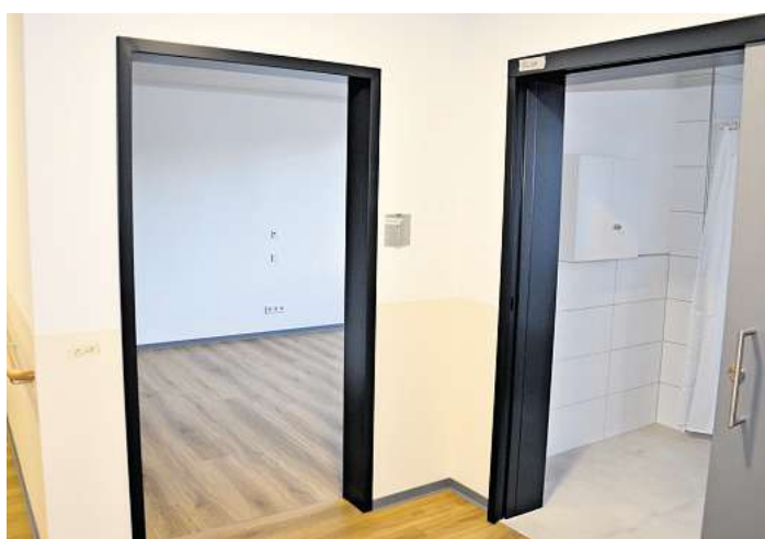
Jeweils zwei Zimmer teilen sich ein Bad.