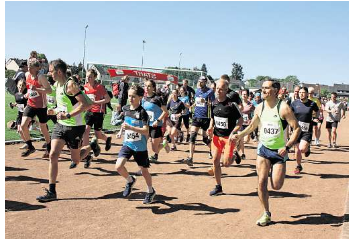
Start für den Lauf der Fünf-Kilometer-Strecke.

„Der Allertower ist eine Erbe meiner Vorgänger, das ich gleichwohl umsetzen wollte. Doch haben wir dem Projekt eine neue Prämisse vorangestellt: Wie können wir junge Menschen für unsere Stadt begeistern? Mittlerweile müsste auch der Letzte verstanden haben, dass die Ansiedlung einer Uni reine Utopie ist. Aber das Projekt, welches wir jetzt mit der Wohn-carée Allertower GmbH – Ein Unternehmen der Lindhorst-Gruppe umsetzen, nimmt gezielt junge Menschen in den Fokus. Hier entstehen 76 Ausbildungswohnungen, auch für Duale-Studenten, und damit auch 76 weitere geförderte Wohneinheiten in unserer Stadt. Um 10 Uhr werden die Schüler/-innen über 1,8 Kilometer und ab 10.15 Uhr über einen Kilometer unter dem Motto „Kinder fit machen“ auf die Strecke geschickt. Alle Schüler/Schülerinnen erhalten eine Urkunde mit ihrer gelauenen Zeit und einen Minipokal. Außerdem wird unter den Sammelmeldungen der Schulklassen ein Preis von 25 Euro für die Klassenkasse vergeben. Die neue Wanderstrecke über zirka acht Kilometer führt in die-