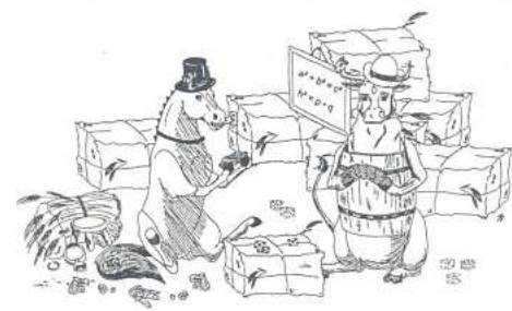
Cover von „Ewalds Mathe-spielwiese Teil 3“.

setzt auch in der Gegenwart ein Zeichen für Respekt, Anerkennung und demokratische Teilhabe. Dabei geht der Blick auch auf Bergen heute. Auch hier leben