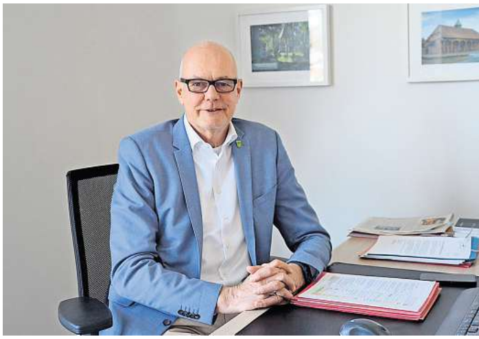
Bürgermeister Wolfgang Klußmann.

Bezüglich der Krisenvorsorge bereitet die Gemeinde sich auf mögliche Blackout-Szenarien vor und plant die Einrichtung von Notfall- und Informationspunkten mit Notstromversorgung. Ziel ist es, die Bevölkerung auch bei großflächigen Stromausfällen handlungsfähig zu halten. Auch das Thema Hochwasserschutz beschäftigt die Verwaltung. Gemeinsam mit anderen Kommunen im Westkreis sollen Strategien entwickelt und Fördermittel