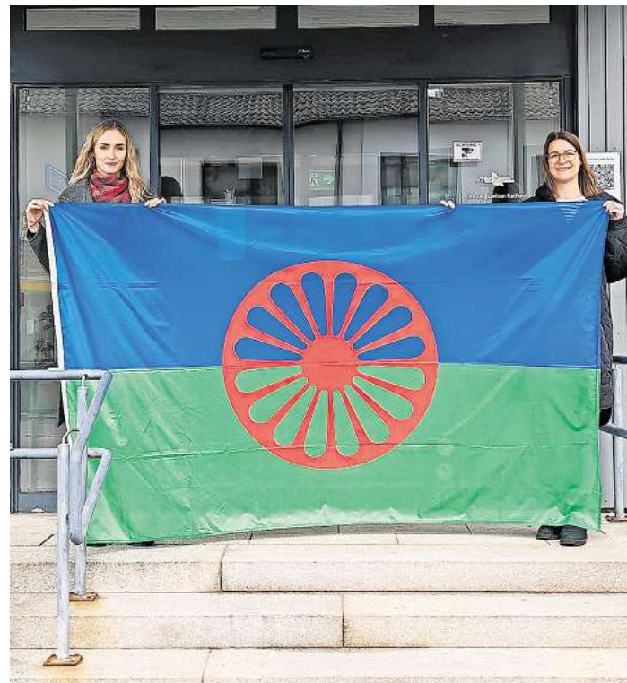
Mitarbeiterinnen der Stadt Bergen mit der Roma-Flagge vor dem Rathaus.