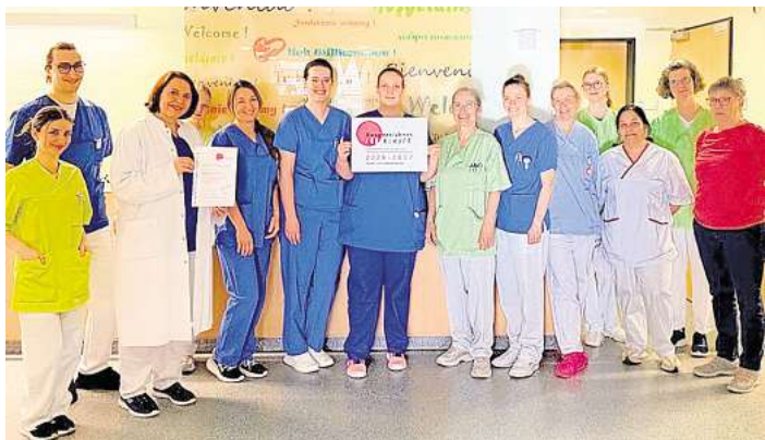
Team der Klinik für Kinder- und Jugendmedizin am AKH Celle freut sich über die Auszeichnung.

Nichtsdestotrotz gab es an diesem Theaterabend auch viel zu sehen: Zahlreiche Tanzchoreografien wechselten mit dramatischen Szenen und Monologen – die 16 Akteure und Akteurinnen lieferten ebenso anspruchsvolle wie glänzende Leistungen – und Bühnenbild, Kostüme und Maske sowie Lichttechnik waren von den jeweiligen Arbeitsgemeinschaften derart stimmig gestaltet worden, dass die zahlreich erschienenen Gäste geradezu in die Glitzerwelt des Showbusiness hineingezogen wurden. Die ihnen zugedachte Rolle erfüllten auch sie engagiert: Sie applaudierten frenetisch, wie es sich für das Publikum einer außerordentlich gelungenen Aufführung gehört.