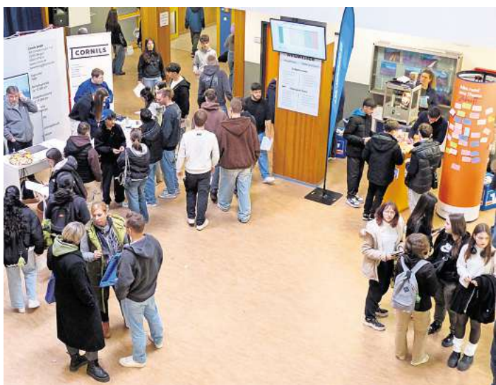
Regionale Unternehmen präsentieren sich auf der Berufsmesse.