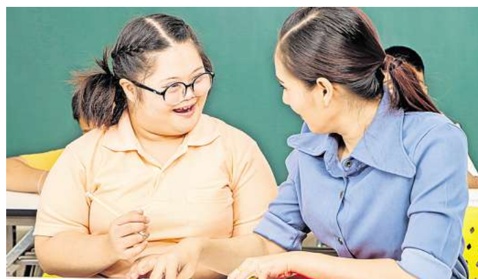
Es gibt wenige Berufe, bei denen die zwischenmenschliche Begegnung so sehr im Mittelpunkt steht wie in der Heilerziehungspflege.

Allerdings gilt auch in der Pflege: Je gründlicher die Ausbildung, desto besser die Berufschancen - und das Gehalt. (txn)