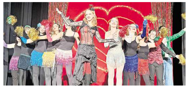
Zahlreiche Tanzchoreografien wechselten mit dramatischen Szenen im jüngst aufgeführten Theaterstück des Christian-Gymnasiums.