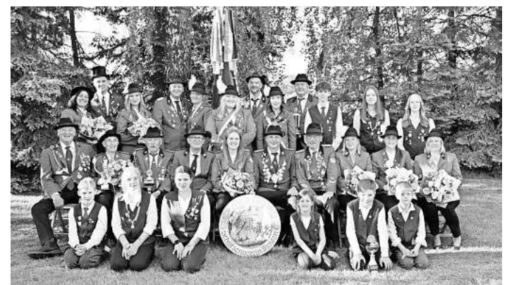
Am letzten Aprilwochenende findet in Diesten wieder das Schützenfest statt.

vier musste die Einzelteilerverteilung entscheiden. Hier setzte sich die Altenceller Schützengesellschaft von 1477 eingetragener Verein durch und belegte den dritten Platz. Den besten Einzelteiler des Abends erzielte der Schützenverein Hustedt von 1919 eingetragener Verein mit einem 171,4-Teiler. Dahinter folgten die Schützengemeinschaft Altenhagen mit einem 189,2-Teiler sowie der Schützenverein Groß Hehlen eingetragener Verein mit einem 201,6-Teiler. Neben dem sportlichen Wettkampf kam auch das gesellige Miteinander nicht zu kurz. In entspannter Atmosphäre nutzten die Teilnehmenden die Gelegenheit für Austausch und gute Gespräche.