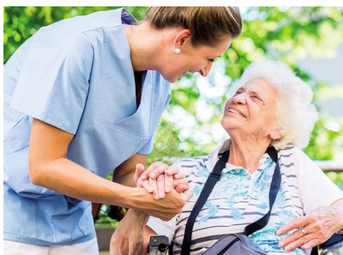
Die systemrelevante Berufsgruppe der Pflegerinnen und Pfleger wird in den kommenden Jahren noch stärker nachgefragt werden.