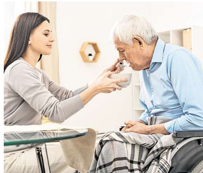
Pflegekräfte werden in vielen Bereichen dringend benötigt. Deshalb sind auch Quereinsteiger herzlich willkommen.

bildung ist nicht überall gleich. Einige finden, abgesehen von einigen mehrwöchigen Praktika, vor allem an den Berufsfachschulen statt. Daneben gibt es die praxisintegrierte Form der Ausbildung, die den Schulbesuch ähnlich wie bei dualen Ausbildungen nur an zwei Tagen in der Woche vorsieht. Die übrige Zeit arbeiten die Auszubildenden ganz praktisch in pflegerischen Einrichtungen. Einige wählen deshalb die praxisintegrierte Form, weil hier schon ab dem ersten Jahr eine Ausbildungsvergütung gezahlt wird. Allerdings ist es möglich, für die Ausbildung BAföG zu beantragen, und oft werden auch die Praktika bezahlt. Wer die Ausbildung in Vollzeit absolviert, kann nach zwei bis drei Jahren die Abschlussprüfung ablegen. Die beruflichen Chancen stehen damit sehr gut: Wie in allen Pflegeberufen werden auch in der Heilerziehungspflege händeringend Fachkräfte gesucht. (txn)