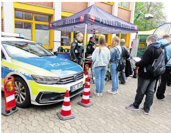
Zahlreiche Aktionen zum Anfassen und Mitmachen für die Schüler.