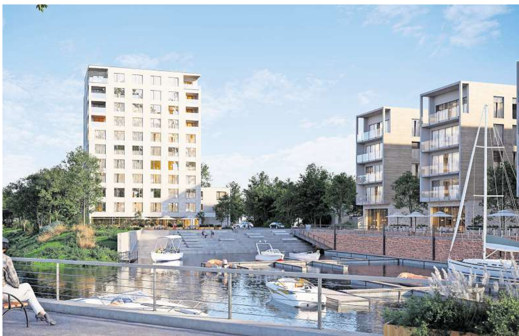
Moderner Elf-Geschosser auf der Allerinsel schafft bis 2028 Wohnraum.