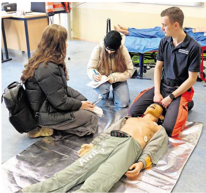
Das interaktive Element kommt bei den Schülerinnen und Schülern gut an.