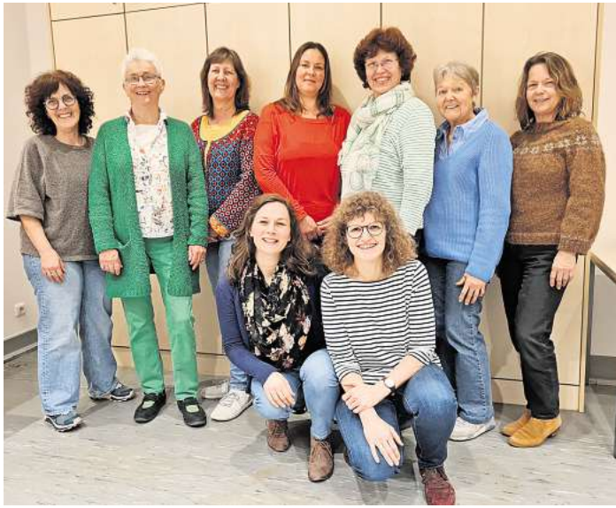
Der neugewählte Vorstand.