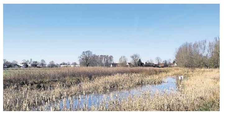
So soll es künftig aussehen: das bereits ertüchtigte Gewässer in direkter Nachbarschaft aus dem Jahr 2022.

Ein Storchengewässer entsteht CELLE. Die Untere Naturschutzbehörde der Stadt Celle plant gemeinsam mit der Ökologischen Station Südheide die Wiederherstellung eines Kleingewässers im Naturschutzgebiet „Obere Allerniederung bei Celle“. Dabei handelt es sich um eines von zwei Kleingewässern, die vor einigen Jahrzehnten zum Nahrungsgewinn für Störche angelegt wurden. Das westlich gelegene ist inzwischen weitgehend verlandet und stark von Gebüsch überwachsen. Zur Ertüchtigung sollen Schlammablagerungen und aufgewachsene Gehölze entfernt werden. Entstehen soll ein naturnahes Stillgewässer, das künftig als Reproduktionsstätte für Amphibien und Libellen dienen soll. Die Gehölz- sowie die Entschlammungsarbeiten beginnen voraussichtlich im Herbst 2026. Die Kartierarbeiten zum Projekt finden jedoch bereits vorher statt. Diese beginnen Mitte April und dauern bis Mitte Juni. Dabei werden in einem Umkreis von etwa 250 Metern südlich, westlich und östlich sowie etwa 800 Metern nördlich der Teiche die vorkommenden Brutvögel erfasst. Für diese Kartierungen ist es erforderlich, auch private Grundstücke zu betreten. Die Fachkräfte gehen dabei besonders rücksichtsvoll und schonend vor. Weitere Informationen zum Projekt gibt es bei der Stadt Celle, Fachdienst Umweltschutz, Untere Naturschutzbehörde, Am Französischen Garten 1 in 29221 Celle, unter Telefon 05141/126432 oder per Mail an umwelt@celle.de .