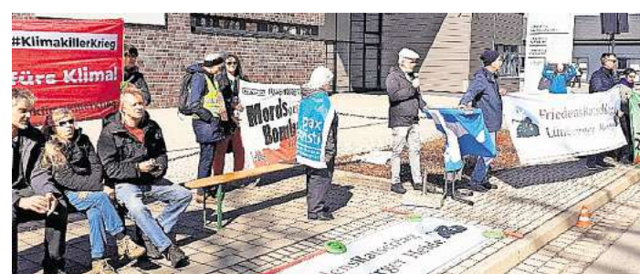
Vor dem Rheinmetall - Verwaltungsgebäude in Unterlüß.

Der Ostermarsch in Unterlüß zeigte einmal mehr - Friedensengagement lebt von der Vielfalt seiner Akteure, der Stimme der Jugend und dem Zusammenspiel von gesellschaftlichen Gruppen - ein deutliches Signal gegen Aufrüstung und für eine humane Zukunft.