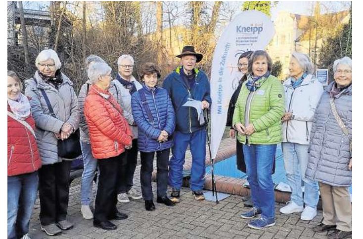
Empfang am Wassertretbecken des Kneipp-Vereines.

Interessierte können Clemens Weg auf Instagram verfolgen und auch gern über kontakt@bodo-spendenlauf.de mit Spenden unterstützen.