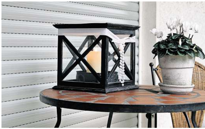
Fachmännisch geplanter Sonnenschutz reduziert im Winter die Heizenergieverluste über Fenster und Türen.