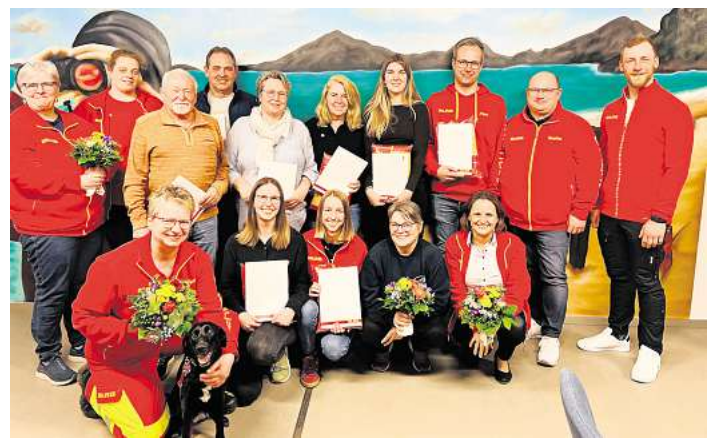
Die Jahreshauptversammlung der DLRG-Ortsgruppe Unterlüß.

Die Veranstaltung endete mit dem Appell, politische Entscheidungen stärker an langfristiger finanzieller Stabilität auszurichten. Dabei wurde auch die Bedeutung von Freiheit und Eigenverantwortung hervorgehoben – Werte, die aus Sicht der FDP eine zentrale Rolle für die zukünftige Entwicklung spielen.