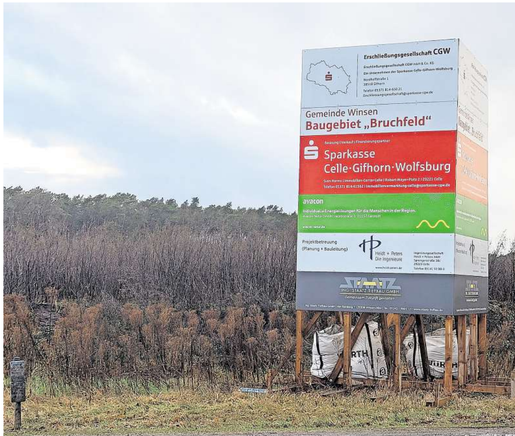
Das Baugebiet „Im Bruchfeld“ am Waller Kreisel befindet sich aktuell noch in der Erschließungsphase.

Ein Freibad werde es allerdings nicht mehr geben. Vorgeesehen sei, das Hallenbecken energetisch zu sanieren und die Möglichkeit zu schaffen, die Halle in den Sommermonaten teilweise öffnen zu können. Die beantragten Fördergelder seien jedoch notwendig, um die Planungen in dieser Form umsetzen zu können, so Oelmann abschließend.