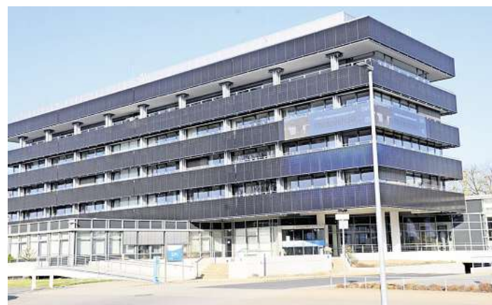
Die SVO in Celle.

und Fragen klären. Geplant ist, dass konkrete Ergebnisse der Machbarkeitsstudie bereits im Laufe des Jahres vorliegen sollen. „Wir haben das Fernwärmeprojekt bereits vor rund zweieinhalb Jahren gestartet und parallel zu den kommunalen Wärmeplanungen vorangetrieben. Wir verzahnen das jetzt, damit wir eine gute Chance haben, bei der späteren Realisierung auf knappe Fördermittel zugreifen zu können“, so Finke weiter. „Nur mit Fördermitteln des Bundes kann am Ende eine bezahlbare Lösung herauskommen. Celle steht in dieser Hinsicht im Wettbewerb mit anderen Fernwärmeprojekten in Deutschland, da zählt am Ende jeder Monat. Diese Rahmenbedingung wird sicher auch die kommende öffentliche, politische und unternehmerische Diskussion prägen.“ Als Basis für die jetzt gestarteten Untersuchungen dienen auch die zwischenzeitlich veröffentlichten Sachstandsberichte der kommunalen Wärmeplanung für Stadt und Landkreis Celle. Eine zentrale Erkenntnis dieser Berichte ist speziell im ländlichen Bereich, dass die Wärmepumpe für den Großteil der Gebäude als wirtschaftlichste und klimafreundlichste Heizungslösung anzusehen ist.