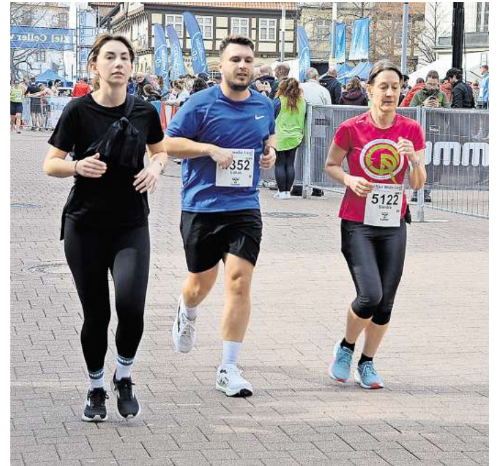
Über 8.000 Teilnehmerinnen und Teilnehmer waren am vergangenen Sonntag beim Wasa-Lauf dabei.

über 2,5 Kilometer, 5 Kilometer, 10 Kilometer, 15 Kilometer sowie der Hauptlauf über 20 Kilometer. Zusätzlich wurden auch Walking- und Nordic-Walking-Strecken sowie ein Staffellauf über 20 Kilometer angeboten. Besonders beliebt ist der Mini-Wasa-Lauf für Kinder und Jugendliche. Hier konnten junge Läufer erste Wettkampferfahrungen sammeln und unter dem Applaus der Zuschauer ihre Strecken bewältigen. Viele Eltern begleiteten ihre Kinder zum Start und warteten gespannt im Zielbereich, um sie dort zu empfangen. Für viele Familien gehört dieser Lauf inzwischen fest zum Jahresprogramm.