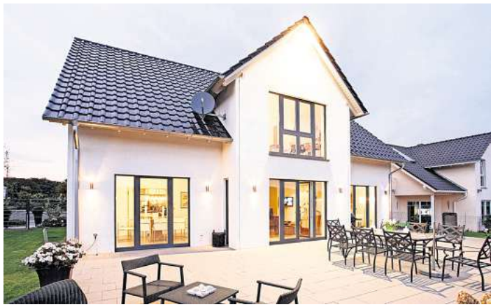
Frischer Look fürs Zuhause: Ein neuer Anstrich verschönert nicht nur das Eigenheim, sondern schützt mit den richtigen Materialien auch vor Algen, Schimmel und Co.