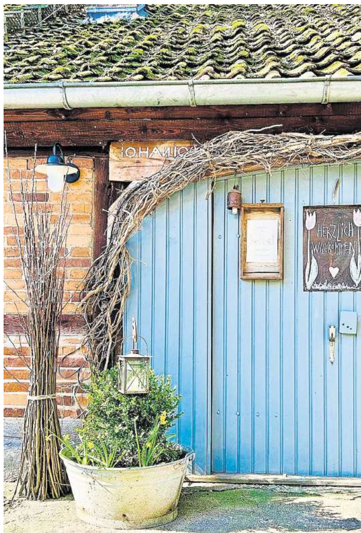
Auf Hof Wietfeldt findet wieder der Kunsthandwerkermarkt statt.

Der Eintritt kostet für Erwachsene fünf Euro, Kinder von 0 bis 14 Jahren frei. Weitere Infos unter www.hof-wietfeldt.de , auf Instagram unter https://www.instagram.com/hofwietfeldt oder unter Telefon 05141/85519.