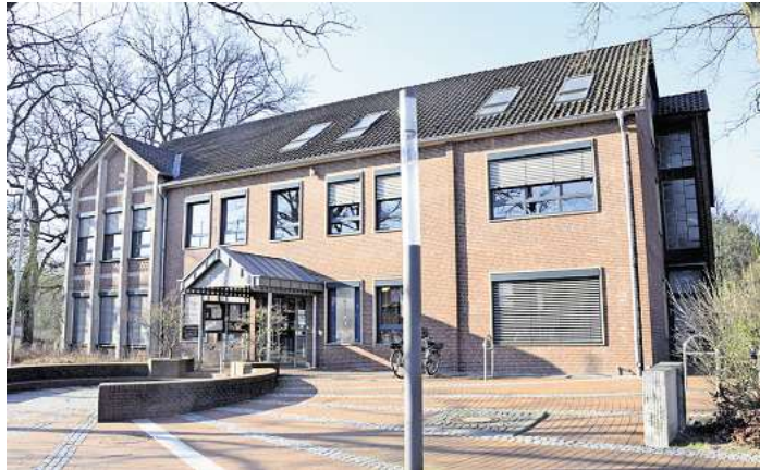
Die Unabhängigen Bürger (UB) sind weiterhin gegen einen Rathausneubau in Lachendorf.

Schon im Doppelhaushalt 2021/22 lag der prognostizierte Stand der Investitionskredite, hochgerechnet für das Jahr 2025 bei 21 Millionen Euro, im Haushalt 2025, hochgerechnet für das Jahr 2028, bei rund 27 Millionen