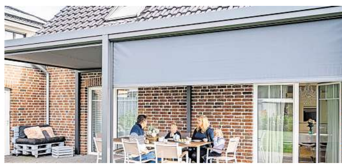
Bei einem rundum geschlossenen Terrassendach können Gartenmöbel, Kissen und Decken auf dem Balkon oder der Terrasse bleiben und zum Verweilen einladen.

Stand des Daches gewährleisten kann. Neben feststehenden Dächern etwa mit Kunststoffplatten sind seit einigen Jahren Lamellendächer immer stärker gefragt. Ihre Metalllamellen sind beweglich: Mit geöffneten Lamellen lässt sich die Sonne genießen - und wenn es doch zu heiß werden sollte, sorgt ein Knopfdruck für angenehmen Schatten. Im geschlossenen Zustand bleibt unter dem Dach auch bei Regengüssen alles trocken. Ist das Terrassendach durch bewegliche Seitenwände rundum geschlossen, können auch die Gartenmöbel, Kissen und Decken den Winter über auf dem Balkon oder der Terrasse bleiben und laden jederzeit zum Verweilen ein. (txn)