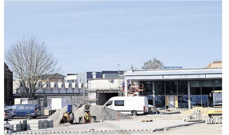
Die Arbeiten am neuen Edeka Schulze in Celle-Blumlage laufen auf Hochtouren.

finden. Inzwischen wurde zudem die Stahlkonstruktion des Vordaches errichtet – ein weiterer sichtbarer Meilenstein auf dem Weg zur Eröffnung.