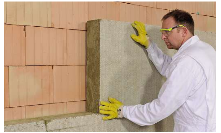
Dämmung wird angebracht.