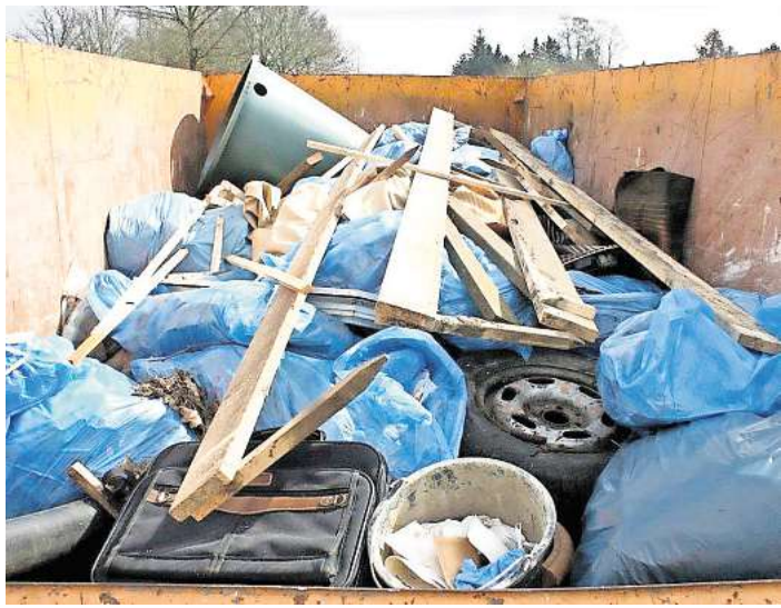
Traurige Beispiele für illegal entsorgten Abfall: Beim letzten Frühjahrsputz wurden in Garßen und Umgebung rund 1,8 Tonnen Wildmüll gesammelt.