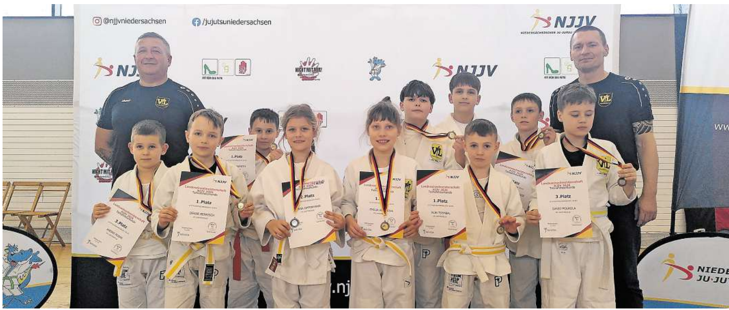
Ju-Jutsukas des VfL Westercelle in Einbeck.