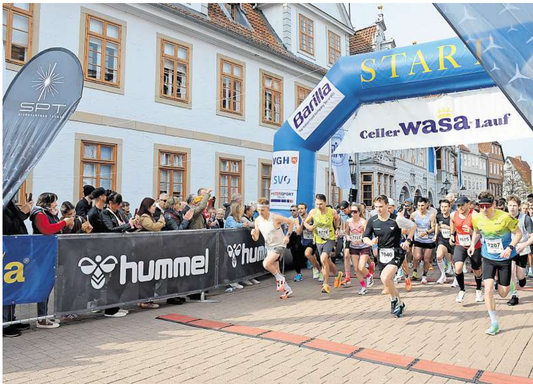
Start für die Läufe über 15 und 20 Kilometer.

sondere Atmosphäre, die den Wasa-Lauf auszeichnet. Entlang der Strecke standen zahlreiche Zuschauer und feuerten die Teilnehmer lautstark an. Besonders im Start- und Zielbereich herrschte eine ausgelassene Stimmung. Musik, Moderation und verschiedene Verpflegungsstände sorgten dafür, dass sich der Wasa-Lauf nicht nur als Sportveranstaltung, sondern auch als großes Stadtfest präsentierte. Jedes Jahr zieht die Veranstaltung Tausende Teilnehmer nach Celle und bringt Leben in die Straßen der Altstadt. Auch 2026 zeigte sich wieder deutlich, warum der Lauf so beliebt ist - die Mischung aus sportlichem Ehrgeiz, Gemeinschaftserlebnis und der besonderen Kulisse der Stadt. Viele Teilnehmer kündigten bereits nach dem Zieleinlauf an, auch im kommenden Jahr wieder an den Start gehen zu wollen. Damit dürfte der Wasa-Lauf auch in Zukunft ein fester Bestandteil des sportlichen und gesellschaftlichen Lebens in Celle bleiben.