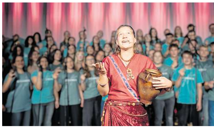
„Jesus und die Frau aus Samarien“ in Celle

Der Eintritt ist frei, Spenden zur Sicherstellung der Projekte, die von der Evangelischen Stiftung Klein Hehlen unterstützt werden, sind willkommen.