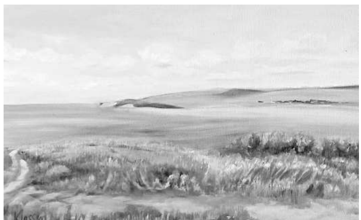
Ein Werk der Celler Künstlerin Claudia Klaasen.

Aquarell und Acryl. Die Ausstellung wird am Montag, 12. Januar, um 11 Uhr eröffnet. Besucher können die Gemälde von Klaasen auch im Anschluss auf der Ausstellungsfläche zwischen Altbau und Hochhaus montags bis donnerstags von 9 bis 15 Uhr und freitags von 9 bis 12 Uhr sehen.