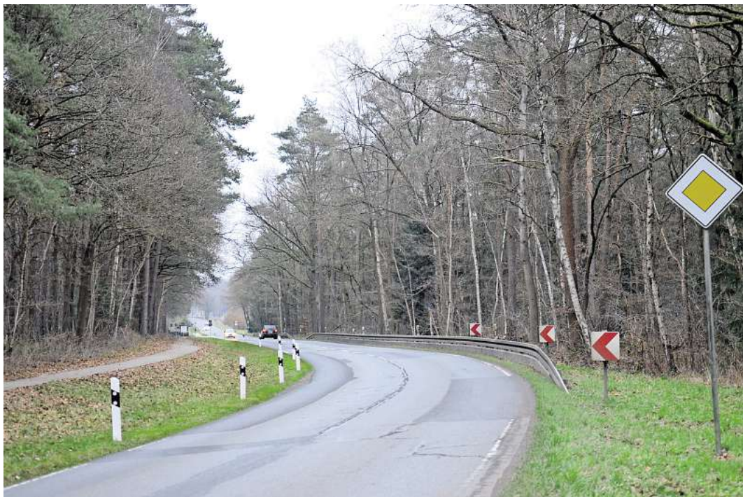
Auf einer Länge von 3,98 Kilometern wird die Fahrbahn zwischen Garßen und Alvern erneuert.

Tickets sind im Vorverkauf für zehn Euro im Ticketshop auf dem Gelände der CD-Kaserne Celle, außerdem an allen Vorverkaufsstellen von ADticket und unter Telefon 069/90283986 (0,20 Euro pro Anruf aus den deutschen Festnetzen oder maximal 0,60 Euro aus den deutschen Mobilfunknetzen) sowie online unter www.cd-kaserne.de erhältlich.