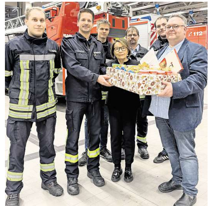
Der Ortsrat dankte der Feuerwehr.

den Direktwahlen keine Bewerberin oder kein Bewerber die absolute Mehrheit (mehr als 50 Prozent der Stimmen) erreichen,