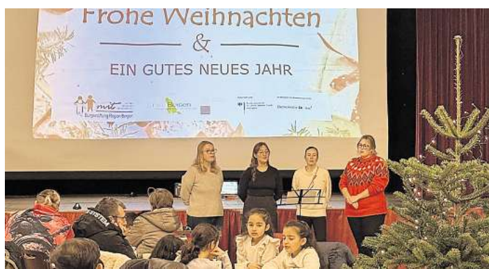
Weihnachtsfeier im Stadthaus Bergen.

Nicht nur die Kinder, sondern auch die Eltern hatten viel Spaß. Im nächsten Jahr soll die Veranstaltung wiederholt werden. Der Plan ist, dass dann die Kinder selbst gemachte Weihnachtsanhänger mitbringen und der Baum damit geschmückt werden soll.