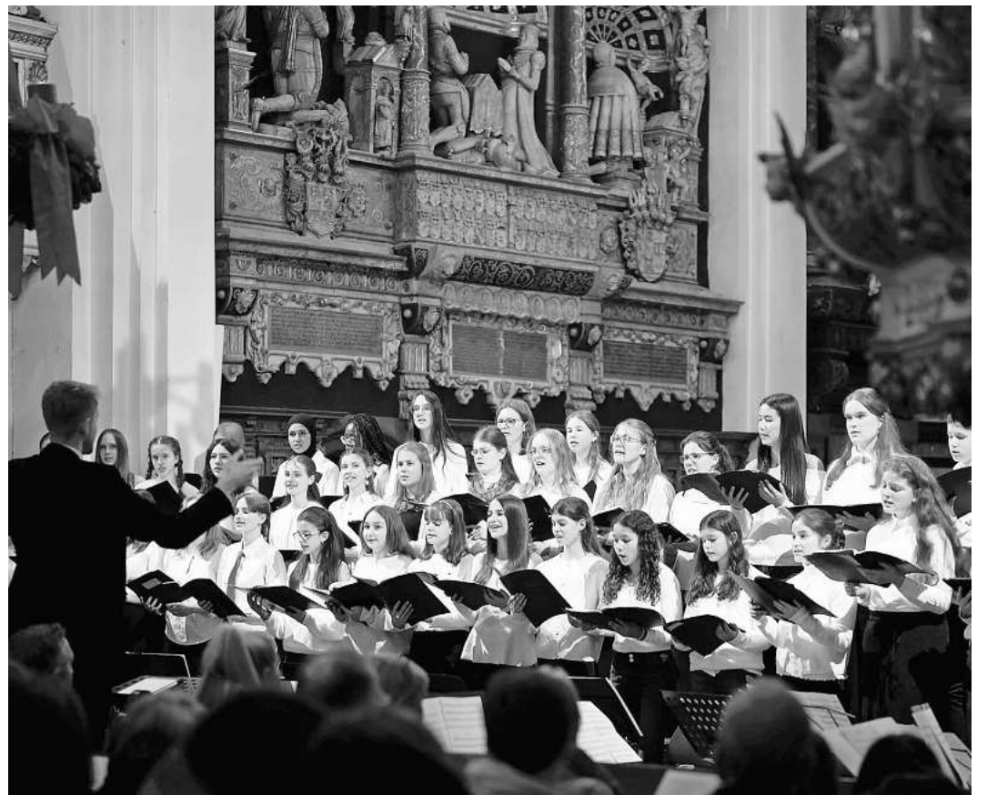
Schülerinnen und Schüler sangen in der Stadtkirche Celle.

Der krönende Abschluss einer gelungenen Dramaturgie des gesamten Abends war der gemeinsame Auftritt des Chores und des Orchesters mit „Consurge, filia Sion“ und „Tollite hostias“ aus dem Weihnachtsoratorium von Camille Saint-Saens. Durch das passgenaue Arrangement von Christoph Stelljes für die aktuelle Besetzung des Schulorchesters ließ das eigentlich für großes Sinfonieorchester mit Orgel und Harfe besetzte Stück klanglich nichts vermissen. Das „Consurge, filia Sion“ begann mit einem anrührenden Duett von Oboe und Klarinette (statt Orgel im Original) und setzte sich dann zu einem zarten Klanggewebe mit