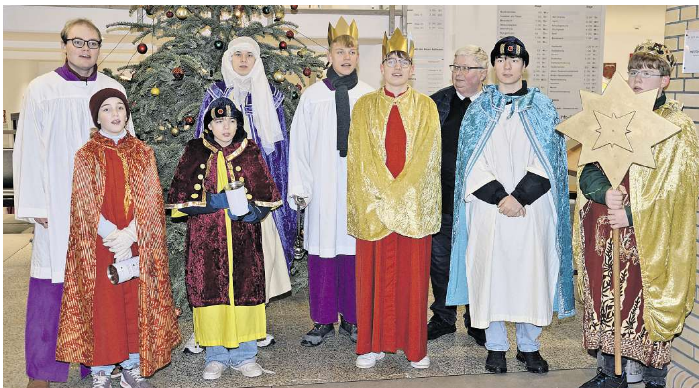
Die Sternsinger kamen unter anderem ins Neue Rathaus von Celle.

Die Aktion Dreikönigssingen fördert weltweit Projekte, die Kindern helfen, der Kinderarbeit zu entkommen und eine Schule zu besuchen. Weitere Informationen zur Aktion Dreikönigssingen 2026 sind auf der Website www.sternsinger.de verfügbar.