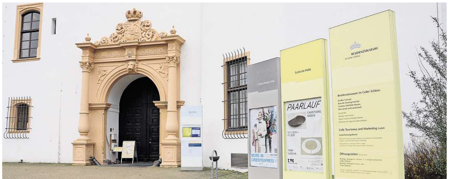
Als Theater in kommunaler Trägerschaft ist das Schlosstheater Celle unmittelbar von der angespannten Haushaltslage der Kommunen betroffen.