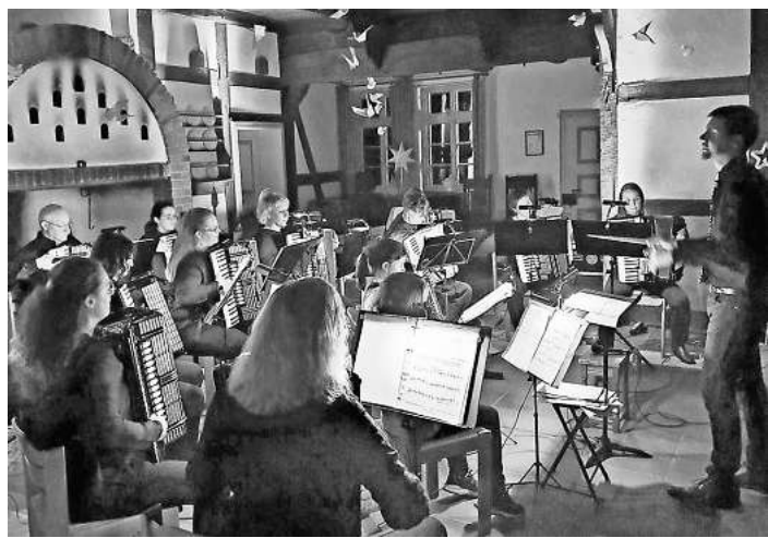
Weihnachtskonzert im Grooden Hus.