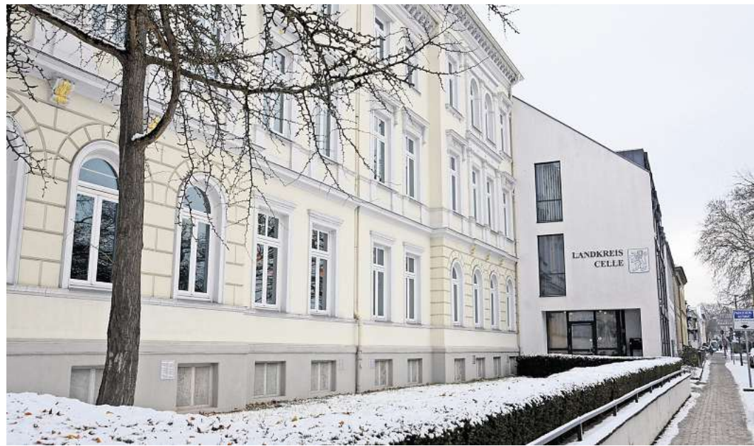
Am Sonntag, 13. September, finden im Landkreis Celle die Kommunalwahlen statt.

Der Landkreis Celle bedankt sich im Voraus für das Engagement und die Teilnahme aller Bürgerinnen und Bürger – sowohl als Wählerinnen und Wähler als auch als Wahlhelferinnen und Wahlhelfer.