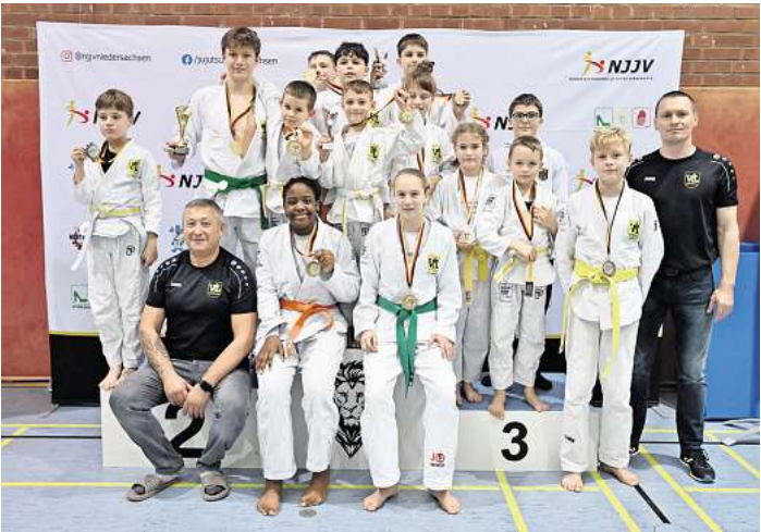
Erfolgreiche Teilnehmer des VfL Westercelle.

Am Aktionstag selbst schalteten die Apotheken in einem freiwählbaren Zeitraum die Lichter aus – nur eine Notbeleuchtung blieb an. Sie nutzten diesen Anlass, um mit ihren Patientinnen und Patienten ins Gespräch zu kommen. Darüber hinaus konnte die Teilnahme per Foto oder Video dokumentiert werden und die Aufnahmen über Social Media verbreitet werden. Bei Fragen wurden die Kundinnen und Kunden auf die Internetseite www.gesundheitsichern.de verwiesen – dort hat die ABDA mehr Informationen zur Situation der Apotheken zur Verfügung gestellt.