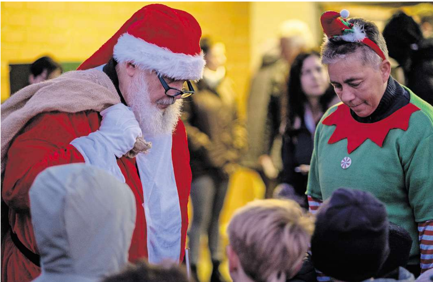
Auch der Weihnachtsmann kam vorbei.

Die Abfuhr in der Neujahrswoche verschieben sich jeweils um zwei Tage. Die Abfuhr vom Mittwoch, 31. Dezember, findet am Freitag, 2. Januar, statt.