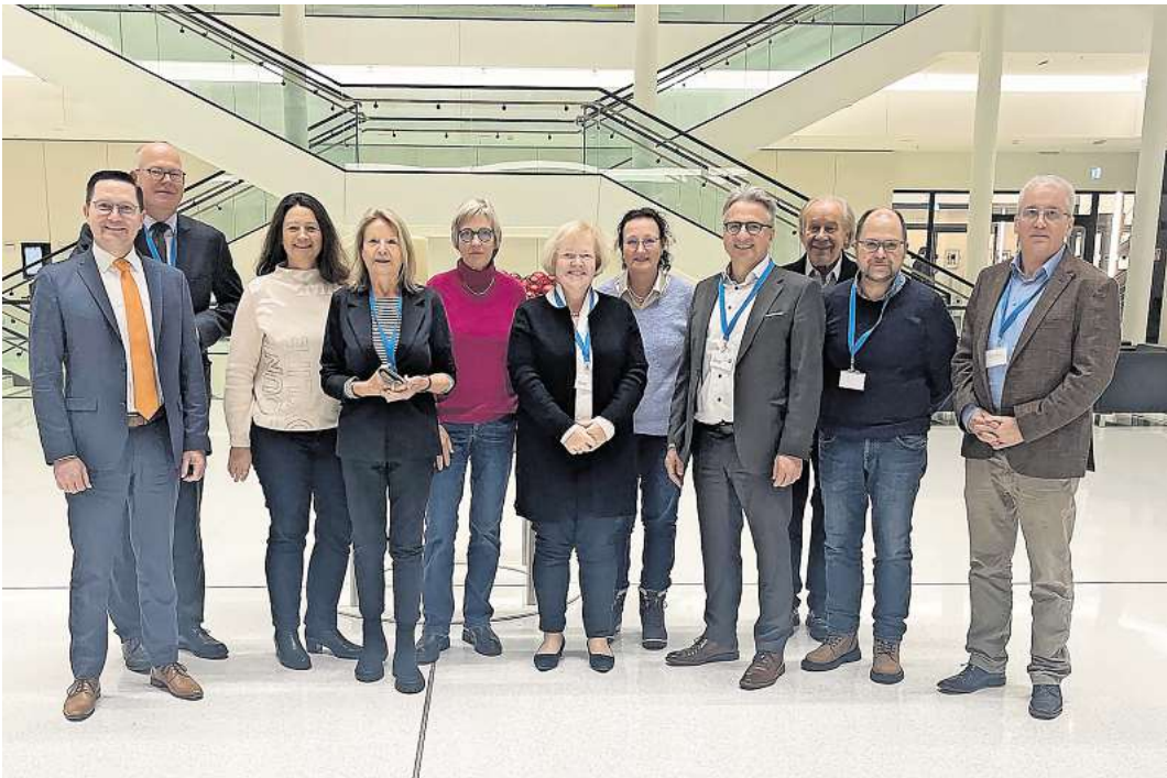
Besuch des Celler Theatervereins im Landtag.

Landes in die Mitfinanzierung von Tarifsteigerungen, die verlässliche Berücksichtigung ge-