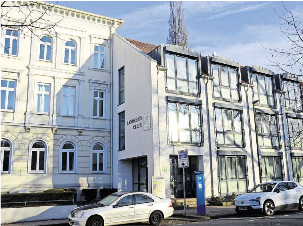
Der Kreistag hat den Haushalt für 2026 beschlossen.

zierung sicherzustellen, treibt das die Kommunen zwangsläufig in Defizite. Für Investitionen in die Krankenhäuser ist das Land zuständig, der Bund hat die laufenden Betriebskosten zu zahlen; es kann nicht angehen, dass Land und Bund die Krankenhäuser so