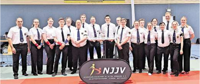
Die teilnehmenden Kampfrichter.