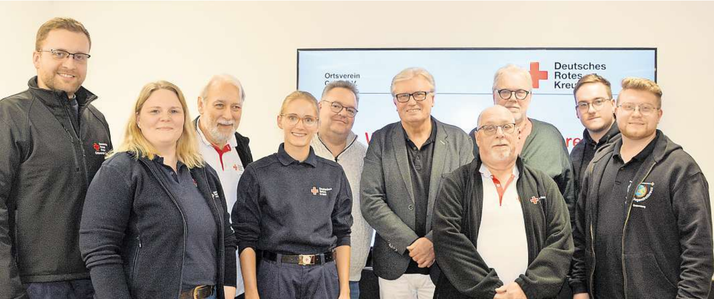
Der für vier Jahre neu gewählte Vorstand des DRK-Ortsvereins Celle.