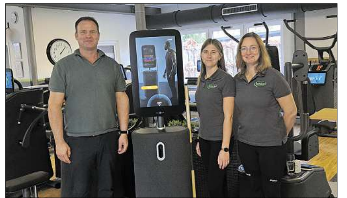
Im neuen VitalPro 360 mit den neuen EGYM Geräten.

Wer sich einfach unverbindlich ein eigenes Bild machen möchte und ein ganzheitliches Ökosystem erleben möchte, ist herzlich eingeladen, einen individuellen Infotermin zu vereinbaren.