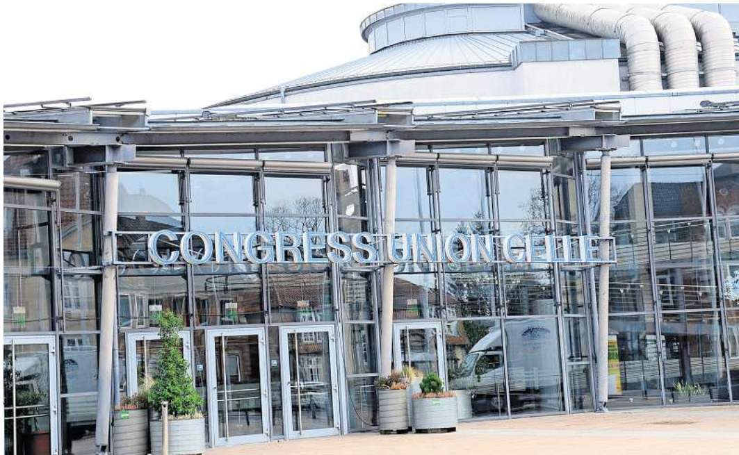
Die Congress Union ist Veranstaltungsort für den Bürgerempfang.

rund zwei Stunden die Anwesenden zum Ausklang ins Foyer bitet, wird noch ein glänzender Schlusspunkt gesetzt. Eine Abordnung der Lichterparade bringt die Bühne zu Funkeln und hat sich dazu etwas Neues ausgedacht. Unter dem Titel Zirkus wird der Große Saal zur Manege. Die Tänzerinnen und Tänzer stehen in ihren leuchtenden Kostümen im Anschluss auch für Aufnahmen an der Fotowand parat.