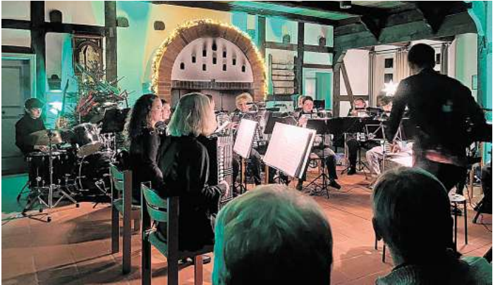
Der Akkordeonverein Winsen (Aller) veranstalte im "Grooden" Hus in Winsen (Aller) sein jährliches Weihnachtskonzert.

Karl Jenkins' ergreifendem Werk „The Armed Man“, darunter das das berührende „Benedictus“. Mit Liedern wie „Merry Xmas (War is Over)“, „Peace on Earth“ oder einer gefühlvollen Version von „Stille Nacht“ wird der Friedensgedanke auf vielfältige Weise musikalische aufgegriffen. Daneben schaffen vorweihnachtliche Klassiker eine warmherzige Adventsstimmung. Auch der musikalische Nachwuchs „Die Smarties“ setzen bei dem Konzert weitere weihnachtliche Akzente. Mit seinem stimmungsvollen Programm lädt das Konzert dazu ein, inmitten der Vorweihnachtszeit im Zeichen des Friedens einen Moment des Innehaltens zu finden. Der Eintritt ist frei.