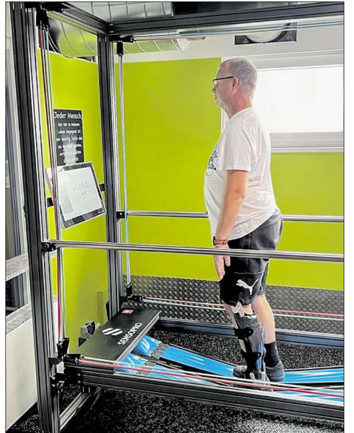
Eine Therapie mit dem Sensopro.