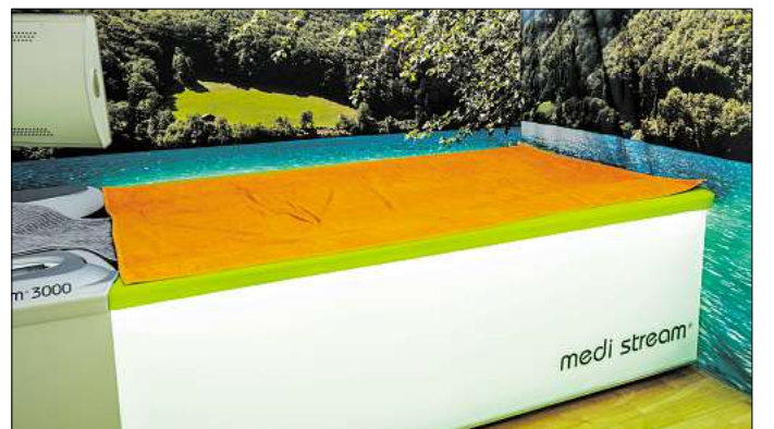
Entspannung auf der Traumwasser-Oase.