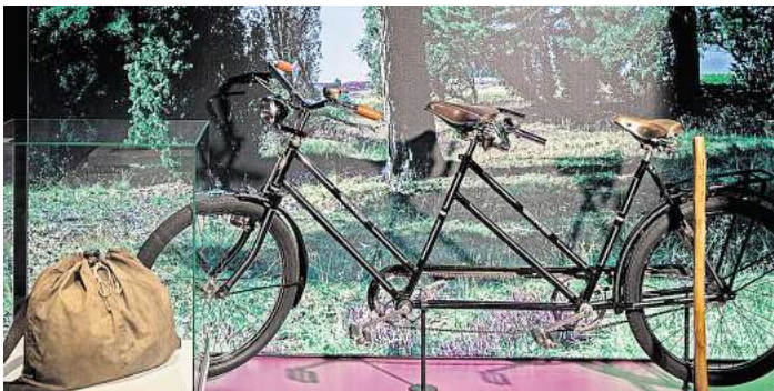
Ein Schmidt Tandem.