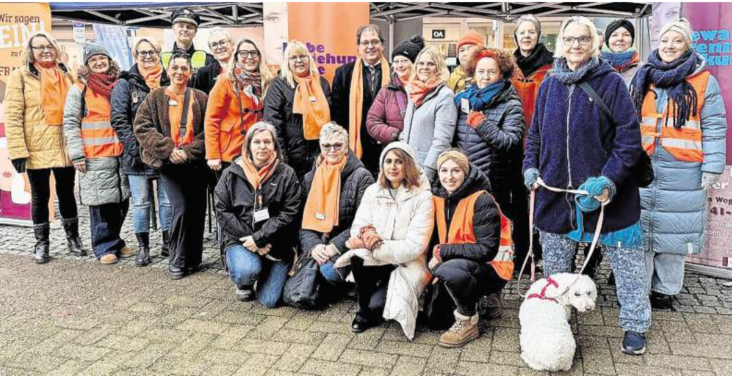
Die Akteurinnen und Akteure des Runden Tisches gegen häusliche Gewalt beim Infostand.

Der Orange Day und die begleitenden Aktivitäten sollen dazu beitragen, das Bewusstsein für das Thema zu stärken und ein gesellschaftliches Umfeld zu fördern, in dem Respekt, Sicherheit und Gleichberechtigung selbstverständlich sind.