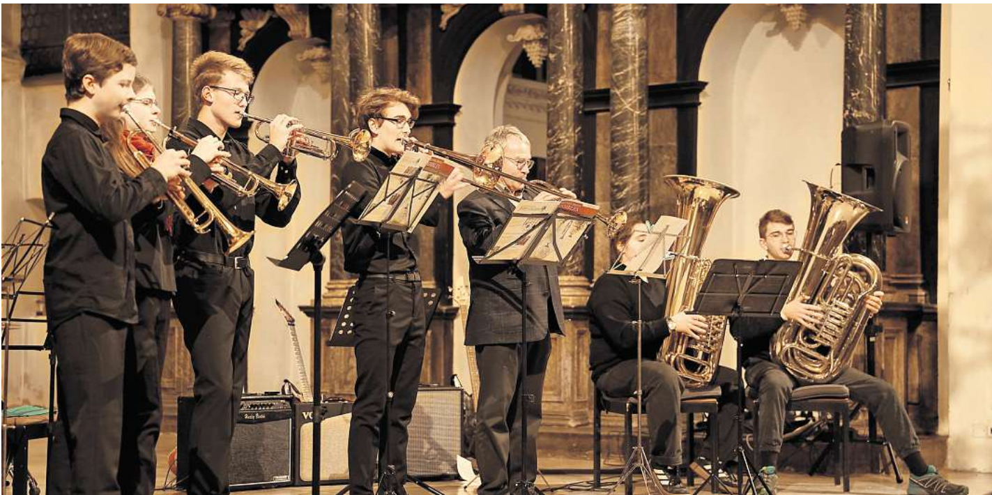
In der Stadtkirche Celle findet ein festliches Weihnachtskonzert des Ernestinums statt.

Die Stadt Celle ist bestrebt, die unvermeidbaren Beeinträchtigungen während der Baumaßnahme in enger Abstimmung mit der ausführenden Firma so gering wie möglich zu halten. Dennoch lässt es sich nicht abschließen, dass Grundstücke im Verlauf der Arbeiten zeitweise nicht mit Fahrzeugen erreichbar sind.