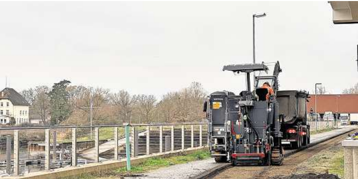
Im Mai soll beim Ausbau der Straßen in der Hafen City alles fertig sein.

Der Eintritt ist frei, um Spenden wird gebeten. In diesem Jahr sollen wieder die Obdachloseneinrichtung Kalandhof und die Sing-schule der Stadtkirche unterstützt werden.