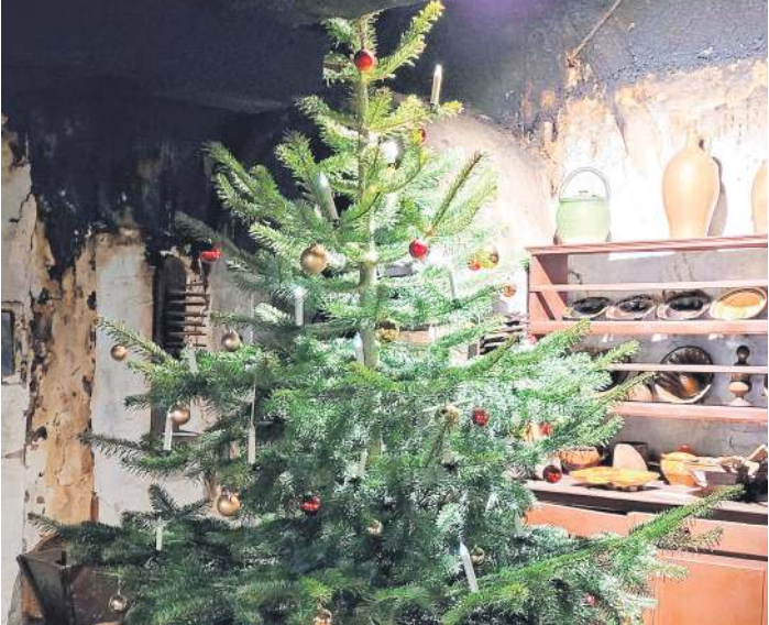
Der „Winterzauber der Vereine“ findet erneut rund um den Friedensplatz und im Museum Römstedthaus statt.

Für die Umsetzung der Projekte zeichnet, wie eingangs erwähnt, die Goldbeck Nord GmbH gemeinsam mit Mosaik Architekten aus Hannover verantwortlich. Die Fertigstellung ist für die Sommerferien 2027 avisiert, so dass Schülerschaft und Lehrkräfte dann in neue, moderne Räumlichkeiten einziehen können.