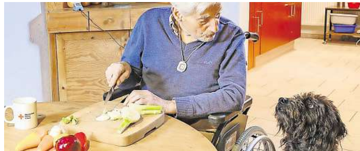
Mit dem Hausnotrufsystem kann im Notfall schnell Hilfe angefordert werden.

Durch die Freisprecheinrichtung und das sensible Mikrofon wird auch die leise Stimme aus einiger Entfernung noch übertragen. Der Notrufsender ist so klein, dass er bequem als Hausnotruf-Armband am Handgelenk oder wie eine Kette um den Hals zu tragen ist.