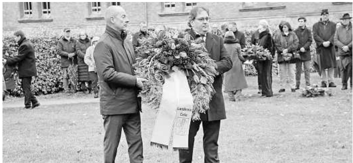
Landrat Axel Flader bei der Kranzniederlegung.

beeindruckende Einzelschicksale hin, die sich für die Menschenrechte eingesetzt haben oder denen die Menschenrechte verwehrt wurden. Traditionell verliehen Celler weiterführende Schulen der zentralen Gedenkfeier am Volkstrauertag ein eigenes Gesicht. Zum dritten Mal übernahm das Hermann-Billing-Gymnasium die Gestaltung (zuvor 2015 und 2019), die Oberschule Burgstraße (2013), die Berufsbildenden Schulen II Celle (2014), die Integrierte Gesamtschule Celle (2021), das Gymnasium Ernestinum (2016 und 2022), das Hölty-Gymnasium Celle (Start in 2011, auch in 2017 und 2023) und das Kaiserin-Auguste-Viktoria-Gymnasium (2012, 2018 und 2024). Der Volkstrauertag 2025 in Celle zeigte einmal mehr, wie wichtig gemeinsames Erinnern ist. Die Veranstaltung verband historische Verantwortung mit dem Blick auf aktuelle Herausforderungen und machte deutlich: Der Einsatz für Frieden beginnt im eigenen Umfeld. Celle setzte an diesem Tag ein klares Zeichen – ein Zeichen des Gedenkens, der Mahnung und der Hoffnung.