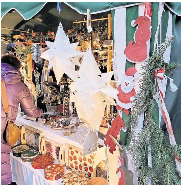
Lokale Vereine und Verbände laden Besucher zum Stöbern an ihren Ständen ein.

In diesem Jahr werden die Außenflächen und die Räumlichkeiten des Familien- und Begegnungszentrums in die Veranstaltung mit eingebunden, sodass die Besucher noch mehr Platz zum Verweilen haben. Zahlreiche lokale Vereine und Verbände präsentieren sich mit Ständen und Angeboten, die zum Stöbern einladen. Ein besonderes Highlight in diesem Jahr ist die Beteiligung eines Partyservice aus der Region, das für ein