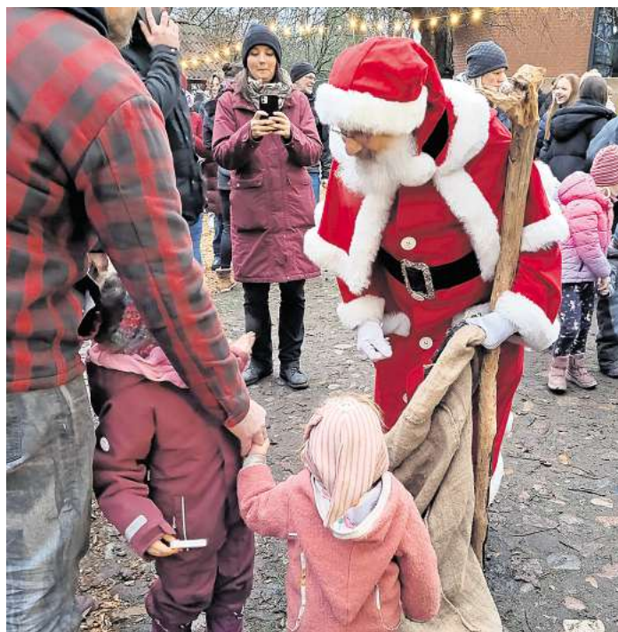
Der Weihnachtsmann hat sich auch für dieses Jahr wieder angekündigt.

und vielfältiger zu gestalten“, so das Orga-Team. Die Hermannsburger und ihre Gäste können sich auf einen gemütlichen, stimmungsvollen Nachmittag freuen. So wird Hermannsburg in der Adventszeit zu einem Ort der Begeg-