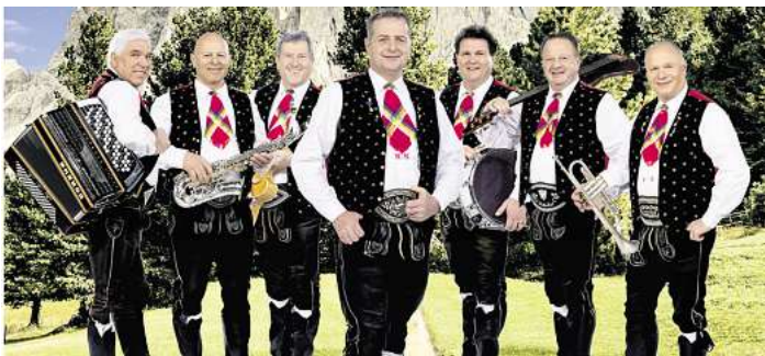
Die Kastelruther Spatzen.

liebte Traditional God Rest Ye Merry, Gentlemen, während das von Martin Pfister geleitete Klari-nettenensemble „KlariFari“ ein Choralvorspiel von J. S. Bach zu Gehör bringt. Auch das Percus-sionensemble „Stick Con-nection“ wird gemeinsam mit Jörg Rossmann durch ihr Scrapheap Samba für Stimmung sorgen. Zudem bereichern auch solisti-sche Beiträge das Programm, die das Publikum u.a. mit den mo-dernen Weihnachtsklassikern Santa Tell Me und Santa Baby ver-zaubern. Und selbstverständlich darf Wolfgang Amadeus Mozart nicht fehlen – in einer Bearbei-tung für Querflötenquartett er-klängt das Andante aus dem Di-vertimento KV 136. Der Einlass beginnt um 15:30 Uhr, der Eintritt ist frei. Die Kreis-musikschule Celle lädt alle Mu-sikfreunde herzlich ein, sich mit einem stimmungsvollen Nach-mittag voller Musik auf die Ad-ventszeit einzustimmen.