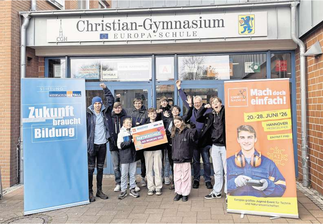
Die Projektgruppe des Christian-Gymnasiums.

cken sei nicht nur ein Ort für den Schwimmunterricht, sondern auch ein wichtiger Treffpunkt für