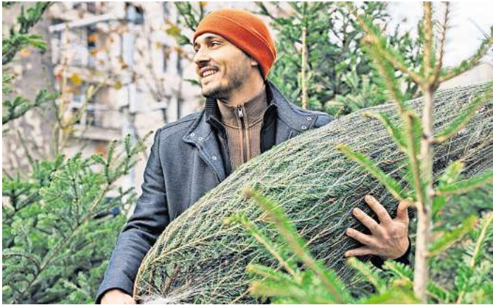
Ohne Plastikgeruch, dafür mit echtem Tannenduft: Zu Weihnachten mögen es die Menschen traditionell.