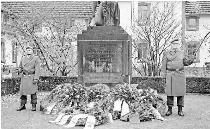
Am Ehrenmal.