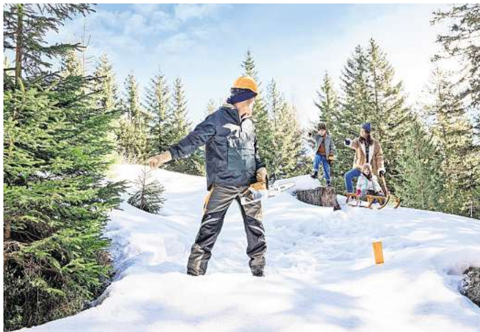
Das gemeinsame Weihnachtsbaumfällen ist für viele Familien eine beliebte Tradition.

Favorit bei den Weihnachtsbäumen ist hierzulande die Nordmantanne mit ihren weichen Nadeln, aber auch eine klassische Fichte mit ihrem intensiven Duft ist beliebt. Um den schönsten Baum auszuwählen, gilt es ein paar Dinge zu beachten: In jedem Fall sollte man etwas Luft von der Spitze bis zur Raumdecke einplanen. Auch der Umfang spielt eine Rolle, wenn der Baum zum Beispiel in den Erker passen soll. Wichtig fürs Schmücken ist außerdem ein gleichmäßiger Wuchs. Oft sind die Bäume im Forst bereits gefällt; wer möchte, kann aber vielerorts auch selbst Hand anlegen. Schnell und einfach geht das mit einer akkubetriebenen Motorsäge. Neben der Motorsäge ist eine Astsäge empfehlenswert, mit der störende Äste entfernt werden können. Zudem ist die persönliche Schutz-