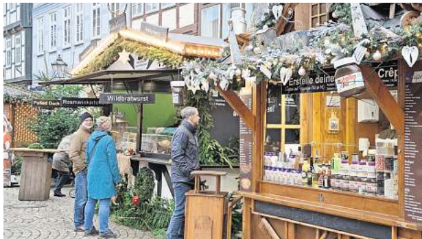
Köstlichkeiten für jedermann.

Die Stadt Celle wünscht allen Besucherinnen und Besuchern eine besinnliche Adventszeit, frohe Weihnachten und einen guten Start in das neue Jahr.