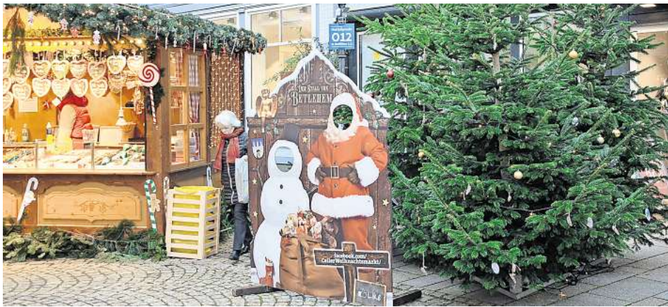
Celler Weihnachtsmarkt 2024.