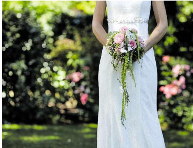
Zur Hochzeit gehört ein wunderschönes Brautkleid ...

Ein Tag voller Inspiration, Begegnungen und Herzensmomente – ein Besuch lohnt sich!