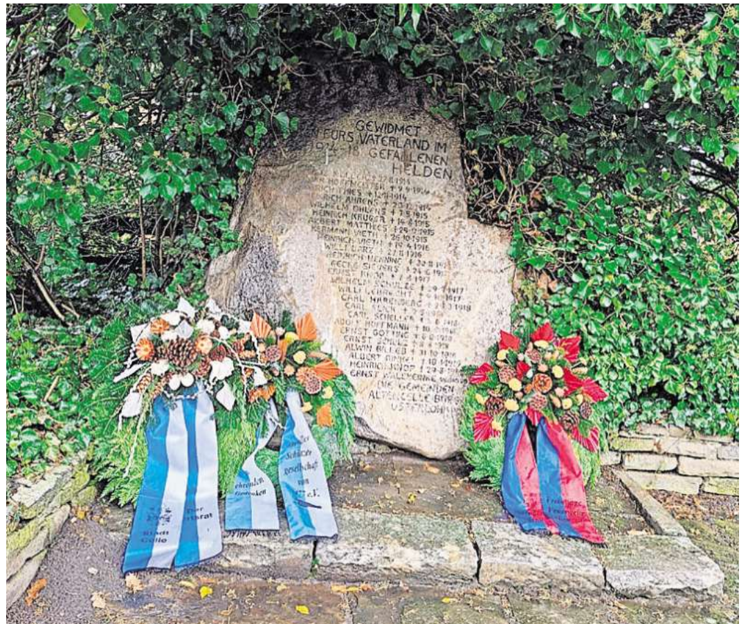
Gedenkstein in Altencelle.

Der Altenceller Sportverein organisierte erneut den beliebten