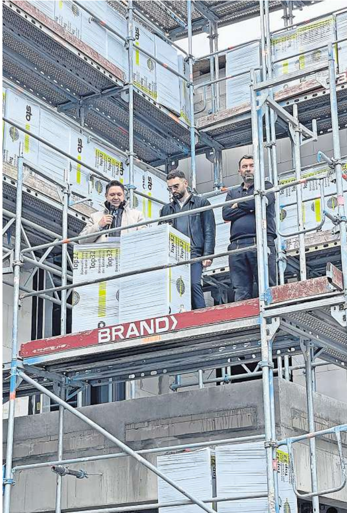
Während des Richtfestes.

Das zweite Halbjahr 2025 zeigt erneut, welchen hohen Stellenwert das Miteinander in Altencelle hat. Viele Projekte und Veranstaltungen verdeutlichen, dass die Bürgerinnen und Bürger des Ortsteils gemeinsam an einem Strang ziehen und das Zusammenleben aktiv gestalten.