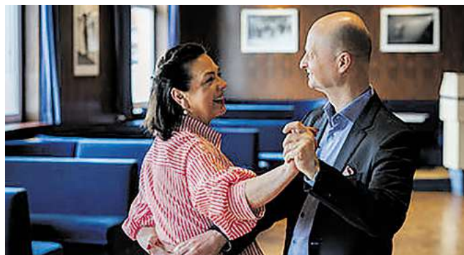
... und natürlich das Tanzen.