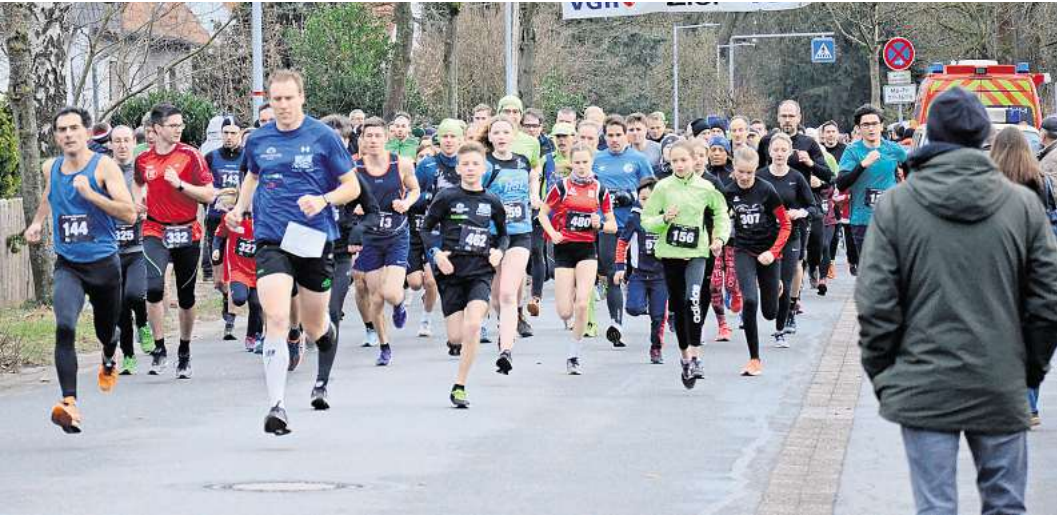
Immer viele Teilnehmer beim Silvesterlauf in Winsen.

43. Silvesterlauf des MTV „Fichte“ Winsen (Aller)