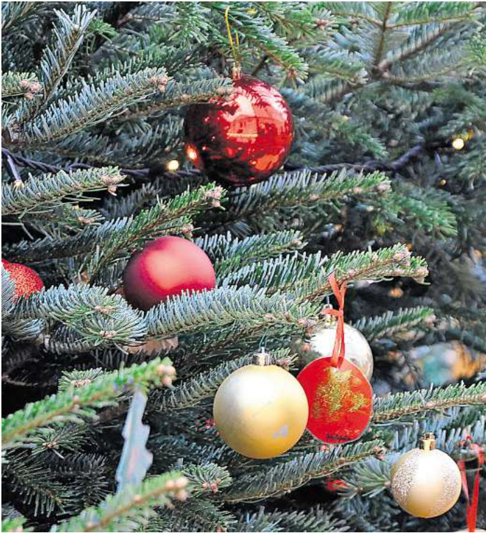
Kleinere Märkte und Basare für ganz persönliche Geschenke.

Ein weiteres Highlight ist der Lobetaler Adventsmarkt am 28. November, der von 12.30 Uhr bis