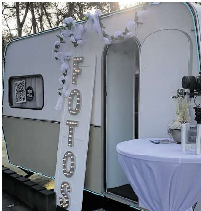
... Fotos vom Brautpaar und den Hochzeitsgästen ...