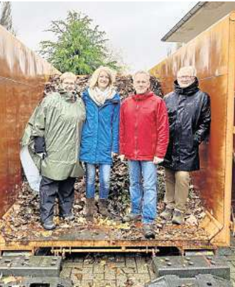
Hehlentor war mit vollem Einsatz dabei.

Die Ortsratsmitglieder zeigten sich zufrieden. Die Laubannahme entlastet nicht nur die Anwohner, sondern fördert auch das gemeinschaftliche Miteinander im Stadtteil.