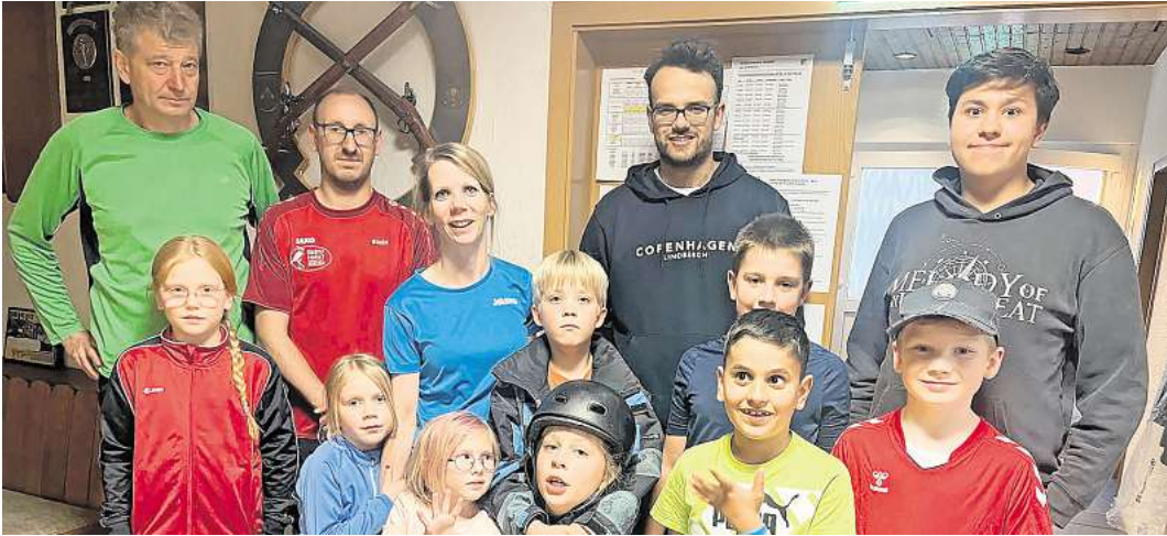
Kinderfeuerwehr und Schützenverein beim gemeinsamen Aktionstag.

CELLE. Unbekannte Täter haben laut Polizei in der Nacht von Dienstag, 11. November auf Mittwoch, 12. November, versucht, in die Turnhalle der Grundschule Hehlentor in Celler einzubrechen. Nach bisherigem Stand der Ermittlungen versuchten die Täter im Zeitraum zunächst erfolglos, in den Turnhallentrakt in der Harburger Straße zu gelangen. Dann verschafften sie sich auf bislang unbekannte Weise Zutritt zum Vorraum der Turnhalle. Ob dort etwas entwendet worden ist, steht noch nicht fest. Der entstandene Schaden beläuft sich auf zirka 500 Euro. Zeugen werden gebeten, sich mit der Polizei in Celler unter dem Telefon 05141/2770 in Verbindung zu setzen.