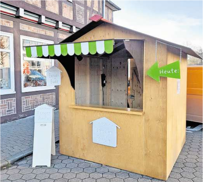
Die „Berger Bude“ steht auch in diesem Jahr wieder in der Celler Straße bereit.

Die „Berger Bude“ ist jeweils von montags bis freitags in der Zeit von 16 bis 18 Uhr und samstags von 10 bis 12 Uhr geöffnet. Anmeldungen werden im Rathaus der Stadt Bergen von Silvia Bothe unter Telefon 05051/479-112 oder per Mail an silvia.bothe@bergen-online.de entgegen genommen.