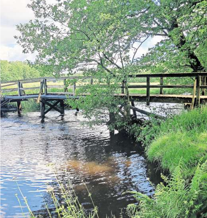
Die Fertigstellung der neuen Fußgängerbrücke über die Örtze wird im Januar erwartet.