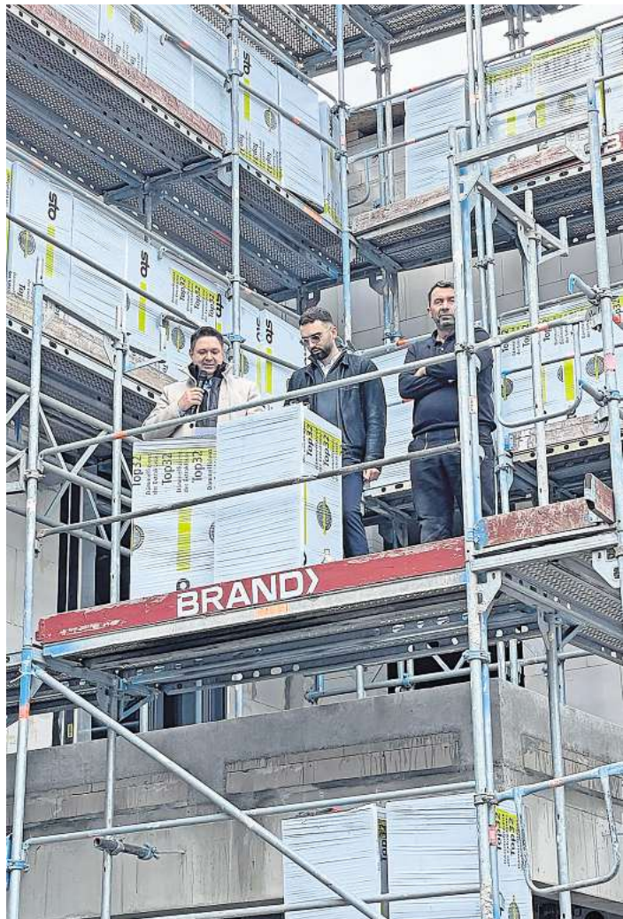
Während des Richtfestes.

Das zweite Halbjahr 2025 zeigt erneut, welchen hohen Stellenwert das Miteinander in Altencelle hat. Viele Projekte und Veranstaltungen verdeutlichen, dass die Bürgerinnen und Bürger des Ortsteils gemeinsam an einem Strang ziehen und das Zusammenleben aktiv gestalten.