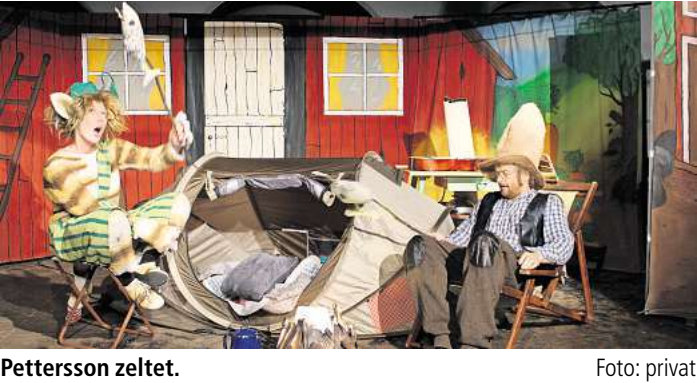
Pettersson zeltet.