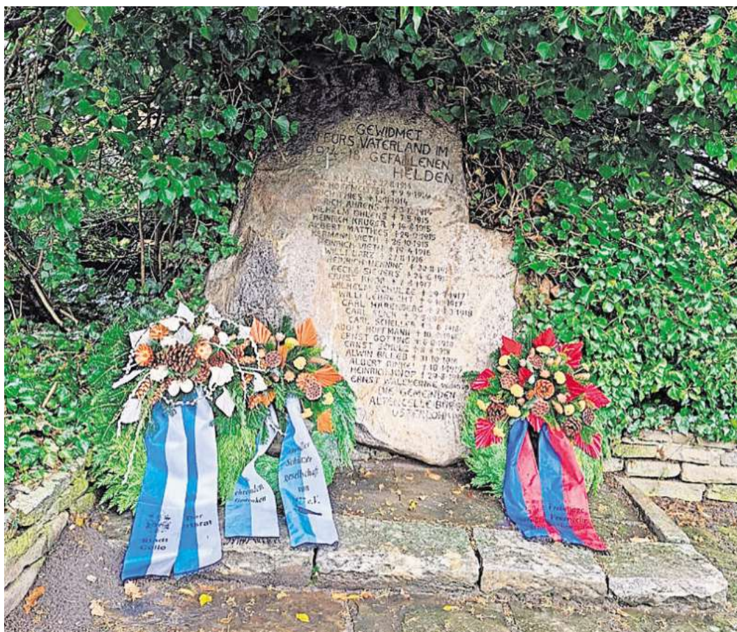
Gedenkstein in Altencelle.

Der Altenceller Sportverein organisierte erneut den beliebten