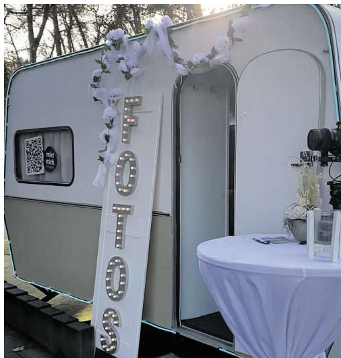
... Fotos vom Brautpaar und den Hochzeitsgästen ...