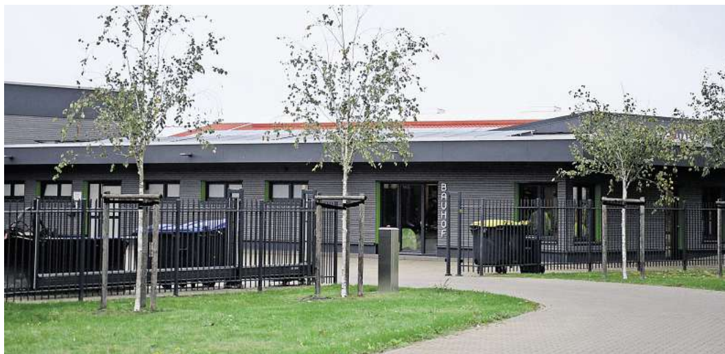
Der Bauhof in Lachendorf hat eine Photovoltaik-Anlage erhalten.

dorf war kürzlich Thema bei der Samtgemeinderatssitzung. „Wir haben ja schon seit vielen Jahren den großen Windpark im Schmarloh“, erläutert Suderburg. „Wir haben schon relativ früh die Planung für den Bereich Ahnsbeck, Bunkenburg und Helmerkamp vorangeschoben, wo wir jetzt von der Fläche fast durch sind, es aber im Moment aus