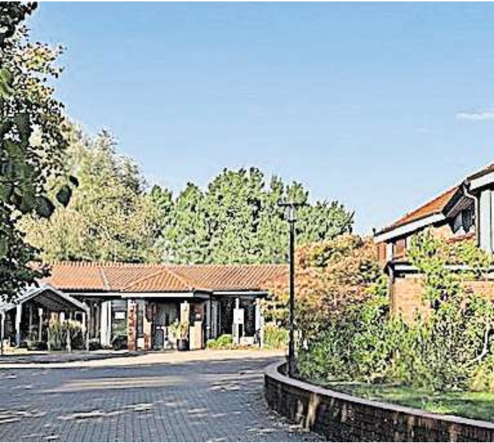
EFG Celle Wederweg.

draußen Halloween gefeiert wird, möchten sie drinnen zeigen – mit Gott kann man echte Freude erleben – hell, hoffnungsvoll und voller Leben. Eine Kostümierung ist erwünscht aber – gruselfreie Zone. Für kleine Snacks und Getränke ist gesorgt. Anmeldung unter Gemeindebüro EFG Celle unter Telefon 05141/908150 oder per Mail an sekretariat@efg-celle.de.