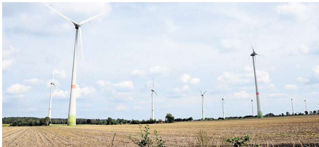
Im Windpark Schmarloh könnten weitere Windräder gebaut werden.

Abschließend spricht Suderburg das Schulwege-Konzept an. Nach den Herbstferien starte eine Befragung in den Schulen und Kindertagesstätten, sodass Eltern, Kinder und Lehrer Auskunft darüber geben können, wo sie, was den Schulweg betreffe, Engpässe und Schwierigkeiten sehen. Die Befragung laufe vier Wochen. Nach der Auswertung werde dann eine Priorisierung erstellt, um daraus entsprechende Maßnahmen abzuleiten.