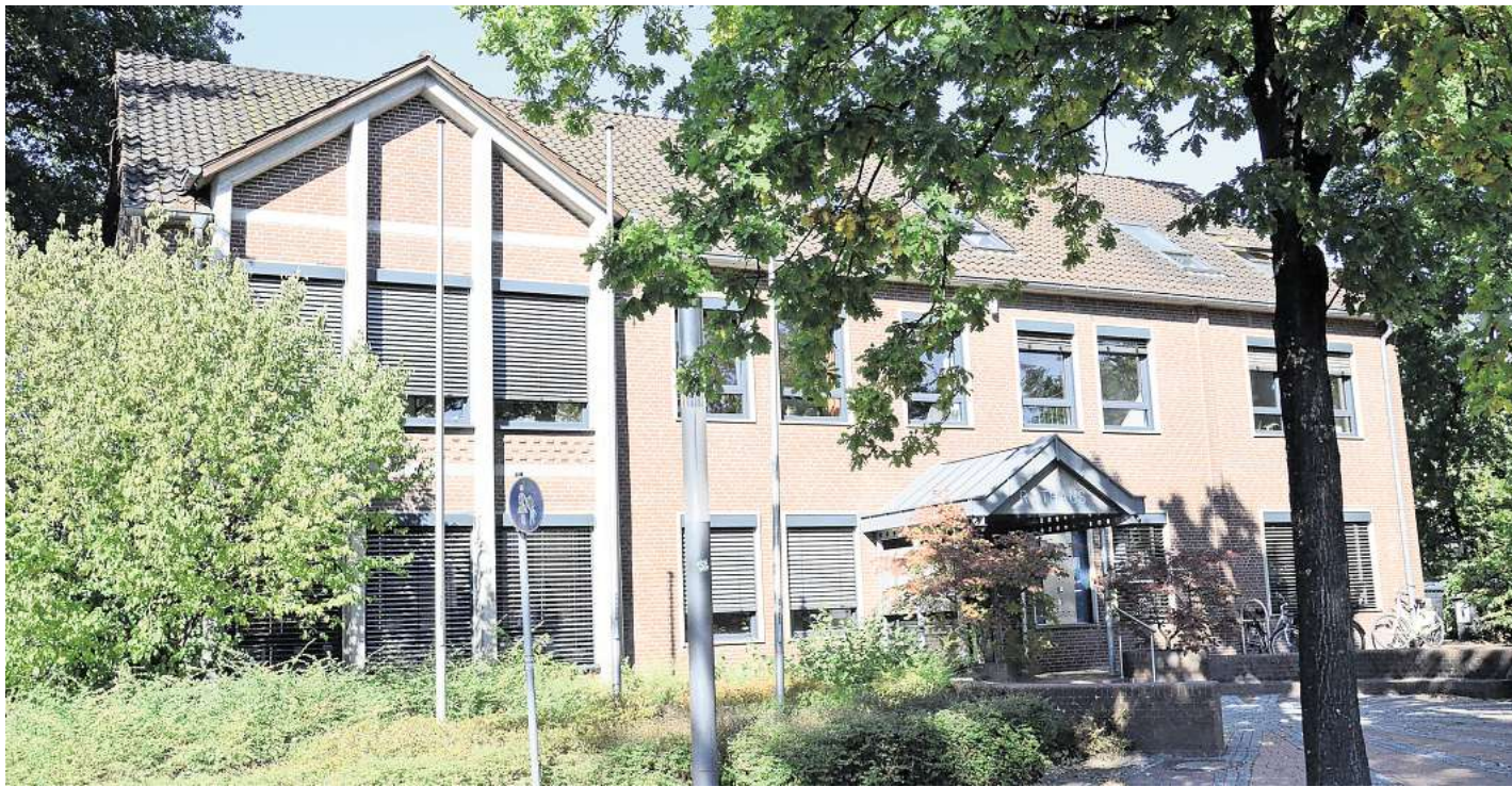
Das Rathaus in Lachendorf ist in die Jahre gekommen.