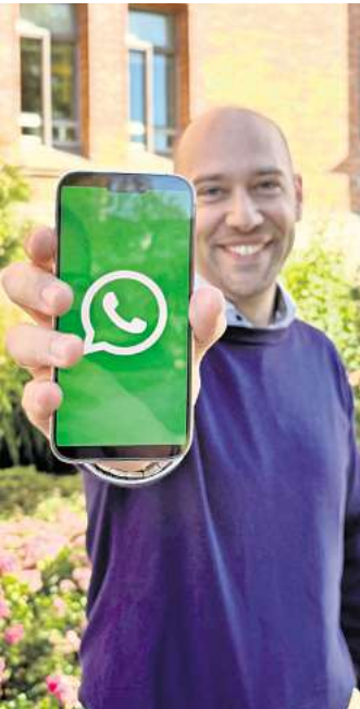
Los geht's: Die Stadtverwaltung startet ihren eigenen WhatsApp-Kanal.

CELLE. Einfach klicken und los geht's! Die Stadt Celle startet ab