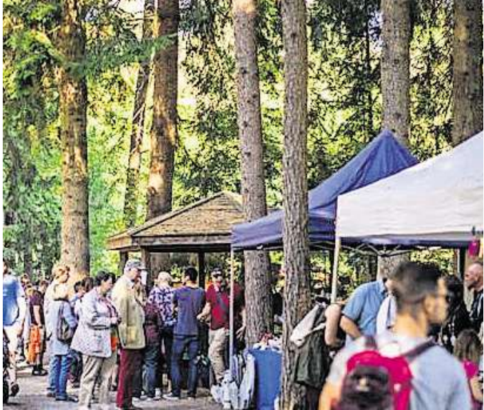
Ende Oktober findet im Wildpark Müden erneut ein Herbstmarkt statt.