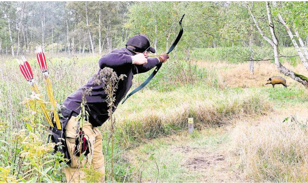
Auch mit dem Reiterbogen wurde geschossen.

42. Jagdturnier des SC Wietzenbruch am Kiebitzsee