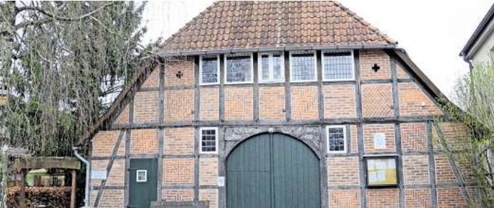
Das Römstedthaus in Bergen.