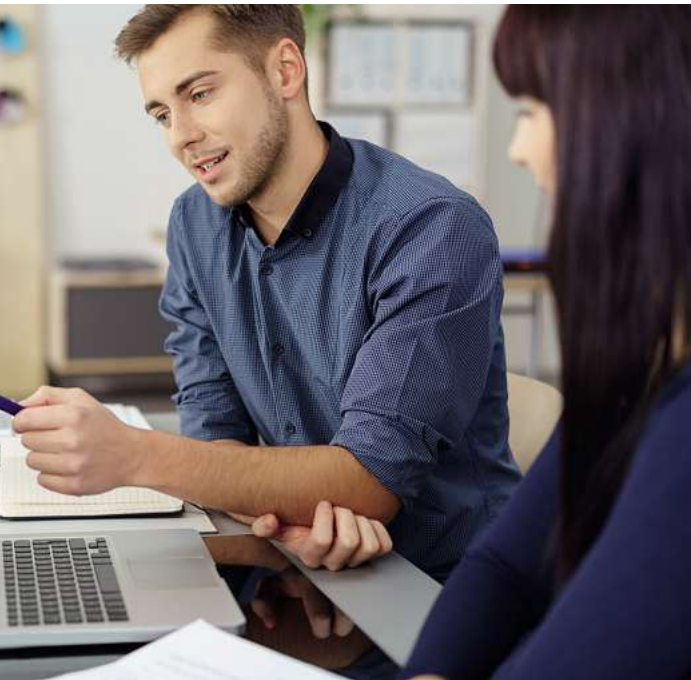
Die duale Ausbildung für Industriekaufleute dauert drei Jahre, kann sich bei guten Noten aber auf bis zu zwei Jahre verkürzen. Da während dieser Zeit viel Wissen auf unterschiedlichen Gebieten vermittelt wird, eröffnen sich den Berufsanfängern nach der Ausbildung diverse Karrierewege.

„Die Ausbildung vermittelt sehr breite Kenntnisse und eröffnet damit viele Karrierewege“, sagt Petra Timm, Pressesprecherin von Randstad Deutschland. „Nach dem Abschluss ist beispielsweise die Weiterbildung zum Fachwirt möglich, aber auch ein BWL-Studium – sogar berufsbegleitend.“ Wer also noch nicht so genau weiß, wo es beruflich hingehen soll, macht mit der Ausbildung zum Industriekaufmann oder zur Industriekauffrau wenig falsch. Hauptsache, die Aussicht auf Arbeitstage am Computerschreck nicht ab! Wer außerdem gute Noten in Mathematik, Deutsch und Englisch mitbringt, organisiert und sorgfältig ist und vielleicht schon mit Excel umgehen kann, bringt gute Voraussetzungen mit. Die dreijährige duale Ausbildung lässt sich bei guten Noten auf zweieinhalb oder sogar zwei Jahre verkürzen. (txn)