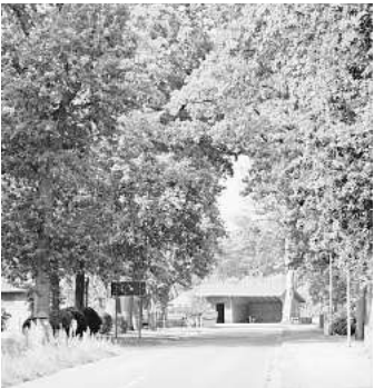
Bauarbeiten machen eine Vollsperrung der K 65 zwischen Jeverßen und Thören (B 214/L 180) erforderlich.

Der Landkreis Celle bittet um Verständnis und ist gemeinsam mit allen Beteiligten darum bemüht, einen reibungslosen Bauablauf sicherzustellen und die Beeinträchtigungen so gering wie möglich zu halten.