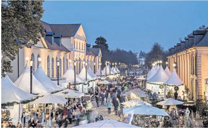
Der schönste vorweihnachtliche Markt Hannovers.