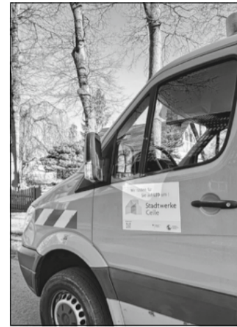
Die Stadtwerke Celle rüsten im Stadtgebiet die Straßenbeleuchtung um.

Mit der Nationalen Klimaschutzinitiative initiiert und fördert das Bundesumweltministerium seit 2008 zahlreiche