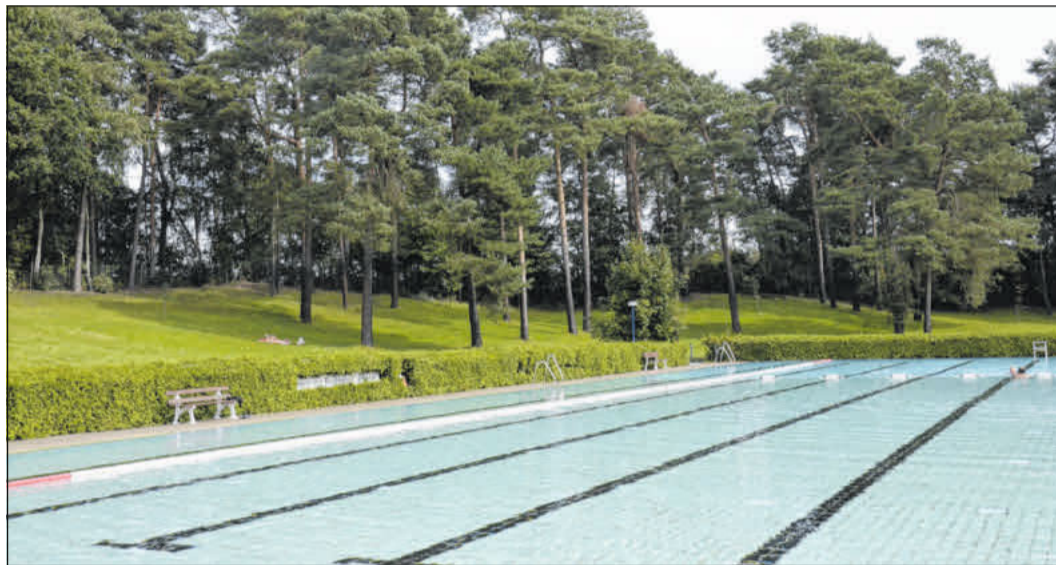
Die Freibadsaison 2024 startet.