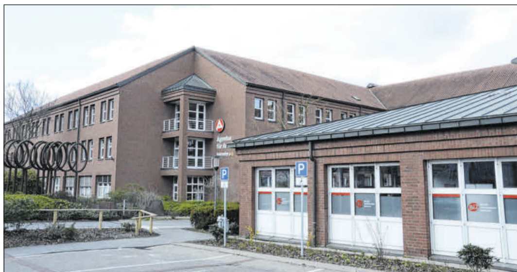
Zum Frühjahr ist eine sinkende Arbeitslosigkeit zu verzeichnen.