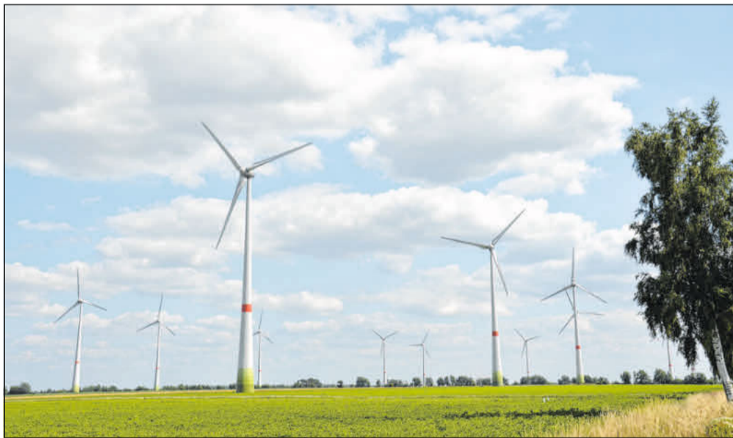
Eine Ausweisung von bis zu vier Prozent ihrer Flächen für Windenergie ist nach Ansicht der CDU-Landtagsfraktion für manche Landkreise nicht realisierbar.

Mein Video für Europa“ statt, ausgerichtet von der Europa-Union Celle. Der Eintritt ist frei.