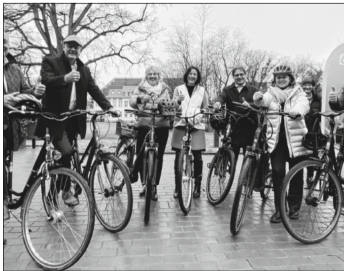
Vor Kurzem hatten bereits Landrat Axel Flader sowie die Bürgermeisterinnen und Bürgermeister der Celler Kommunen zur Teilnahme am Stadtradeln aufgerufen.

Das Ziel: Wir wollen gemeinsam für die Fitness und eine lebenswerte Umwelt vom 5. Mai bis zum Kampagnenende am 25. Mai - und gerne darüber hinaus - in die Pedale treten. Die Bürgermeisterinnen und -meister der Celler Kommunen sowie Landrat und Oberbürgermeister rufen dazu auf, möglichst viele Alltagswege mit dem Fahrrad zurück zu legen, zum Beispiel zur Arbeit, zur Schule oder zum Verein. Gemeinsam mit den Städten Bergen und Celle, den Samtge-