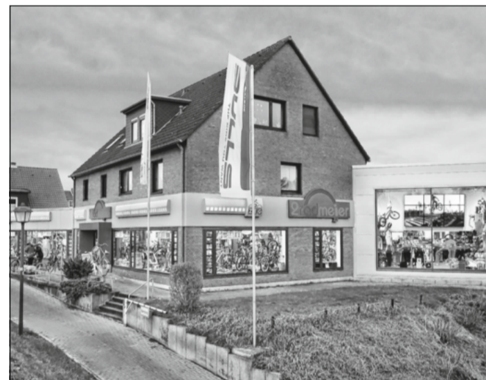
2-Rad-Meier in der Neustadt 42a in Celle.