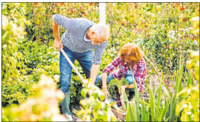
Gartenarbeit macht Freude, kann aber auch auf die Gelenke gehen - hier sind Vorsorge und schonende Maßnahmen gefragt.