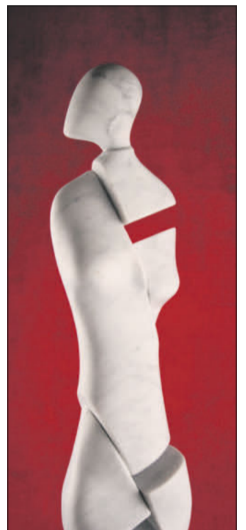
Die Skulptur „Erinnerung 2“.