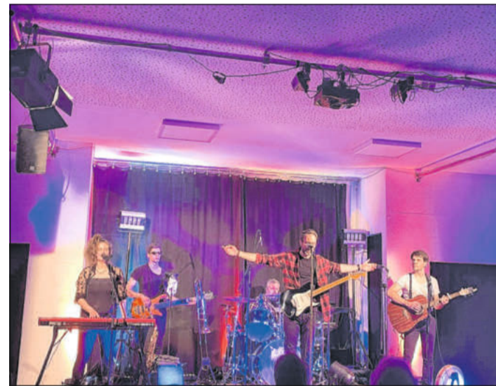
Die Celler Indie-Rockband Indeed bei ihrem Live-Auftritt.

Die Zuhörer ließen Indeed nicht ohne drei Zugaben gehen. Dabei gaben die fünf Musiker auch den Song „If I could change the world“ zum Besten. Es bietet sich die Gelegenheit, am heutigen Sonntag, 5. Mai, um 14 Uhr auf den Brandplatz in Celle zu kommen, um bei dem Videodreh zu diesem Lied mitzuwirken. Höhepunkt des Videodrehs wird ein Live-Auftritt von Indeed vor dem Celler Schloss sein. Mehr Infos hierzu gibt es auf der Homepage der Band unter www.indeed-band.de .