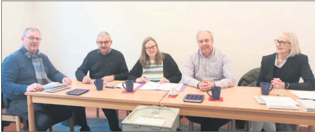
Das Wahlhelferteam in der Stadtkirche Celle.

WINSEN. Der dritte Pflanzenmarkt der Johannes-Kirchengemeinde findet am heutigen Sonntag, 21. April, ab 11 Uhr auf dem Kirchplatz in Winsen (Aller) statt. Gemeindeglieder, Mitbürger und Geschäftsleute aus Winsen und Umgebung stellen verschiedene Arten von Pflanzen zur Verfügung, die gegen Spenden mitgenommen werden können. Mit dem Erlös wird die musikalische Arbeit der Gemeinde unterstützt.