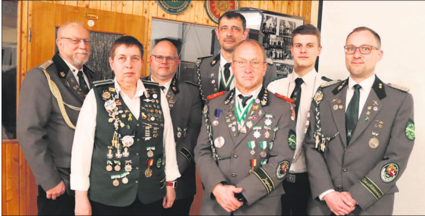
Während der Jahreshauptversammlung.