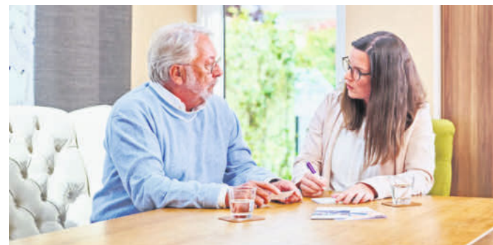
Eine Pflegeberatung hilft Betroffenen nicht nur bei der Organisation der Pflege, sondern bietet auch wichtige seelische Unterstützung.

Findet sich gerade nichts Passendes, sind auch Initiativbewerbungen willkommen. Gesucht werden Pflegefachkräfte, Sozialversicherungsangestellte und Personen mit entsprechendem Studium. Für die Vereinbarkeit von Familie und Beruf braucht es aber mehr als den Wunsch nach dem Arbeitsort. „Bei der Planung der Arbeitszeiten finden wir im Dialog ein ausgewogenes Verhältnis zwischen Planbarkeit und Flexibilität“, erklärt Jana Wessel. (DJD)