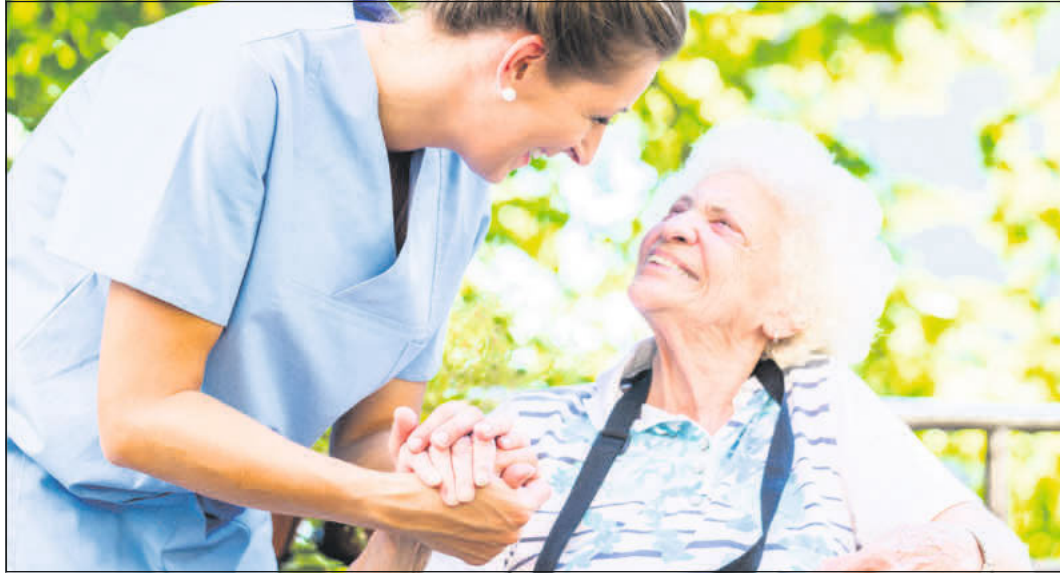
Die systemrelevante Berufsgruppe der Pflegerinnen und Pfleger wird in den kommenden Jahren noch stärker nachgefragt werden.