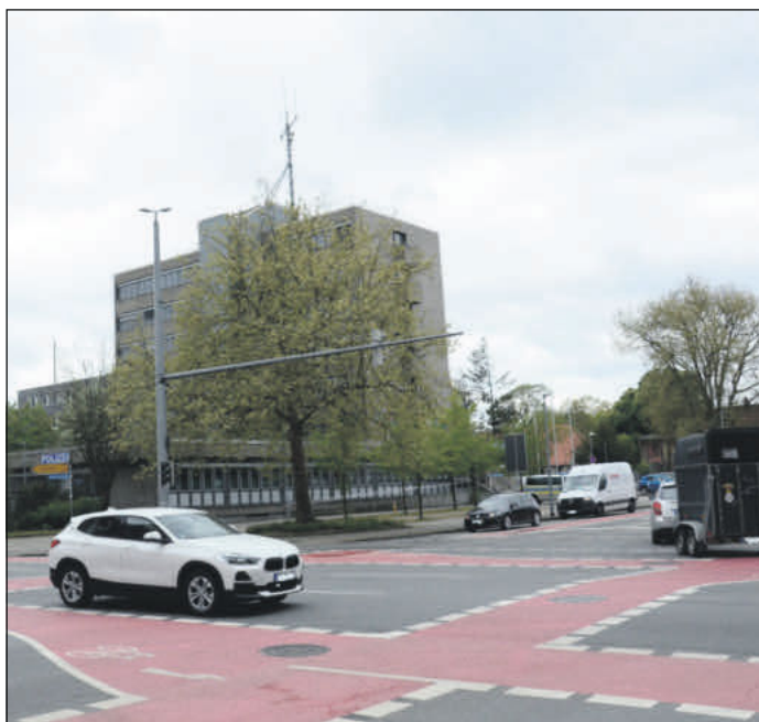
Die Polizei stellte die Unfallstatistik 2023 vor.

Polizeiinspektion Celle stellte Verkehrsunfallstatistik 2023 vor