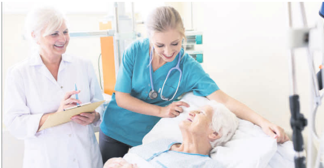
Die Ausbildungsordnung zur Pflegefachkraft wurde vereinheitlicht.