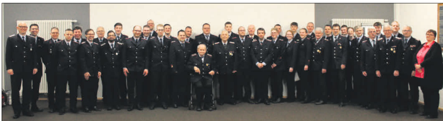
Während der Versammlung.