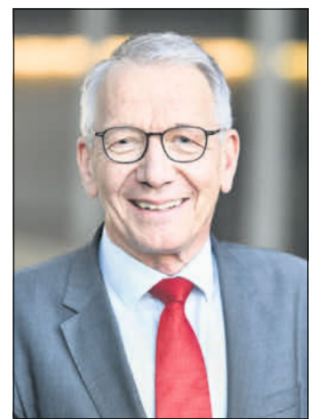
Dirk-Ulrich Mende.

„Wir setzen als Ampel ein deutliches Zeichen: Wir lassen die Kommunen bei der Herausforderung des natürlichen Klimaschutzes nicht allein“, so der SPD-Bundestagsabgeordnete abschließend.