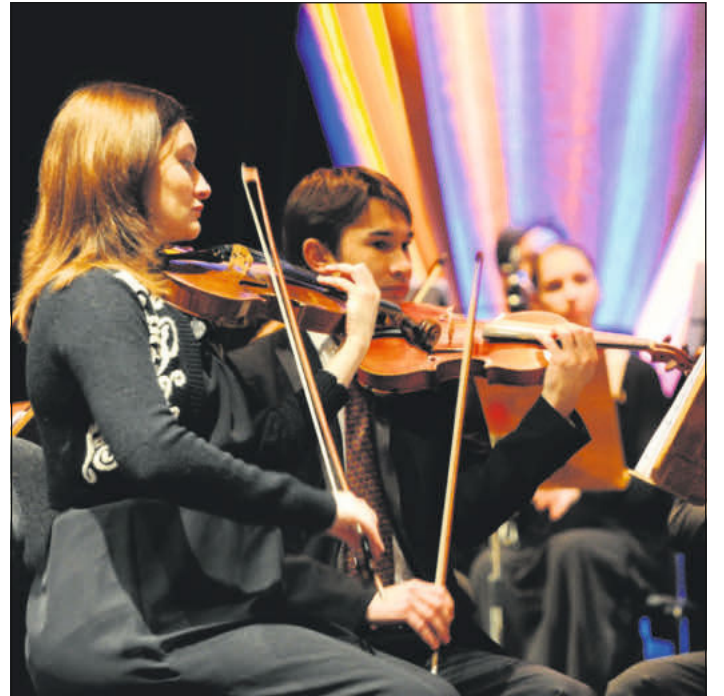
The Chambers.

Songs mit tiefgründigen Texten und Refrains, die zum Mitsingen einladen. Tickets gibt es im Vorverkauf für 20 Euro oder ermäßigt bei der CD-Kaserne Celle, an allen ADticket-VVK-Stellen, unter Telefon 069/90283986 (20 Cent pro Anruf aus den deutschen Festnetzen oder 60 Cent aus den deutschen Mobilfunknetzen) oder unter www.cd-kaserne.de .