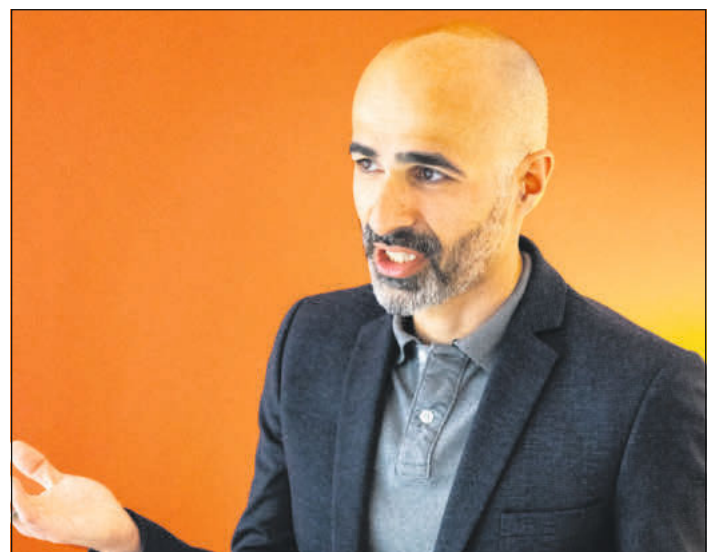
Savas Gel.