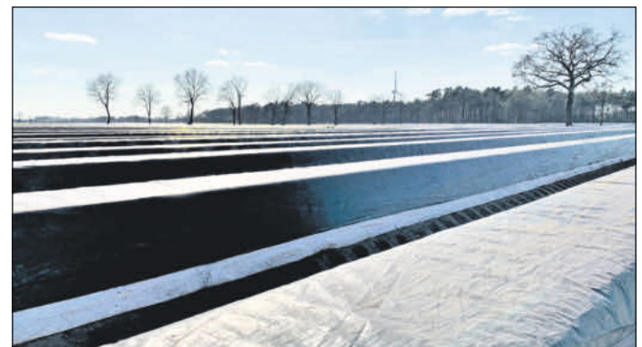
Spargel ist mit rund 4.400 Hektar im Ertrag stehender Anbaufläche die flächenstärkste Kultur im niedersächsischen Gemüseanbau.

Spargel aus der Region, direkt vom Erzeuger ist hinsichtlich Frische, Aroma und Zartheit nicht zu toppen. Wer ihn nicht direkt zubereiten möchte, wickelt ihn in ein feuchtes Tuch und legt sie in den Kühlschrank.