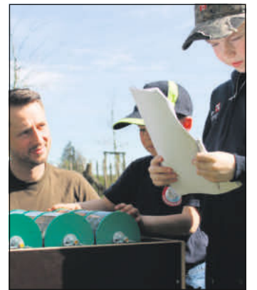
Infos über die heimischen Wälder.

verging die Zeit wie im Flug. Am Ende bedankte sich die Kinderfeuerwehr bei Lange für den tollen Nachmittag. So konnten alle Kinder nach interessanten zwei Stunden mit neuen Wissen nach Hause.