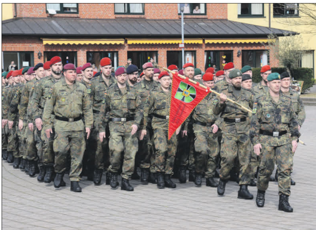
Der CDU-Bundestagsabgeordnete Henning Otte fordert, dass die Aufwuchsfähigkeit der Bundeswehr gestärkt werden müsse.

Die Gemälde des Künstlers sind noch bis zum 21. Juni zu sehen. Die Ausstellung ist montags bis donnerstags von 9 bis 15 Uhr und freitags von 9 bis 12 Uhr geöffnet.