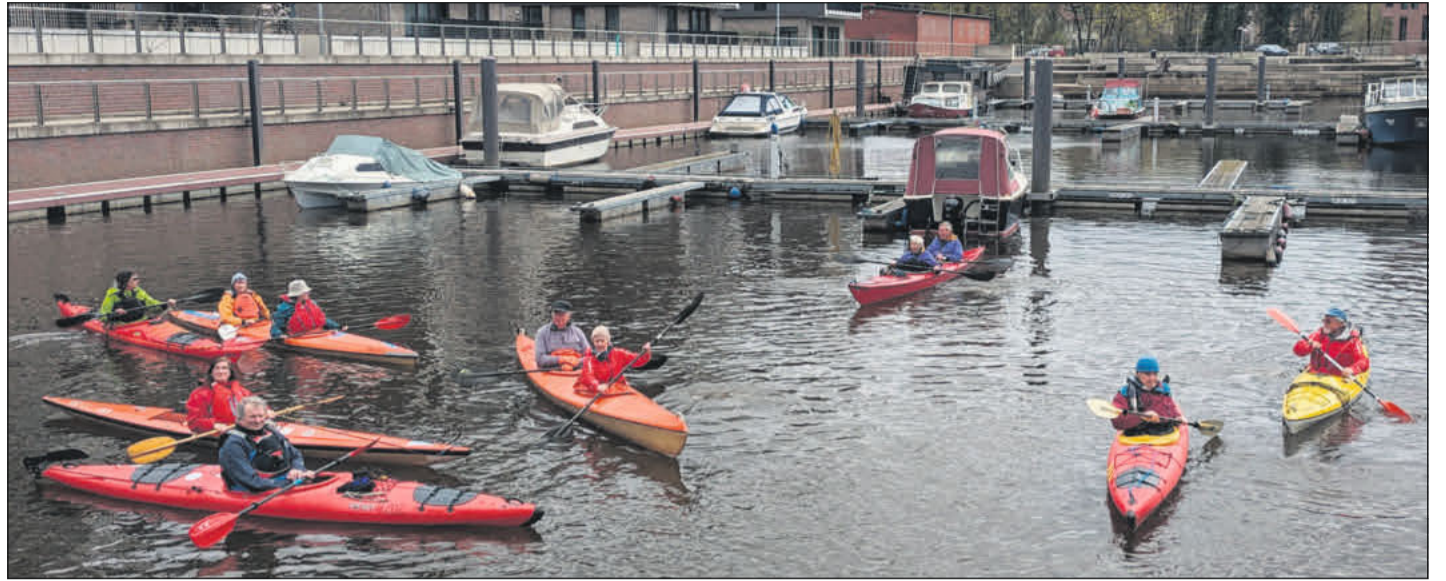
Die „Forellenfahrer“ der Kanu-Gesellschaft Celle vor dem Start im Celler Hafen.

Alle Gärten mit Beschreibung und Öffnungszeiten stehen in der neuen Broschüre vor allem die Möglichkeiten des naturnahen, insektenfreundlichen Gärtners zeigen. Die Broschüre ist bei der vhs Celle, Trift 20, erhältlich sowie im Heilpflanzengarten, der Tourismus-Information und vielen Geschäften und Gärtnereien in und um Celle.