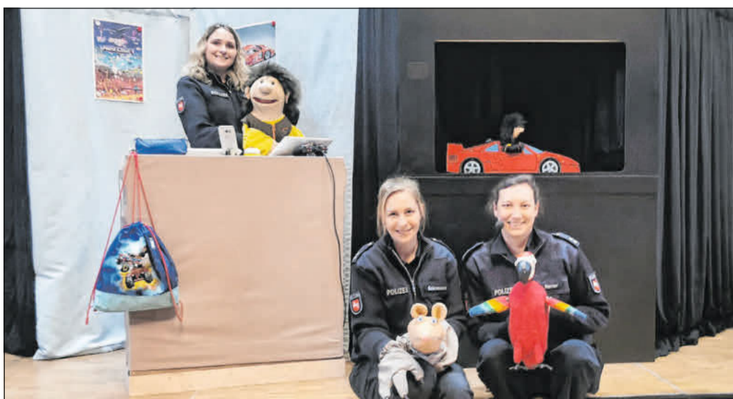
Das Team der Präventionspuppenbühne in Celle.