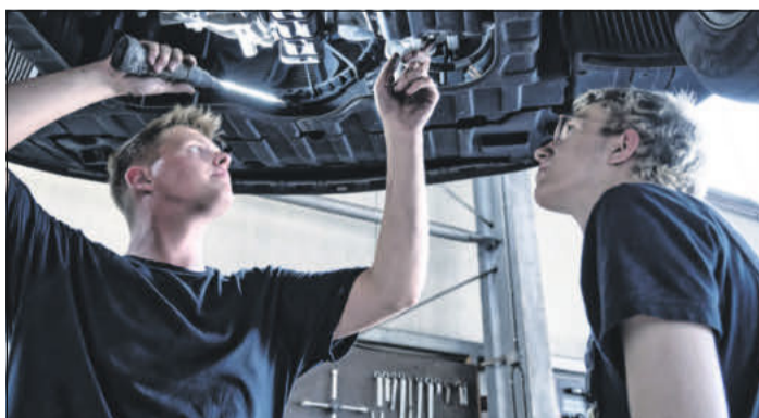
Beim Klimaanlage-Check prüft der Kfz-Mechaniker alle Teile der Anlage und ihre Funktionen.

gut geeignet. Nach spätestens fünf Minuten sollte man jedoch auf Normalbetrieb umstellen, sonst sinkt der Sauerstoffgehalt. Auch eine zu starke Abkühlung ist zu vermeiden. Als Vorbeugung gegen Gerüche sollte die Klimatisierung ein paar Minuten vor Fahrtende ausgeschaltet werden. (djd)