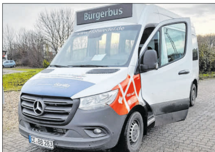
Der Bürgerbus Flotwedel.