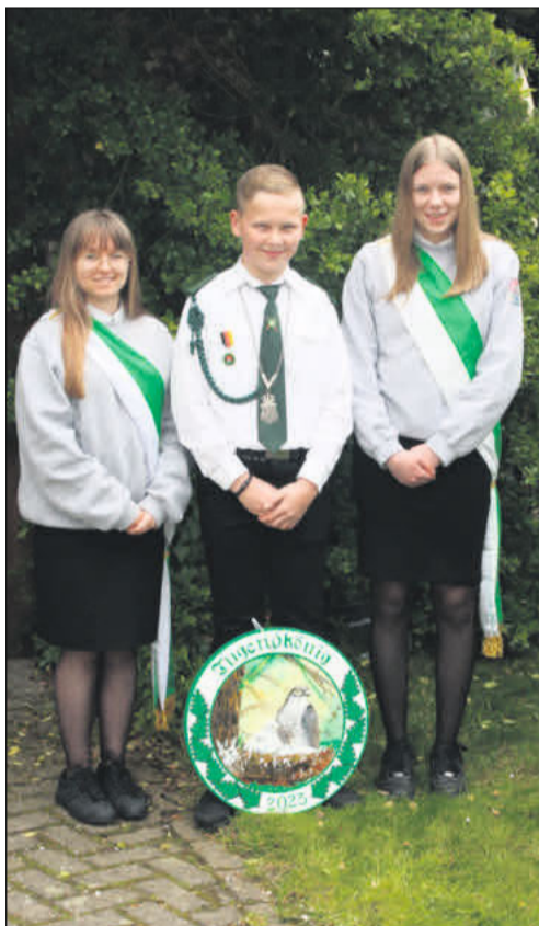
Der Jugendkönig 2023.