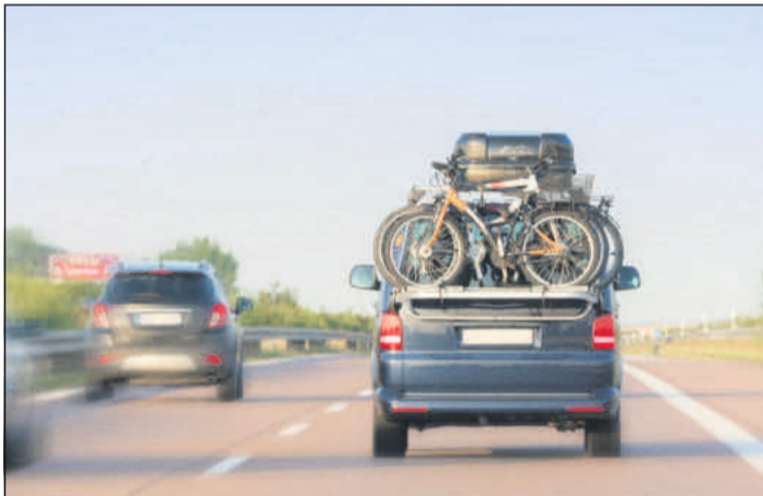
Mit dem Auto in den Urlaub: Wer die Reise gut vorbereitet, fährt sicherer und mit deutlich weniger Stress.

Darüber hinaus empfiehlt es sich, Verbandskasten und Pannenset zu kontrollieren. Für jeden Passagier sollte eine Warnweste griffbereit sein. (txn)