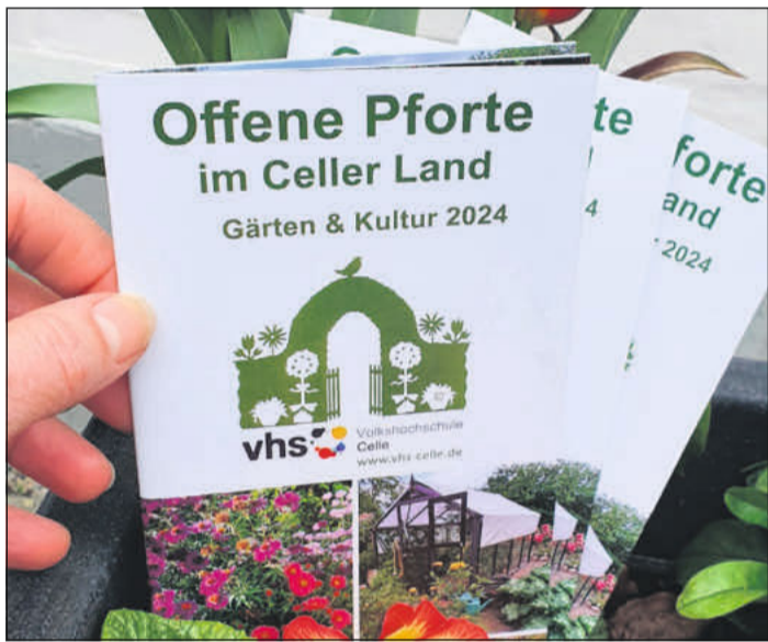
Offene Pforte 2024.

Die Kanuten verbrachten an diesem Abend noch einige fröhliche Stunden in geselligem Kreise.