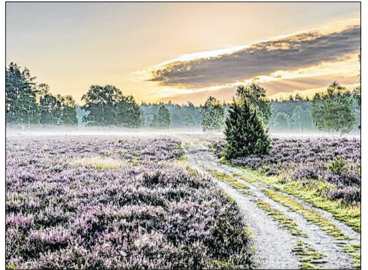
Der Naturpark Südheide zieht mit seiner schönen Landschaft, hier ein Bild aus der Misselhorner Heide, jedes Jahr viele Besucher an.

Auch die weitere Entlastung für die Geschädigten des Hochwassers beschäftigt den Landtag erneut. Ein Antrag der CDU-Fraktion, der „Unbillige Härten vermeiden“ will, wurde abschließend beraten. Schepelmann: „Bei den Hochwassern 2013 und 2017 haben Bund und Land eine Reihe von Entlastungen zugestanden, damit das Besteuerungsverfahren die Not nicht unnötig vergrößert. Auch das Hochwasser im Dezember 2023 hat unzählige Existenzen bedroht und erfordert klare Maßnahmen, um den Betroffenen zu helfen.“ Doch bislang wurden keine angemessenen Maßnahmen bei der Besteuerung ergriffen und noch nicht einmal mit dem Bund dazu beraten. Die Landesregierung erklärte dazu lediglich, dass die Finanzämter innerhalb ihrer Spielräume individuell auf Betroffene eingehen könnten.