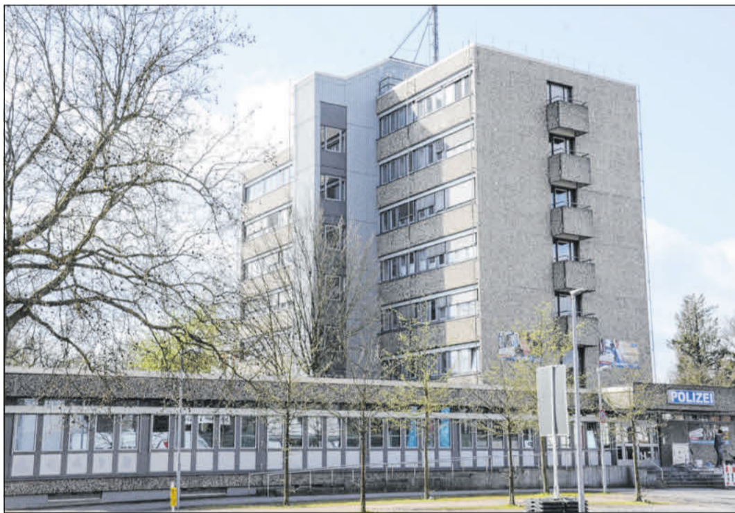
Mit einem Antrag setzt sich die CDU für die Ordnung des Gebührenrechts bei der Polizei ein.

Während des gesamten Jubiläumjahres finden verschiedene Veranstaltungen, Aktionen, Feste, Ausstellungen und Führungen statt.