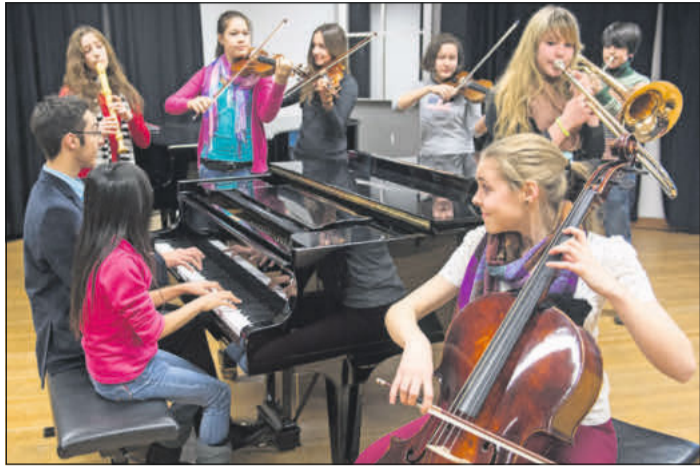
Nachwuchskünstler vom IFF.