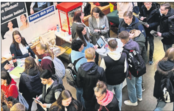
Bei der Messe herrscht immer großer Andrang.