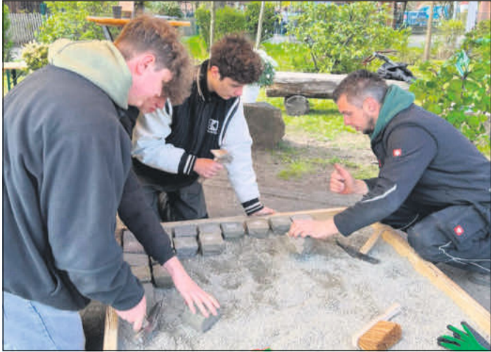
Das Verlegen von Steinen ausprobieren.

Die verschiedensten Berufe werden von den teilnehmenden Firmen für eine Ausbildung, ein Praktikum oder einen Schülerjob insgesamt im Verbandsgebiet angeboten. Auch verschiedene Angebote für ein Studium oder ein fachschul- oder studienbegleitendes Praktikum stehen innerhalb der Mitgliedschaft des Unternehmerverbandes Südheide e.V. zur Verfügung. Der Unternehmerverband Südheide hat aktuell zur Berufs- und Ausbildungsmesse den Azubi-Flyer 2024 herausgegeben, in dem alle Angebote für Ausbildung, Praktikum, Schülerjob, Studium innerhalb der Mitglieder des Unternehmerverbandes zusammengefasst jedes Jahr aktuell herausgegeben werden. Von diesen vielen Angeboten werden die Berufsbilder und Praktikums- und studienbegleitende Angebote präsentiert. Die Messe ist ein Auszug der Angebote an die Schüler.