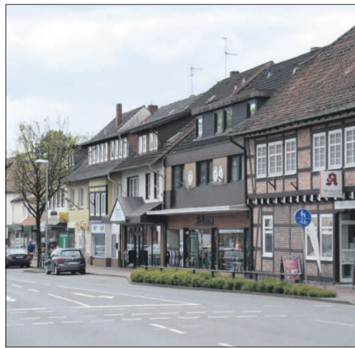
In Bergen findet am 28. April der Frühlingsmarkt „Bergen blüht auf“ und ein verkaufsoffener Sonntag statt.