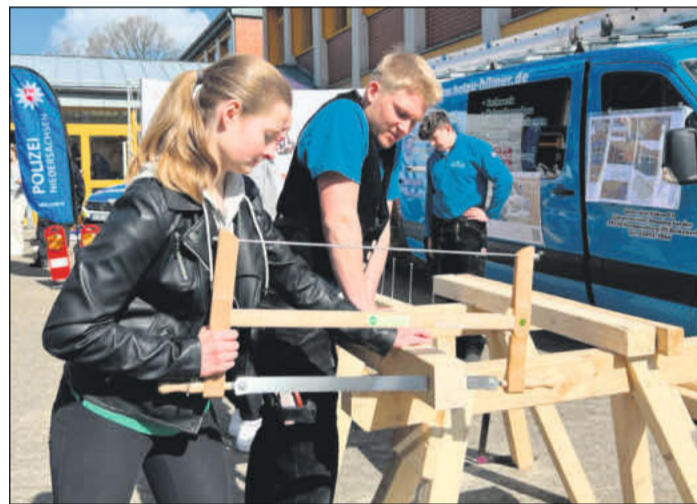
Arbeiten mit Holz ausprobieren.