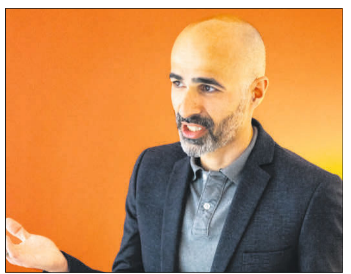
Savas Gel.