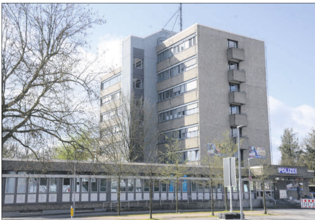
Mit einem Antrag setzt sich die CDU für die Ordnung des Gebührenrechts bei der Polizei ein.

Während des gesamten Jubiläumjahres finden verschiedene Veranstaltungen, Aktionen, Feste, Ausstellungen und Führungen statt.