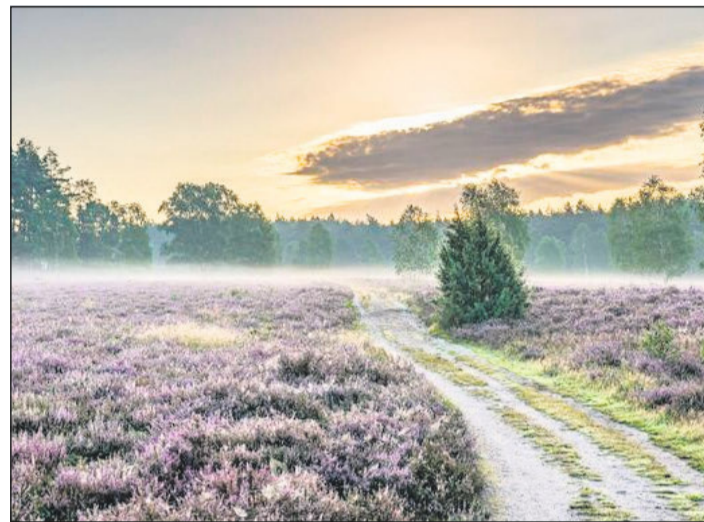
Der Naturpark Südheide zieht mit seiner schönen Landschaft, hier ein Bild aus der Misselhorner Heide, jedes Jahr viele Besucher an.

Auch die weitere Entlastung für die Geschädigten des Hochwassers beschäftigte den Landtag erneut. Ein Antrag der CDU-Fraktion, der „Unbillige Härten vermeiden“ will, wurde abschließend beraten. Schepelmann: „Bei den Hochwassern 2013 und 2017 haben Bund und Land eine Reihe von Entlastungen zugestanden, damit das Besteuerungsverfahren die Not nicht unnötig vergrößert. Auch das Hochwasser im Dezember 2023 hat unzählige Existenzen bedroht und erfordert klare Maßnahmen, um den Betroffenen zu helfen.“ Doch bislang wurden keine angemessenen Maßnahmen bei der Besteuerung ergriffen und noch nicht einmal mit dem Bund dazu beraten. Die Landesregierung erklärte dazu lediglich, dass die Finanzämter innerhalb ihrer Spielräume individuell auf Betroffene eingehen könnten.