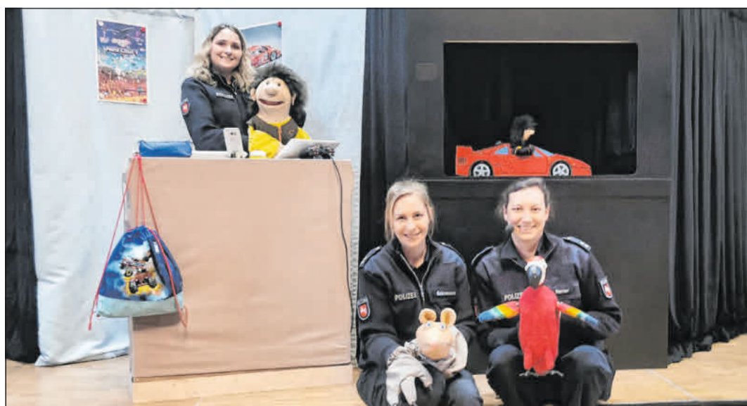
Das Team der Präventionspuppenbühne in Celle.