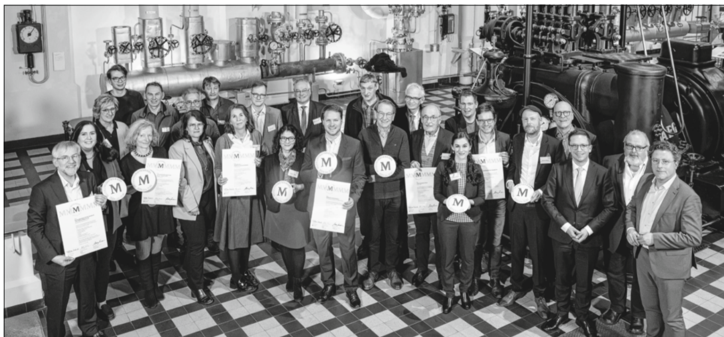
Übergabe des Museumsgütesiegels 2024 bis 2030.