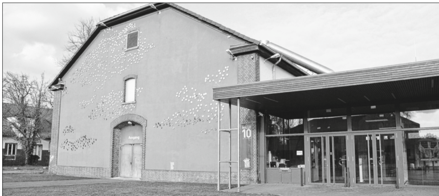
Der Haushaltsausschuss des Bundes hat 2.568.751 Euro für die Sanierung der CD-Kaserne in Celle bewilligt.