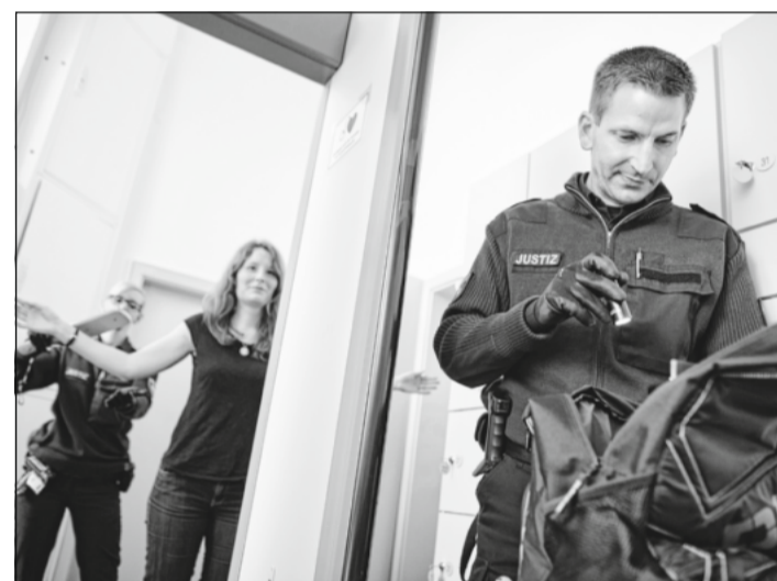
Bei einem Rundgang wurde über Eingangs- und Sicherheitskontrollen und andere interessante Themen informiert.

Der Arbeitskräftemangel sei inzwischen eines der größten Probleme der deutschen Wirtschaft, so Mende. Egal ob im produzierenden Bereich oder im Dienstleistungssektor, auf dem Bau, in der Pflege, in der Industrie oder in der Gastronomie, überall würden Mitarbeiter, sowohl Fachkräfte als auch Ungelernte, fehlen. „Bei dieser Veranstaltung soll es vor allem um den Austausch mit den Bürgerinnen und Bürgern zu diesem Thema gehen“, erklärt Mende.