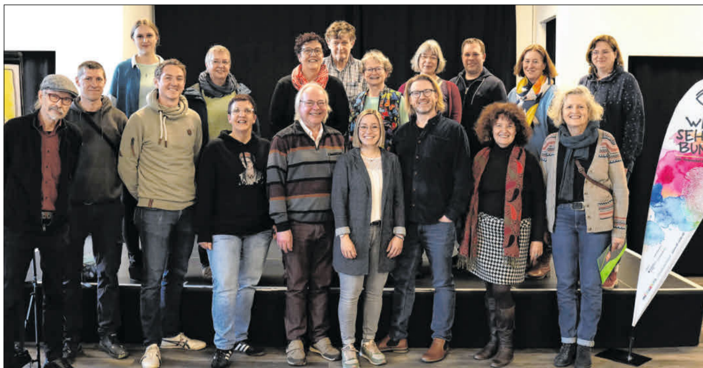
Jetzt geht es los: Die Projektträgerinnen und Projektträger freuen sich, ihre Ideen in der Partnerschaft für Demokratie in Celle umzusetzen.