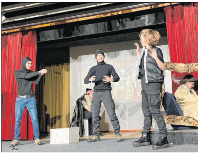
Die Theater-AG präsentiert ihre neueste Produktion.

hafte Seite, als Puck aus Shakespeares „Sommer-nachtstraum“ sich für eine kunstvolle Entdeckungreise zwei Gefährten zum Leben erweckt. Gemeinsam mit Goethe und einer gewissen Plastik namens Ken führt Puck durch eine Szenencollage über Kunst in vielen Facetten: Malerei, Schauspiel, Dichtung, Tanz und Gesang. Dabei lernen die Figuren einerseits viel über ihre eigenen Stärken und Schwächen, andererseits tauschen sie ihre Ansichten aus. Der Eintritt ist frei, um Spenden wird gebeten.