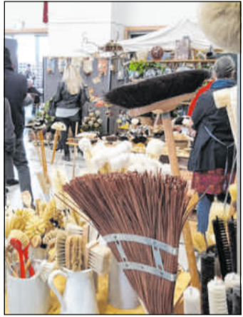
Der „Handgemacht“-Markt lockt jedes Jahr viele Besucher an.

CELLE. Bereits zum 19. Mal treffen sich am kommenden Wochenende, 16. und 17. März, zirka 60 ausgesuchte Künstler und Kunsthandwerker und besondere Anbieter, die aus der gesamten Bundesrepublik anreisen zu einem