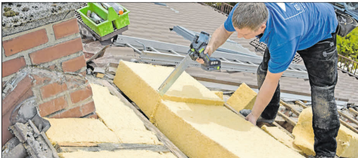
Mit durchdachten Sanierungssystemen auf Basis von Holzfaser-Dämmstoffen lassen sich Steildächer schnell, wohngesund und energiesparend sanieren.