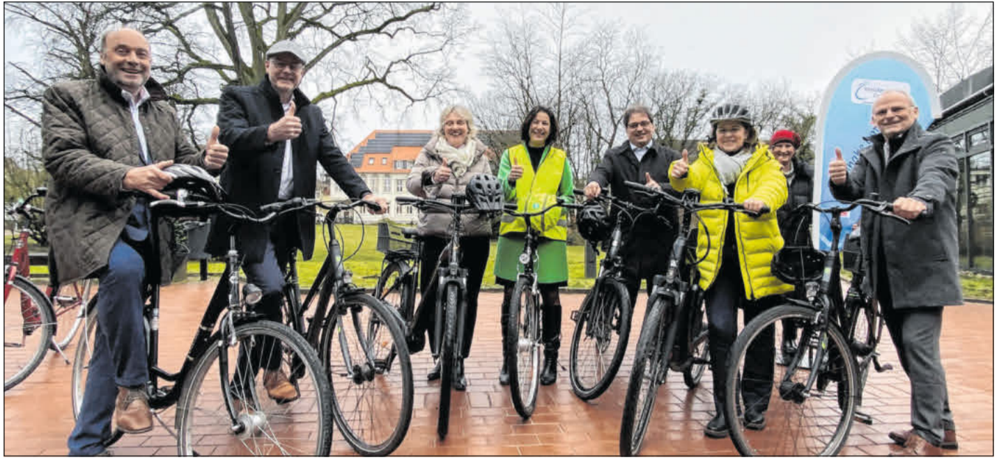
Die Bürgermeisterinnen und -meister der Celler Kommunen sowie Landrat und Oberbürgermeister und der Kreissportbund rufen dazu auf, möglichst viele Alltagswege zwischen dem 5. und 25. Mai mit dem Fahrrad zurück zu legen, zum Beispiel zur Arbeit oder zur Schule.

Der Markt ist am Samstag, 16. März, von 10 bis 18 Uhr, am Sonntag, 17. März, von 11 bis 18 Uhr geöffnet. Der Eintritt in die CD-Kaserne kostet 2,50 Euro. Kinder haben freien Eintritt. Das Parken ist ebenfalls frei.