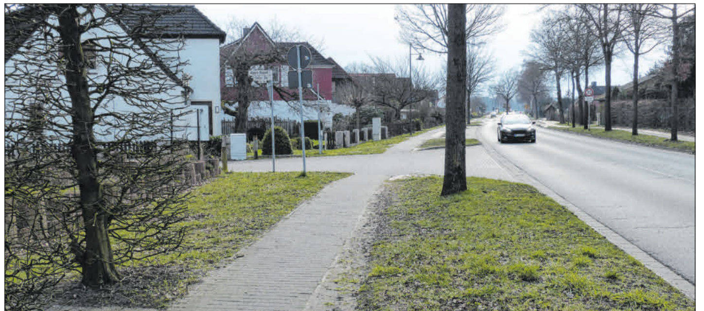
Standorte für die Ruhebänke sind auch an der Celler Straße in Eschede geplant.

Das Projekt greift das Bedürfnis der beteiligten Kommunen nach mehr Begegnungsplätzen in den Orten und außerorts auf und schafft einen direkten Mehrwert für Einwohnerinnen und Einwohner und Besucherinnen und Besucher der Region.