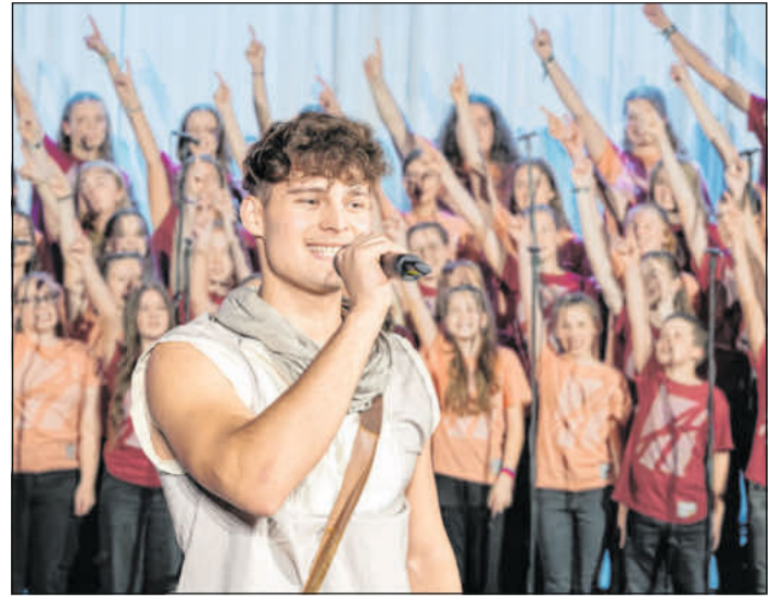
„Petrus der Apostel“ - ein Adonia Musical.