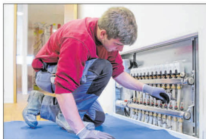
Installateure sind Spezialisten für Klimaschutz, sie können einen wichtigen Beitrag zur Umstellung auf dekarbonisierte Heiztechniken leisten.

Das SHK-Handwerk hat goldenen Boden - dieser Satz hat heute mehr Gültigkeit denn je. Denn die Betriebe aus den Bereichen Sanitär-, Heizungs- und Klimatechnik spielen eine wichtige Rolle dabei, die steigenden Anforderungen des Klimaschutzes und unsere wachsenden Ansprüche an den Komfort im Badezimmer zu erfüllen. Die SHK-Branche ist überall dort gefragt, wo es darum geht, Wohn- und Geschäftsgebäude mit klima- und umweltfreundlicher sowie ressourcenschonender Technik für Heizung, Klimatisierung und warmes Wasser auszustatten und die Lebensqualität im Bad zu verbessern. Mit einer dualen SHK-Ausbildung können junge Menschen auf ein Berufsfeld mit ausgezeichneten Entwicklungsperspektiven und großem Zukunftspotenzial setzen.