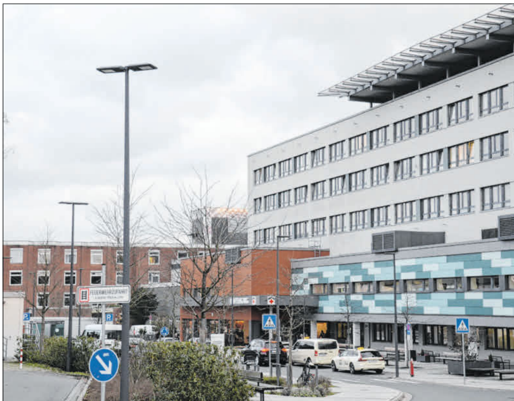
Das AKH Celle.

Euro veranschlagt, 2030 soll er eröffnet werden. Zu den Neubauplänen gehört auch ein Parkhaus mit, nach derzeitiger Planung, rund 380 Einstellplätzen, das direkt an der Lüneburger Straße entstehen soll. Die notwendigen Vorbereitungen sind abgeschlossen, mit dem Abriss der dort noch vorhandenen Gebäude wird in Kürze begonnen. Voraussichtlich Ende des Jahres fällt dann der Startschuss für den eigentlichen Parkhausbau. „Mit dem neuen Parkkonzept wird sich die Verkehrssituation rund um das AKH verbessern“, so die beiden Vorstände. „Und auch wenn sich das Gesicht des Klinikums im Zuge des Neubaus sicherlich hier und da verändern wird – an einem Grundsatz wird nicht gerüttelt: Als Stiftung bürgerlichen Rechts sind wir dem Gemeinwohl verpflichtet und nicht irgendwelchen Aktionären“, erklären Windmann und Caesar abschließend. „Das AKH bleibt ein starker Gesundheitspartner für die Bürgerinnen und Bürger der Region und darüber hinaus und wird immer da sein, wenn es darauf ankommt.“