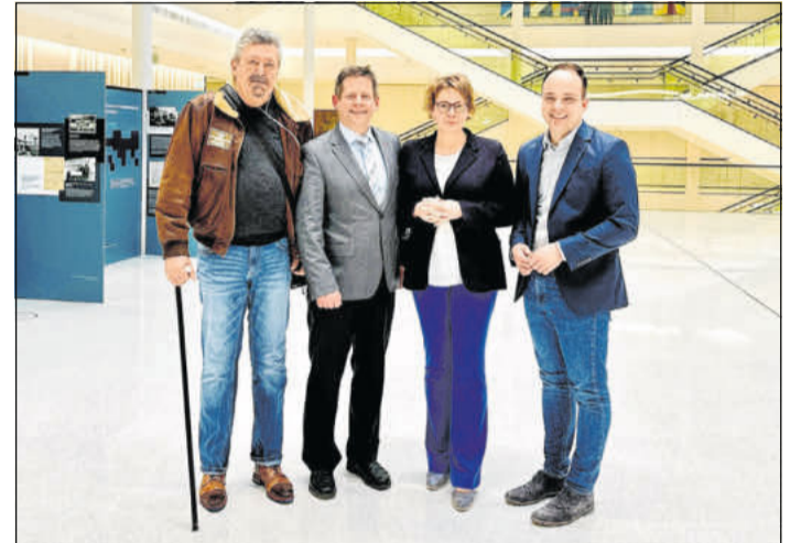
Zu Besuch bei Ministerin Daniela Behrens.

Dabei sollen auch die geplanten pädagogischen Angebote für die Demokratiestärkung vor Ort in der Gemeinde hervorgehoben werden. „Wir haben gemeinsam Innenministerin Daniela Behrens eingeladen, vor Ort in Eschede und in Niedersachsen im Rahmen einer inhaltlichen Veranstaltung zu berichten und freuen uns, dass sie zugesagt hat, ein Termin wird jetzt abgestimmt, dazu werden wir breit einladen. Das wird neben den bisherigen Demos ganz bewusst ein