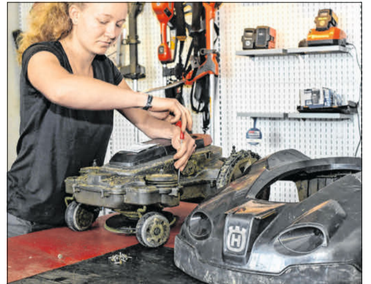
Bei mechatronischen Berufen stehen Wartung und Reparatur von Garten- und Outdoorgeräten im Mittelpunkt.

Hier finden Jugendliche, aber auch Eltern weitere Informationen: Ein Termin für eine Beratung kann unkompliziert rund um die Uhr im Internet unter www.arbeitsagentur.de/eservices oder unter Telefon 0800/4555500 (kostenfrei) vereinbart werden. To-go: Unterwegs nach Ausbildungsstellen suchen oder mehr über Berufe erfahren. Viele Infos, wie zum Beispiel AzubiWelt oder Beruf-eTV, gibt es auch als App fürs Smartphone oder Tablet.