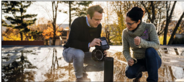
Intelligente Dachlösungen: Von Dachdeckern für Dachdecker entwickelt.

Die Integration von Drohnen und 3D-Technologie hat die Inspektion und Planung von Dachprojekten ebenfalls weiter nach vorne gebracht: Drohnen machen präzise Luftaufnahmen, um den Zustand von Dächern zu bewerten und erste Kostenschätzungen zu erstellen. (akz-o)