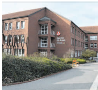
Die Arbeitslosenquote erhöhte sich von Januar auf Februar um 0,1 Prozentpunkte auf 6,5 Prozent.

lich geringer aus. Es ist zudem eine kontinuierliche Abnahme der Bestandszahlen der gemeldeten zu besetzenden Arbeitsstellen zu verzeichnen. „Die wirtschaftliche Entwicklung lässt die Betriebe bei