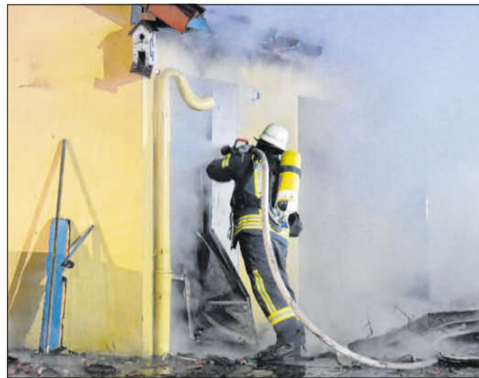
Bei der Brandbekämpfung.