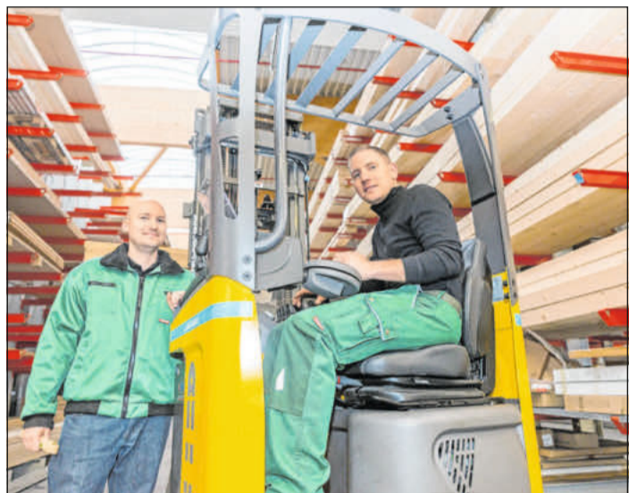
Neben kaufmännischen Berufen bietet der Holzfachhandel eine fundierte Ausbildung auch in der Logistik.