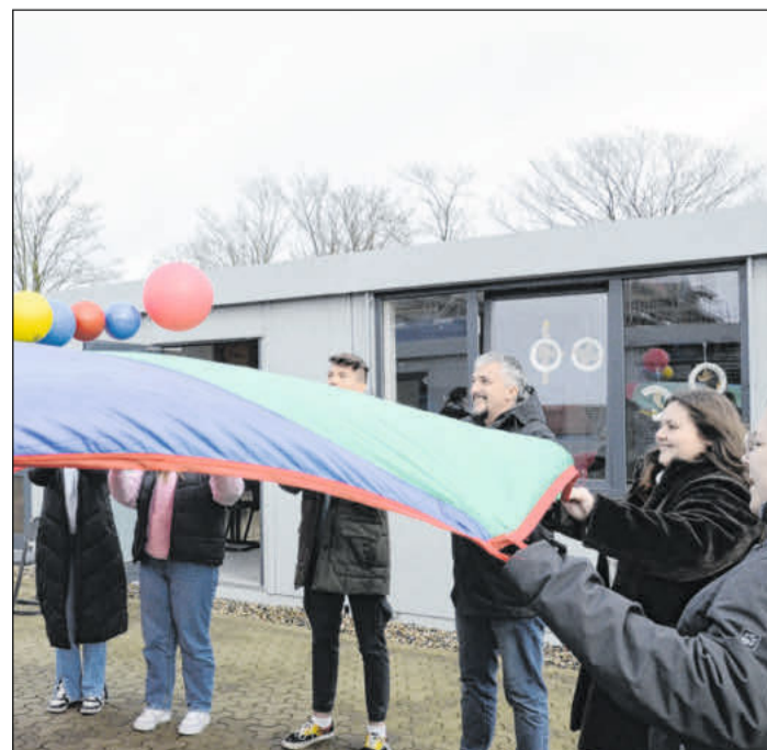
Beim Kennenlernen von Spielen.