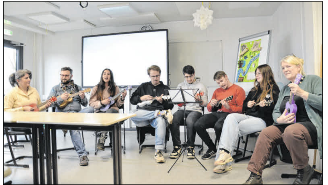
Zukünftige pädagogische Fachkräfte erlernen die Ukulele.