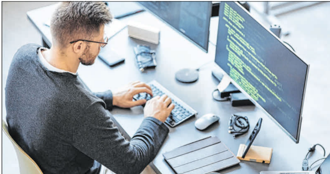
Die zunehmende Delegation von Routineaufgaben an Maschinen verändert nicht nur die Arbeitswelt, sondern schafft auch Raum für neue Berufe. Menschen bleiben entscheidend, um KI-Systeme zu trainieren und anzuleiten.