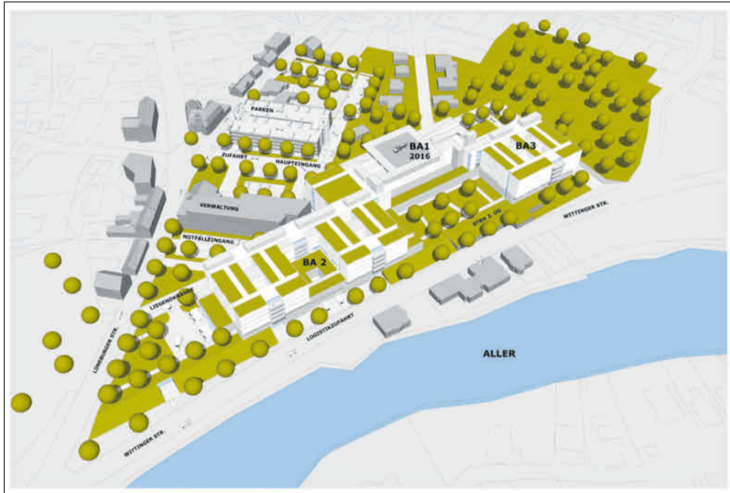
So könnte es aussehen: Mit dem Teilneubau des AKH soll ein modernes Krankenhaus aus einem Guss mit zeitgemäßen Strukturen für Patientinnen und Patienten sowie für Mitarbeiterinnen und Mitarbeiter entstehen.