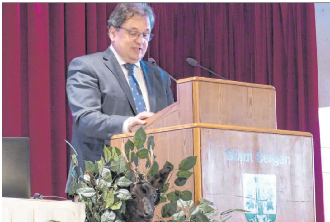
Landrat Axel Flader sprach zu Abschluss der Kreishegenschau zu den Gästen.

Im Einsatz waren rund 50 Einsatzkräfte der Ortsfeuerwehren Hustedt, Scheuen und Celle-Hauptwache sowie die Logistik-Gruppe. Ebenfalls im Einsatz waren der Rettungsdienst und die Polizei. Zur Brandursache kann die Feuerwehr keine Angaben machen.