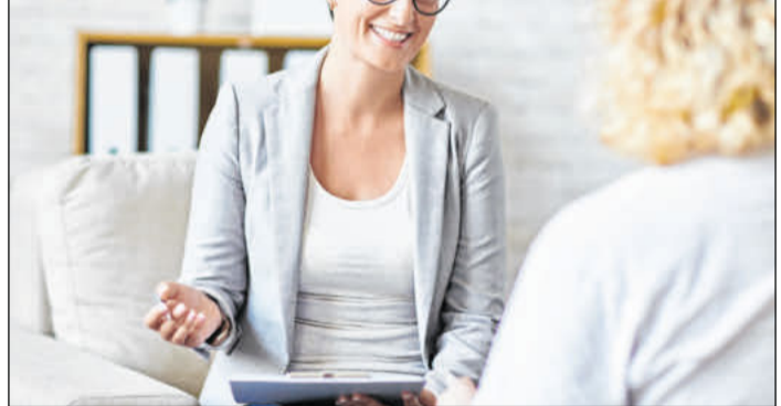
Nach einer Weiterbildung kann man sich auch als Energieberaterin selbstständig machen und private Haushalte beraten.

Die Palette der Kurse reicht von Weiterbildungen zum Klimaschutzmanager, internen Auditor für Energiemanagement, Energieeffizienzexperten, externen Umweltauditor oder Umweltmanagementbeauftragten bis hin zum Energieberater Professional. Auch Fortbildungen zu verschiedenen Energie- und Umwelt-Themen wie Solarenergie, Wasserstoff, Windkraftanlagen und Abfallrecht gehören zum Repertoire. (DJD)