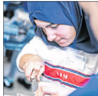
Auch Mädchen können in handwerklichen Berufen richtig gut sein.

Seit vielen Jahrzehnten ist es das gleiche Bild: Entscheiden sich Jugendliche für einen Ausbildungsberuf, so orientieren sie sich auch heute noch meistens an den klassischen Rollenbildern. Beispiele dafür gibt es viele. Im bevölkerungsreichsten Bundesland NRW etwa wählten 2022 genau 243 Jungen, aber nur sechs Mädchen eine Ausbildung im „Männerberuf“ Anlagenmechaniker/-in für Sanitär-, Heizungs- und Klimatechnik. Im klassischen „Frauenberuf“ Medizinische/r Fachangestellte/-r war das Verhältnis genau gegenläufig: Hier starteten neun Jungen und 264 Mädchen ihren Job. Das geht aus Statistiken des Bundesinstituts für Berufsbildung hervor. Doch sind Frauen wirklich besser für helfende Berufe geeignet als Männer? Und haben Jungen