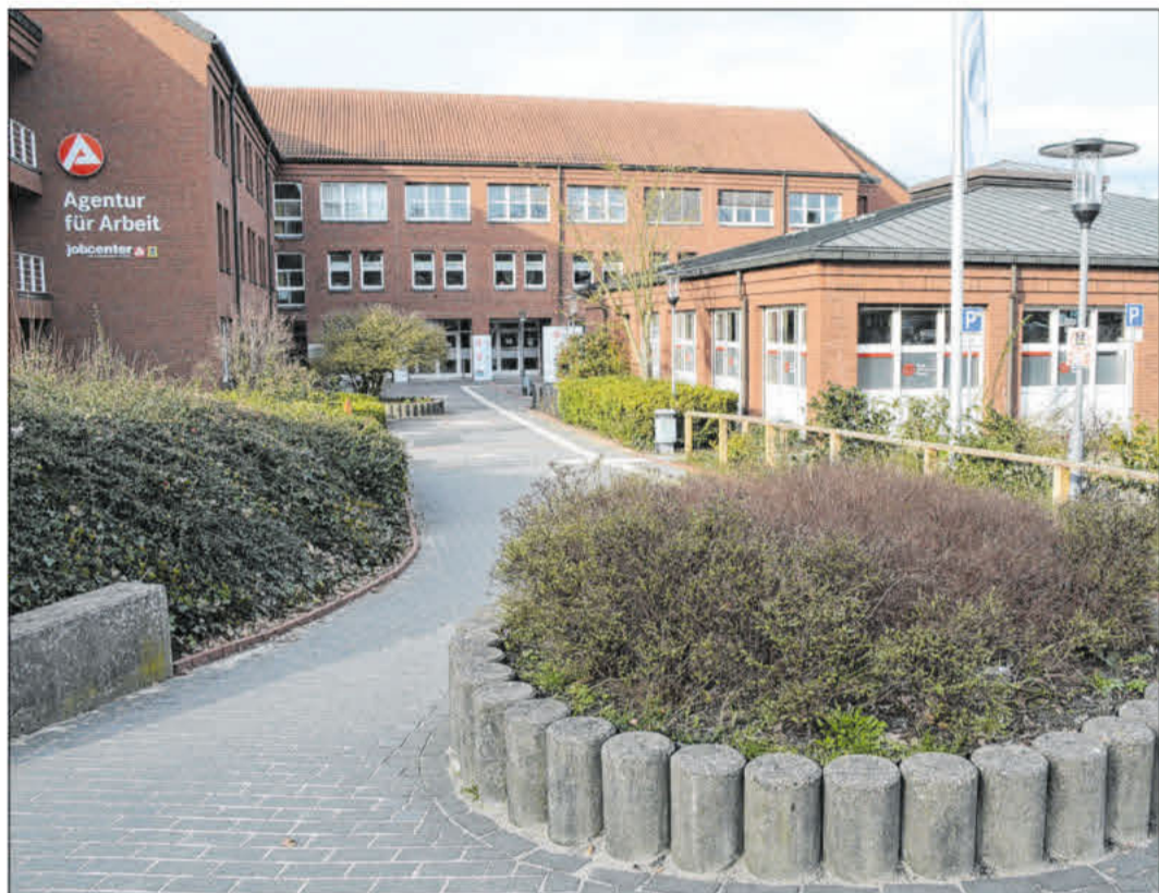
Am Dienstag wird im BiZ über die Ausbildung zur Fluglotsin/zum Fluglotsen informiert