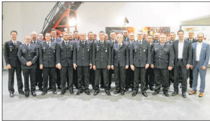
Der Geehrte, Beförderten, Ehrengäste und die Wehrführung.