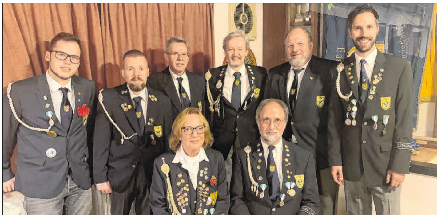
Der neue Vorstand.