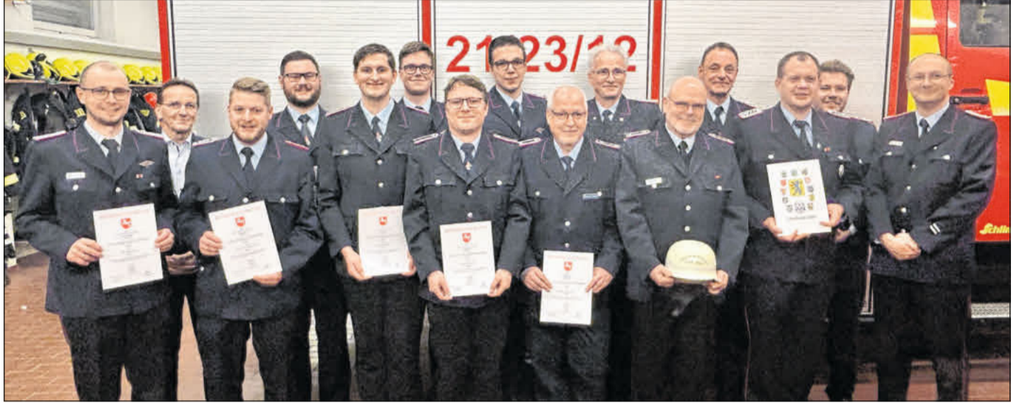
Die Beförderten und Geehrten.