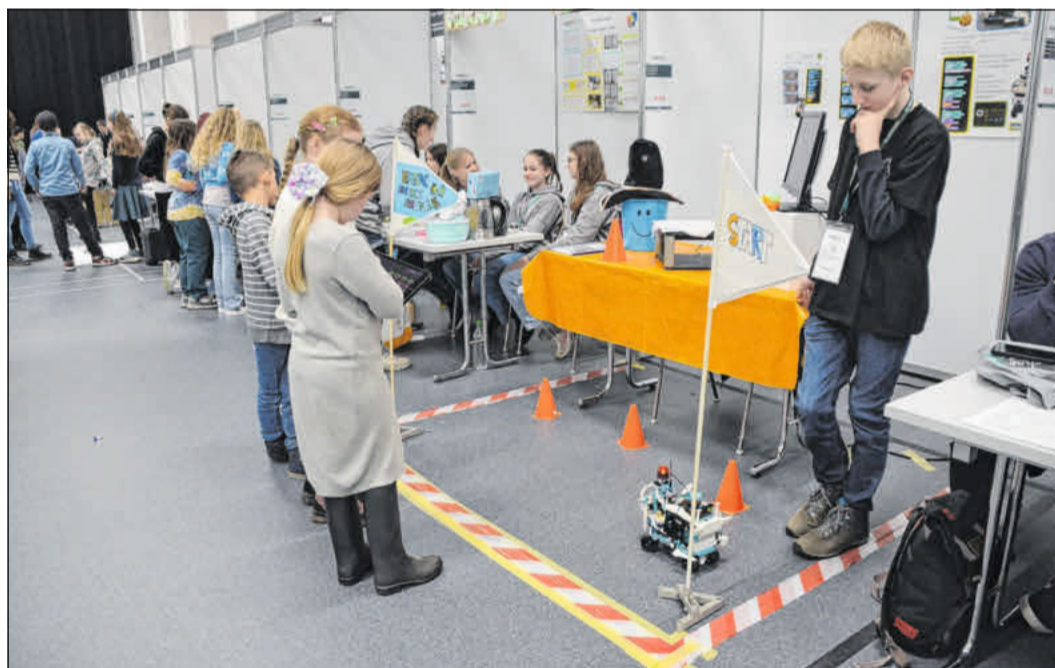
Die Schülerinnen und Schüler präsentierten ihre Experimente.