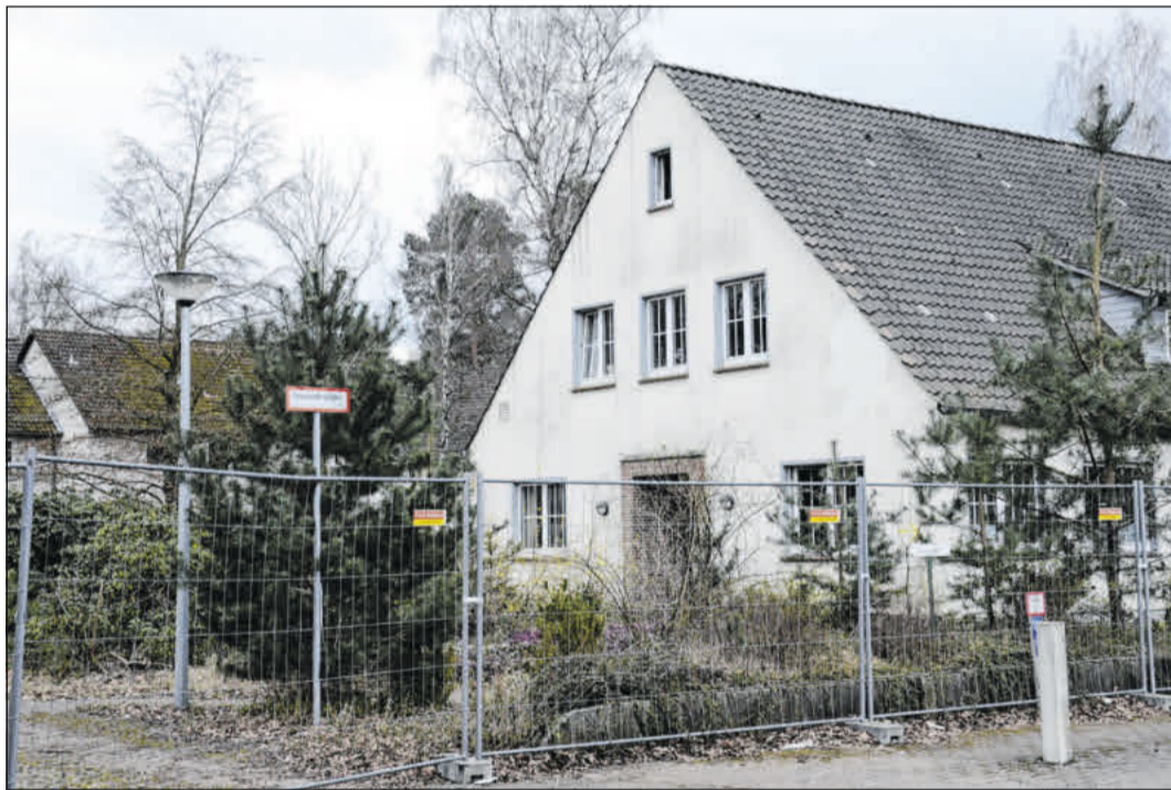
Das Gelände des ehemaligen CJD-Jugenddorfes in Westercelle soll Standort für den Staatsschutzsenat des Oberlandesgerichtes Celle werden.

Die Einführung in die Ausstellung hält Sabine Manneke, Kristina Vogelsang begleitet die Eröffnung auf der Querflöte. Die Ausstellung ist bis zum 13. Juni montags, dienstags, donnerstags bis samstags von 17 bis 22 Uhr sowie sonn- und feiertags von 12 bis 14.30 Uhr und 17 bis 22 Uhr zu besichtigen.