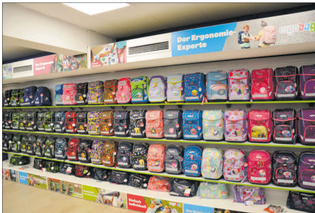
Ranzen für den Schulstart gibt es beim Ranzenmaxx in der Celler Schuhstraße.

Beim Schulranzentag wird es außerdem Kinderschminken geben.