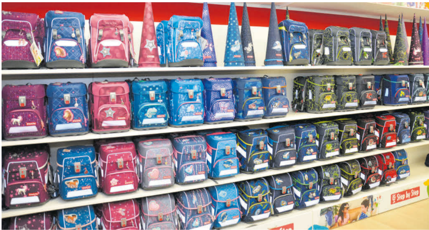
Ranzenmaxx bietet eine vielfältige Auswahl an Schulranzen an.

Heute: Ranzenmaxx Celle, Schuhstraße 20, 29221 Celle, Telefon 0 51 41 / 90 97 27