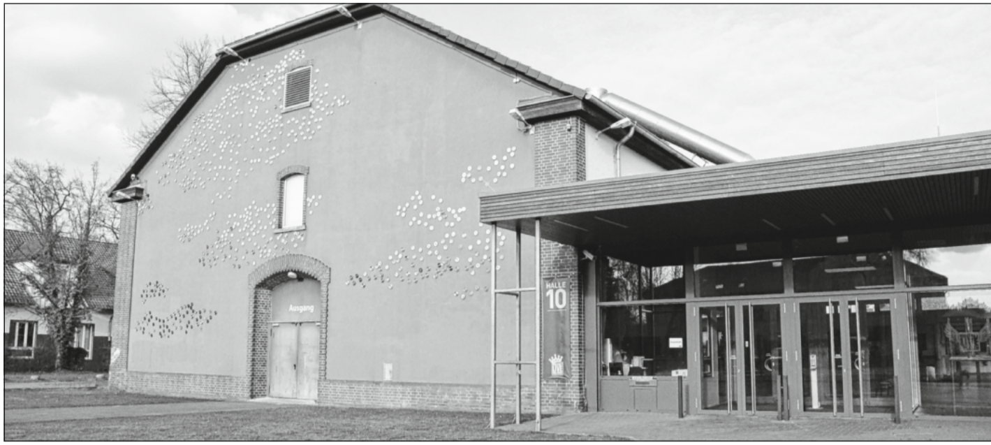
Der Haushaltsausschuss des Bundes hat 2.568.751 Euro für die Sanierung der CD-Kaserne in Celle bewilligt.