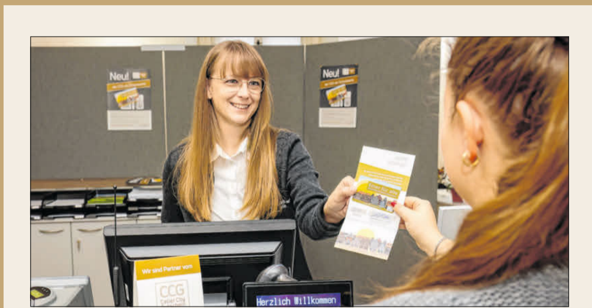
Den Celler City Gutschein ist exklusiv im Service- und Infocenter der Stadtwerke Celle im Alten Rathaus, Markt 14-16, erhältlich.