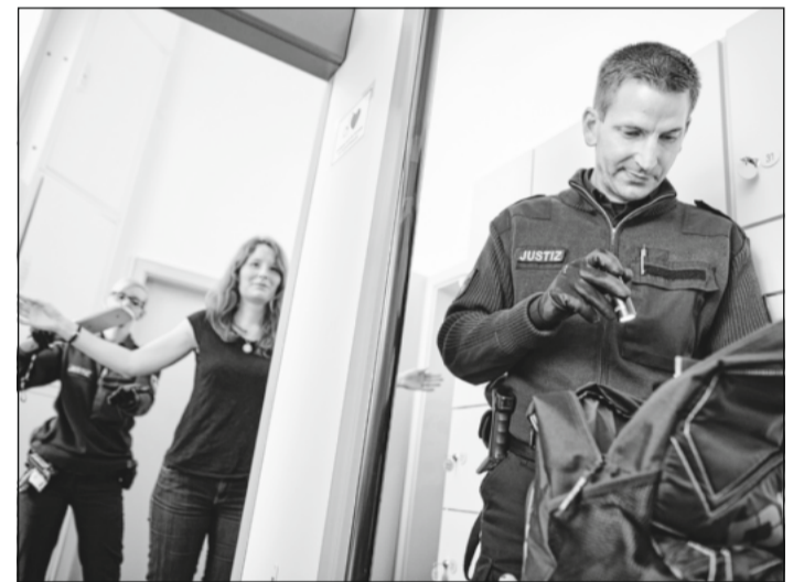
Bei einem Rundgang wurde über Eingangs- und Sicherheitskontrollen und andere interessante Themen informiert.

Der Arbeitskräftemangel sei inzwischen eines der größten Probleme der deutschen Wirtschaft, so Mende. Egal ob im produzierenden Bereich oder im Dienstleistungssektor, auf dem Bau, in der Pflege, in der Industrie oder in der Gastronomie, überall würden Mitarbeiter, sowohl Fachkräfte als auch Ungelernte, fehlen. „Bei dieser Veranstaltung soll es vor allem um den Austausch mit den Bürgerinnen und Bürgern zu diesem Thema gehen“, erklärt Mende.