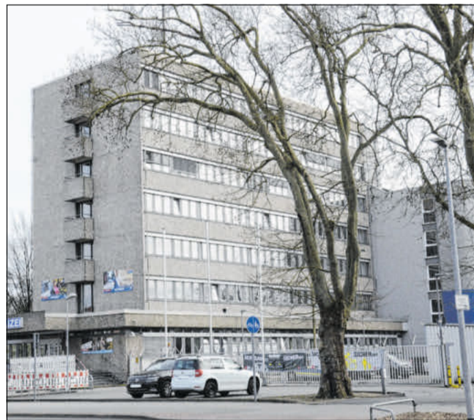
Die Polizeiinspektion Celle stellte die Kriminalstatistik 2023 vor.

Bei den Wohnungseinbruchsdiebstahl-Taten kam es im Vergleich zum Vorjahr zu einem Rückgang um 15 Taten. Die erfassten 144 Taten liegen deutlich unter dem langjährigen Mittelwert von 2021 (für die Jahre 2014 bis 2020 liegt der Mittelwert bei 267 Taten). Der Versuchsanteil liegt bei 47,22 Prozent (68 Taten) und ist somit zum Vorjahr (36,48 Prozent) gestiegen. Nachdem im Jahr 2022 ein neuer Höchstwert von 184 Taschendiebstahl-Taten bekannt geworden ist, kann im Jahr 2023 ein Rückgang um 40 Taten verzeichnet werden. Die Rauschgift-Delikte sind nach einem Stand von 524 Taten im Jahr 2023 auf 661 Taten gestiegen. Auch 2023 stieg die Gewalt gegen Polizeivollzugsbeamte weiter an. Im Jahr 2023 kam es zu 120 Taten (2022: 117 Taten).