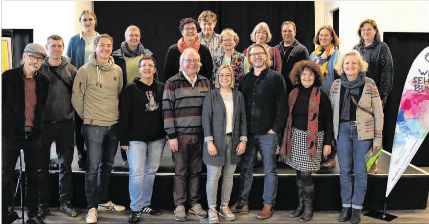
Jetzt geht es los: Die Projektträgerinnen und Projektträger freuen sich, ihre Ideen in der Partnerschaft für Demokratie in Celle umzusetzen.