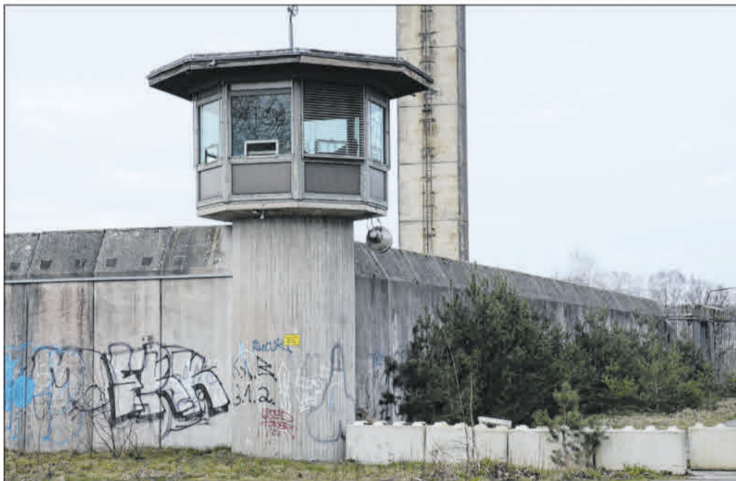
Die vergangenen Jahren haben an der JVA Salinenmoor deutliche Spuren hinterlassen.