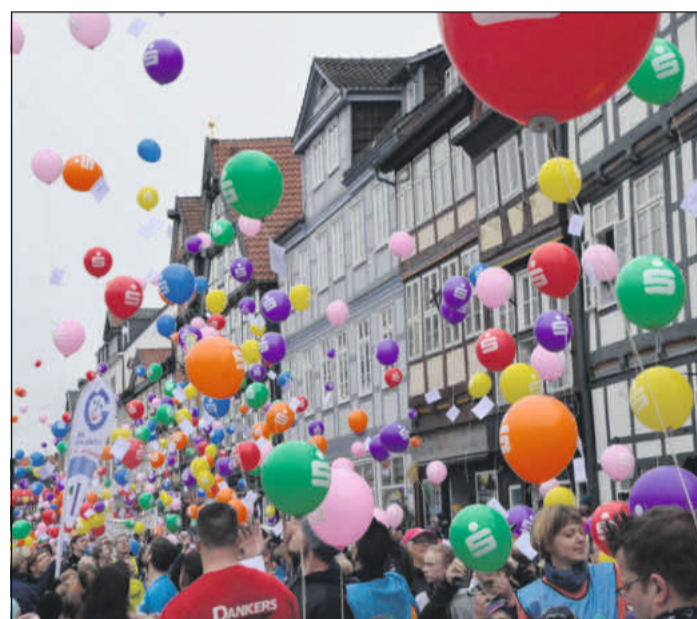
Der Mini-Wasa-Lauf startet wieder auf dem Großen Plan.

wählt werden: 2,5 Kilometer Mini-Wasa-Lauf, fünf Kilometer für trainierte Jogger, zehn Kilometer, 15 Kilometer und 20 Kilometer für versierte Läufer, elf Kilometer Volkswandern und fünf Kilometer Walking, zehn Kilometer SVO-Nordic-Walking, 20 Kilometer Volksbank Celle Staffel. Meldungen sind am Sams-