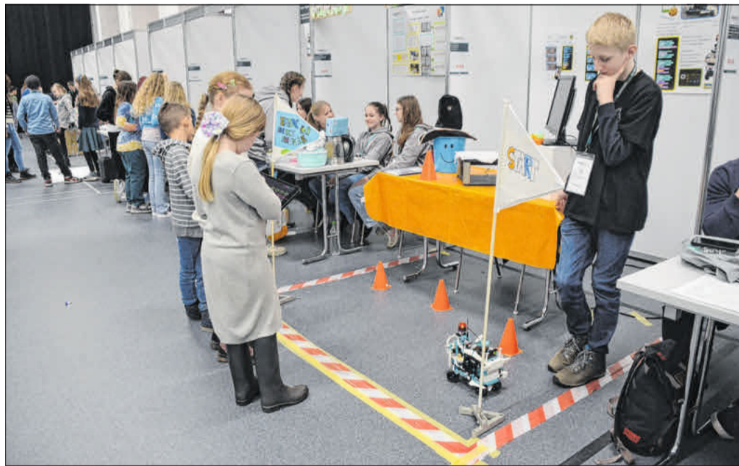
Die Schülerinnen und Schüler präsentierten ihre Experimente.