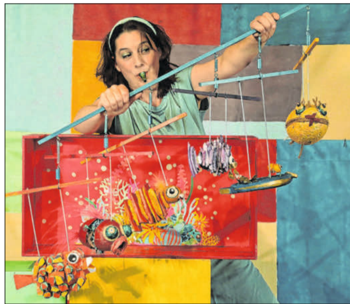
Angriff im Korallenriff vom Theater Malinka.

Seit 2017 tourt Brunner, Schauspieler, Kulturmanagerin und begeisterte Handwerkerin, mit ihrem mobilen Kindertheater über die verschiedensten Bühnen. Mit viel Hingabe und Sachverstand entwickelt, spielt die Künstlerin Geschichten und Märchen für Groß und Klein. Tickets sind an der Tageskasse für zwölf Euro erhältlich.