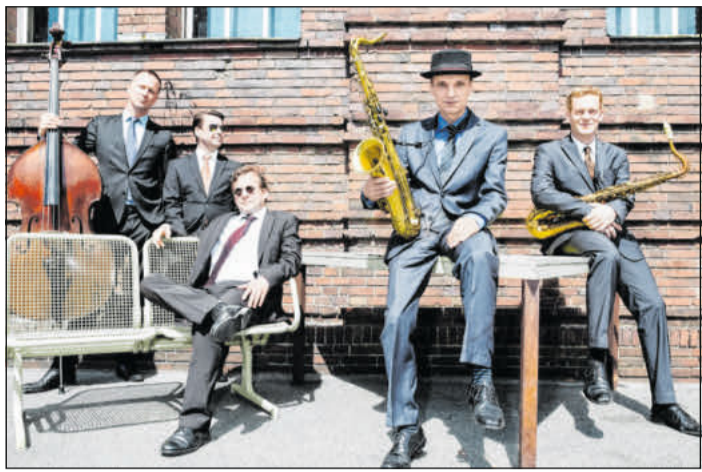
„The Toughest Tenors“.