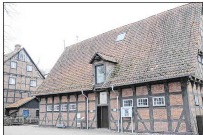
Das Kulturhaus Wienhausen.

Am Samstag, 16. März, um 15 Uhr, findet die Kinderbuch-Lesung „Roki - Ferien mit Schatzschlamassel“ mit Andreas Hüging statt. Paul, Roki und Valerie freuen sich ein Loch in den Bauch: Adam nimmt sie alle mit an die Nordsee, wo er eine frühere Erfindung reparieren soll: den Tauchroboter Luise. Der Zelturlaub am Meer wird ein Riesenspaß, denn an Strand und Campingplatz ist jede Menge los. Es ist eine musikalische Lesung zum Mitmachen mit viel Live-Musik und Action für Kinder von sechs bis zehn Jahren. Der Eintritt ist frei. Einlass ist 60 Minuten vor Veranstaltungsbeginn. Die Veranstaltung wird gefördert durch den Lüneburgischen Landschaftsverband aus Mitteln zur regionalen Kulturförderung.