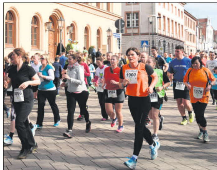
Rund 7.000 Teilnehmer sind in diesem Jahr dabei.

tag, 9. März, von 14.30 bis 17.30 Uhr, während der Startnummernausgabe in der Halle 3 des Schulzentrums Burgstraße noch möglich. Nur Meldungen für das Volkswandern sind auch am Sonntag, 10. März, möglich. Die Startnummernausgabe ist am Sonntag, 10. März, ab 8 Uhr vor dem Celler Schloss. Die Nordic Walker beginnen um 9 Uhr ihre zehn Kilometer lange Strecke am Alten Rathaus, zeitgleich mit den Volkswandern, die von 9 bis 11.15 Uhr vor dem Celler Schloss ihre elf Kilometer lange Strecke antreten. Das SVO-Nordic-Walking erfreut sich nun schon seit mehreren Jahren großer Beliebtheit. Weiter geht's um 10.30 Uhr auf dem Großen Plan mit dem Mini-Wasa-Lauf (2,5 Kilometer). Weitere Startzeiten - mit Start am Alten Rathaus und Ziel auf der Stechbahn - sind: für das Fünf-Kilometer-Walking (eine Runde) um 10.50 Uhr, für den Fünf-Kilometer-Lauf (eine Runde) um 11.30 Uhr, für den Zehn-Kilometer-Lauf (zwei Runden) um 12.05 Uhr, für den 15-Kilometer-Lauf (drei Runden) und den 20-Kilometer-Lauf (vier Runden) jeweils um 13.15 Uhr sowie für die Volksbank Celle Staffel (20-Kilometer) ebenfalls um 13.15 Uhr.