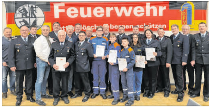
Die Freiwillige Feuerwehr Unterlüß und die Werkfeuerwehr Rheinmetall trafen sich zur Jahreshauptversammlung.