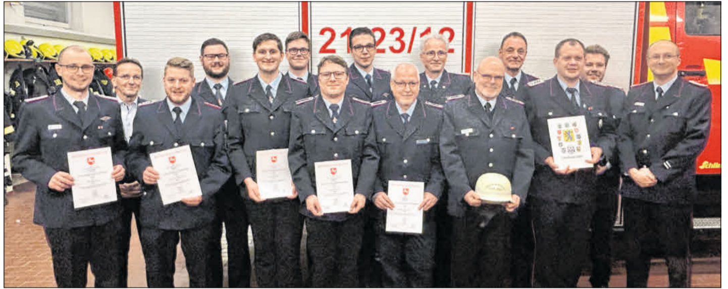
Die Beförderten und Geehrten.