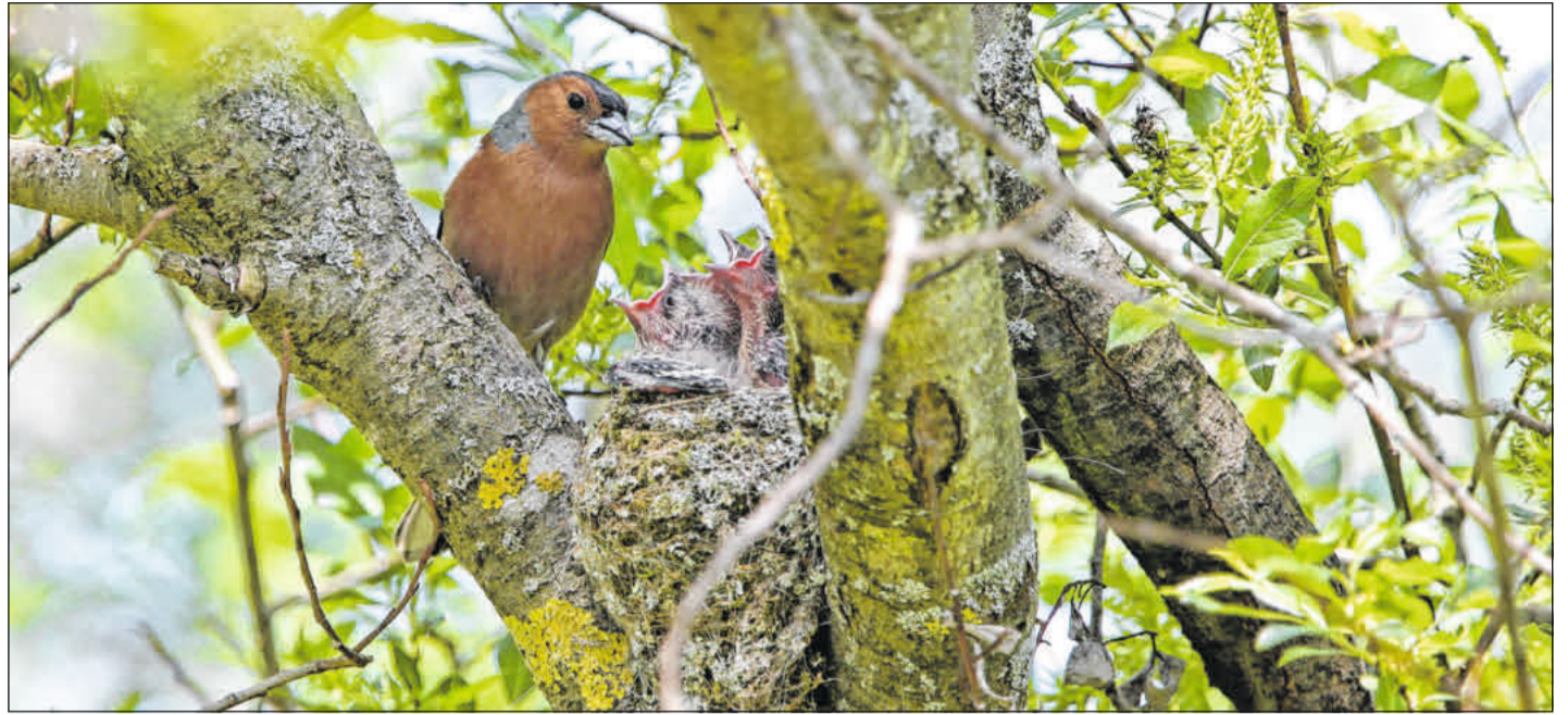
Buchfink am Nest.

Fashion Outlet | Wernerstr. 39 | 29227 Celle Mo - Fr 10.00 - 19.00 Uhr | Sa 10.00 - 16.00 Uhr | Tel: 05141 980 360