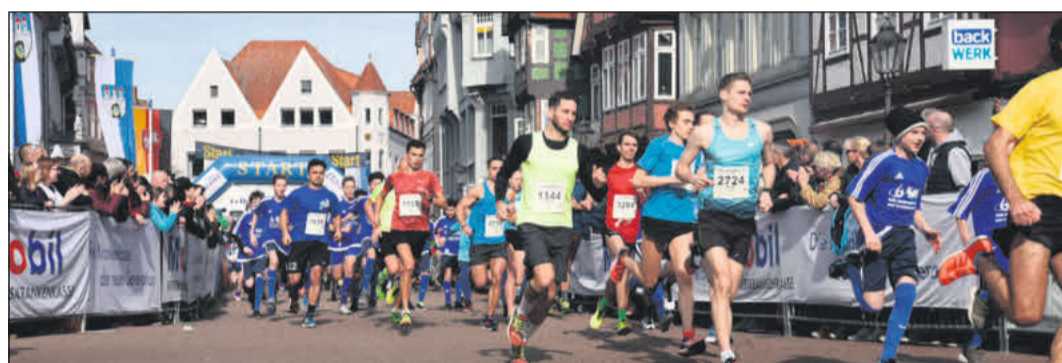
Zahlreiche Ehrenamtliche sind im Einsatz, um den reibungslosen Ablauf der Veranstaltung zum 40. Wasa-Lauf zu gewährleisten.

füllt inzwischen 39 Jahrbücher, Zeitungssammlungen und Tausende an Fotos - vor allem aber viele Erinnerungen der über die Jahre inzwischen mehr als eine Million Zuschauer sowie der auch mehr als 300.000 Volksläufer allen Geschlechts und allen Alters unterschiedlichster Herkunft. Die Idee einer Massenlaufver-