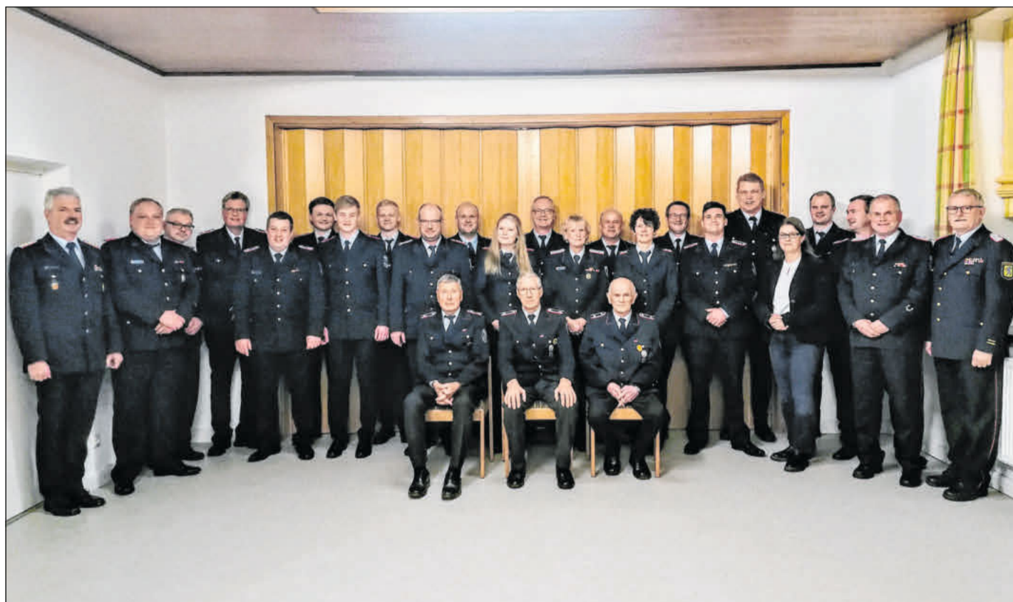
Die Gewählten, Beförderten und Geehrten mit Bürgermeisterin, Stadtbrandmeister und Stellvertretenden Kreisbrandmeister.