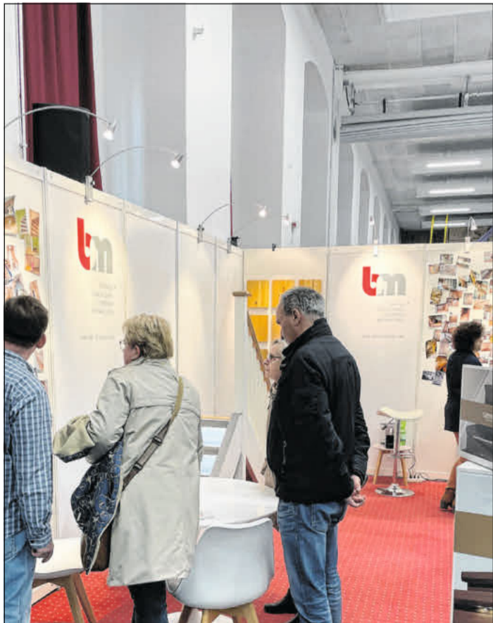
Die Messe „Schöner Bauen & Wohnen“ lockt immer viele Besucher an.