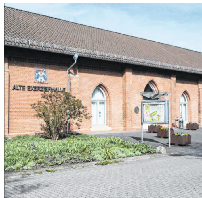
Am 1. März ist in der Alten Exerzierhalle wieder Seniorenkino.

Der Einlass beginnt ab 14.30 Uhr, der Film startet um 15.30 Uhr. Das Kinoticket ist für 6,50 Euro an der Tageskasse erhältlich. Vor Ort steht den Kinogästen ein Kaffee- und Kuchenbuffet zur Verfügung - so lange der Vorrat reicht. Das Team des Seniorenkinos weist darauf hin, dass die Zahl der Sitzplätze begrenzt ist.