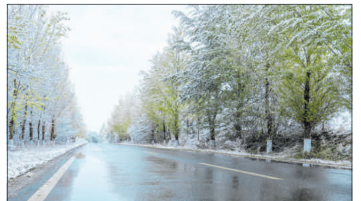
Die Wetterlagen im Winter sind zunehmend instabil.

tig präventiv tätig werden kann. Während etwa an Wintertagen mit Eis, Schnee und tieferen Temperaturen vorrangig Feuchtsalz zum Einsatz kommt, ist bei Temperaturen um den Gefrierpunkt Solelösung die erste Wahl. Dies, so Grabow, habe drei wesentliche Vorteile: Straßen, Brücken und Radwege ließen sich bei angekündigter Glätte präventiv behandeln. Das Streubild sei dann wesentlich präziser. (DJD)