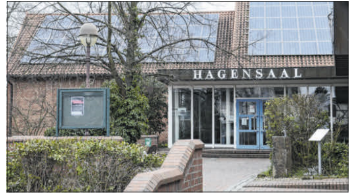
Im Hagensaal findet eine Informationsveranstaltung zum Thema „Rechtsradikalismus“ statt.

bungsmappencheck gibt es Termine nach Vereinbarung. Die Sprechstunde des Ortsrates im „Mittendrin“ ist jeden zweiten Freitag im Monat. Für die Sprechzeit der Kontaktbeamtin der Polizeiinspektion Celle gibt es mindestens drei Termine jährlich. Der