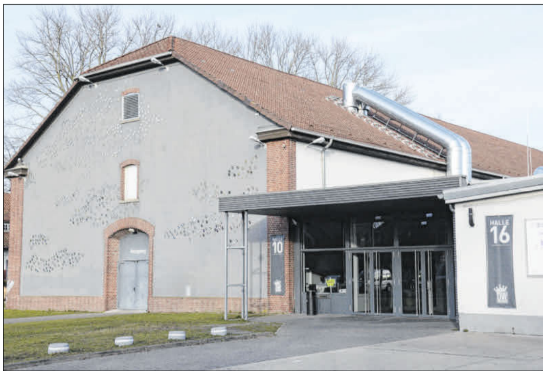
Die CD-Kaserne ist Veranstaltungsort für die „Schöner Bauen & Wohnen“-Messe.

und deckt einen vielfältigen Branchen-Mix ab. Seit 2023 ist die Messe in voller Stärke zurück, um Celles Veranstaltungskalender zu bereichern - als informative Fachschau für alle, die sich zu Beginn des Jahres zu Projekten inspirieren lassen möchten, mit denen sie ihr Zuhause modernisieren, verschönern oder ganz neu bauen. Geöffnet ist die Messe am Samstag, 2. März, von 10 bis 18 Uhr und am Sonntag, 3. März, von 11 bis 18 Uhr. Weitere Informationen unter www.celle-messe.de .