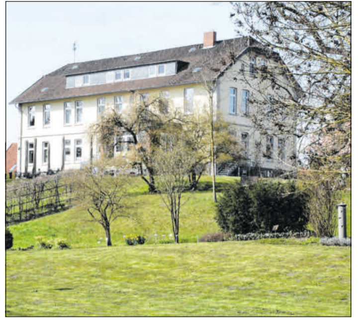
Im Heilpflanzengarten findet ein Workshop statt.