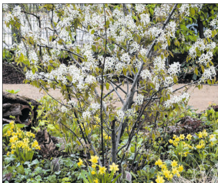
Frishes Grün tut der Seele gut und macht Freude, mit der Pflege des Grabes zu starten.

Gänseblümchen, Vergissmeinnicht und Stiefmütterchen haben übrigens eine lange Tradition und gelten als Symbolpflanzen für die Grabgestaltung. (GdF)