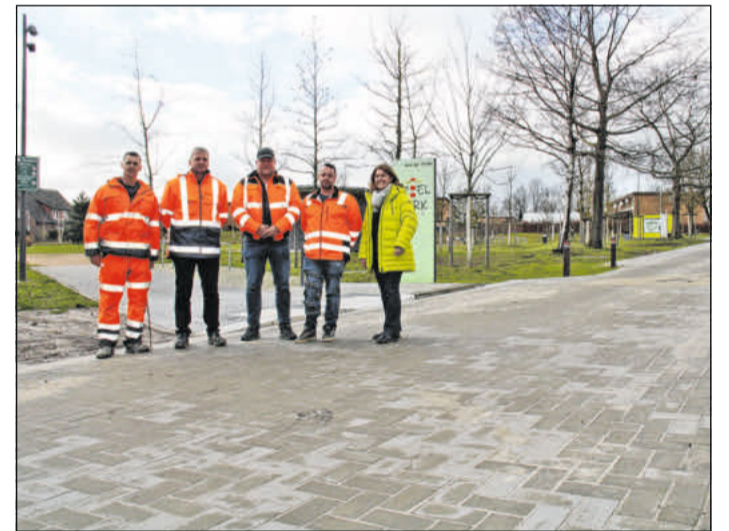
Bauabnahme am Spielplatz Danziger Straße.