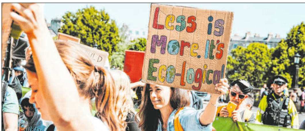
Die „Zero Waste“-Bewegung.