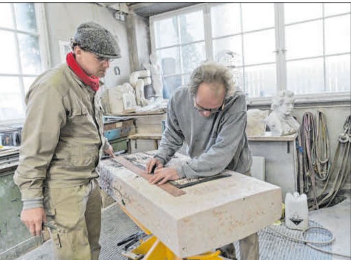
Angehörige können gemeinsam mit dem Steinmetzbetrieb nach der passenden Gestaltung suchen.