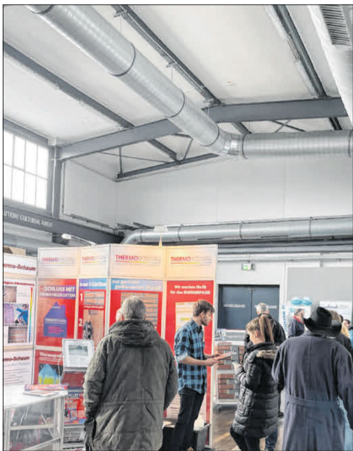
Die Messe findet zum 17. Mal statt.