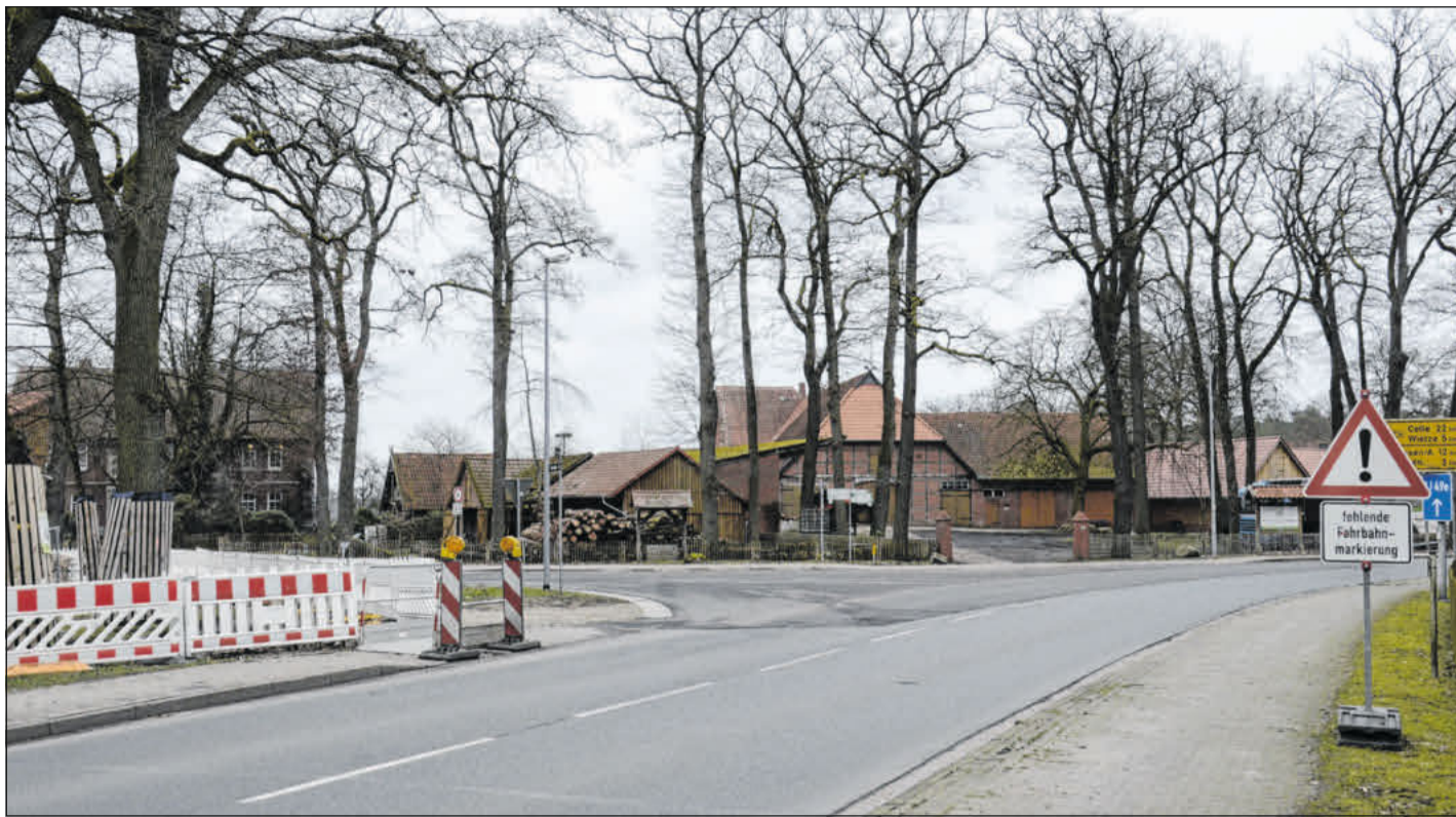
Am Montag, 26. Februar, wird die Baumaßnahme Ortsdurchfahrt Jeveresen fortgesetzt.