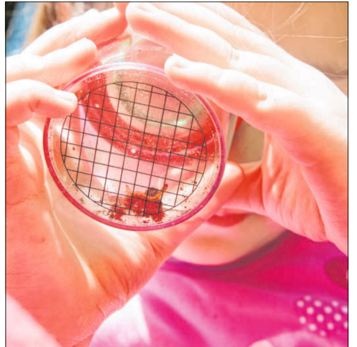
Die Becherlupe eignet sich hervorragend zum genauen Betrachten von Fundstücken.