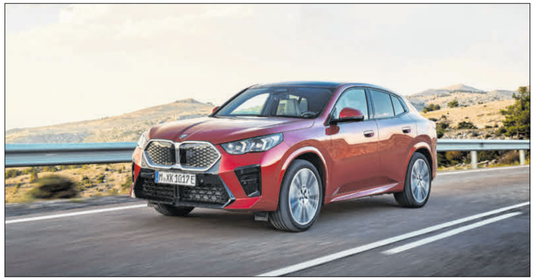
Die vollelektrische Modellvariante BMW iX2.