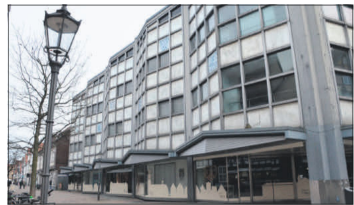
Der Kauf des Karstadt-Areals zwecks innenstadtförderlicher Nutzung sei laut Torsten Schoeps ein Thema für 2024.

freien citynahen Parkraum benötigen. Weitere Themen seien die Intensivierung der Bemühungen um die Wiederansiedlung der Celler Jugendherberge des DJH an geeigneter Stelle, Hochwasserschutz nicht nur für die Aller-, sondern auch die Fuhseanlieger, eine Baumschutzsatzung, die dem Klimawandel gerecht wird, eine schnelle und intensive Befassung mit dem nötigen Straßenausbau nach Abschaffung der ungerechten nur von Anliegern erhobenen Straßenausbaubeiträgen - dafür wurden die Grundsteuern ja bereits erhöht.