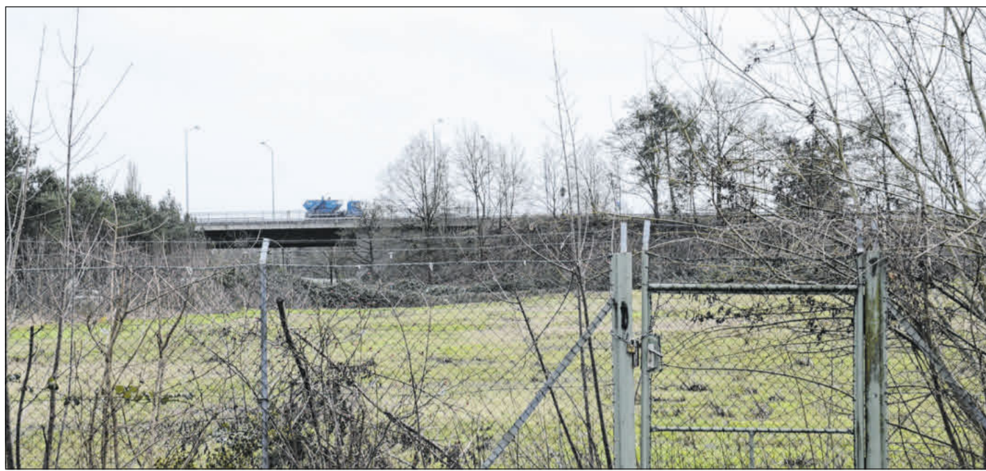
Im kommenden Ausschuss für Stadtentwicklung und Bauen wird über das „Quartier Kortenumstraße“ beraten.