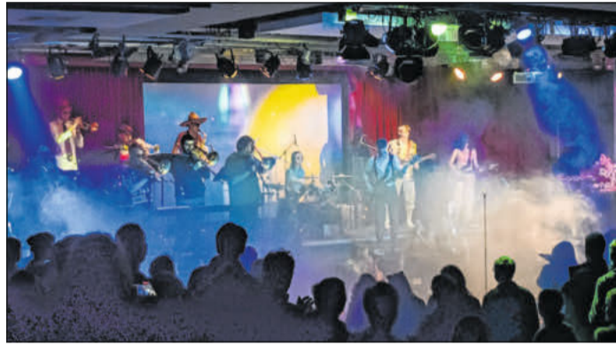
Die Schulband „Room 55“ im Ernestinum.

Den Namen der Band „Room 55“ leitet sich davon ab, dass sich Schüler vor einigen Jahren im Raum 55, dem Musik-Vorbereitungsraum, getroffen haben, um eine Band zu gründen. Nun steht also das nächste Jahreskonzert an. Der Eintritt ist frei. Spenden sind willkommen.