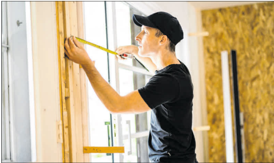
Fensterbauer empfehlen beim Einsatz von Mehrfach-Isolierverglasung stabile PVC-Profile in Klasse A-Qualität.

energetisch und baubiologisch modernisieren