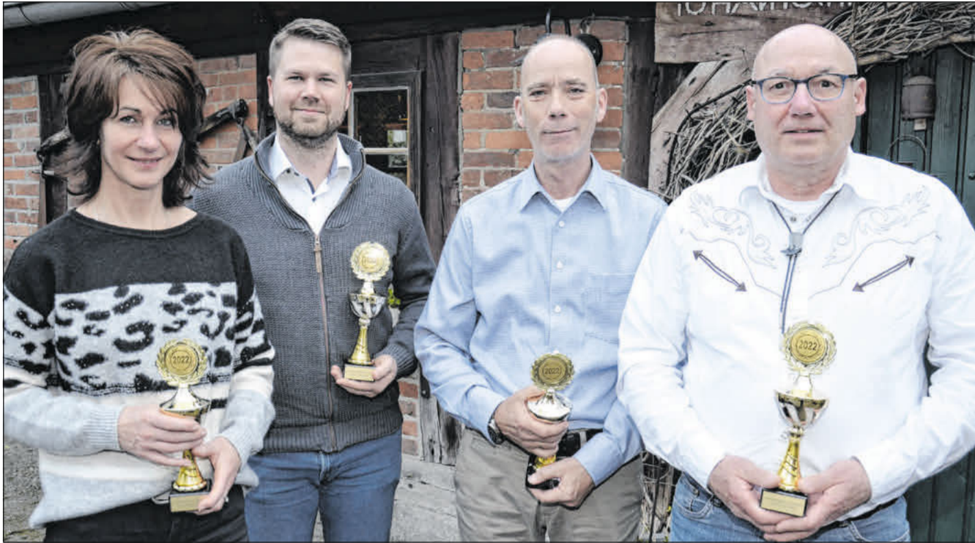
In diesem Jahr findet wieder eine Proklamation statt.

Auf der Tagesordnung steht unter anderem die überörtliche Prüfung der Gesamt- und Teilhabeplanung SGB IX und die Vorstellung des ersten Pflegeberichts für den Landkreis Celle.