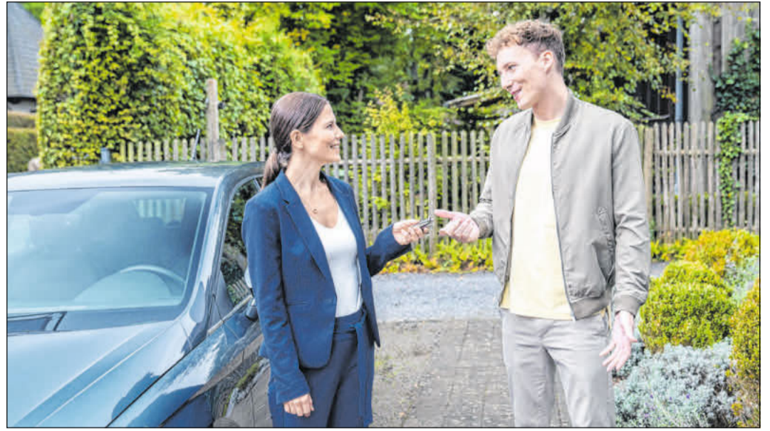
Beim Autokauf ist für mehr als Dreiviertel der Deutschen der Preis das wichtigste Kriterium.

Kontrolle beim Bremsen, indem es einem blockierenden oder wegrutschenden Vorderrad entgegenwirkt. Dazu wird die Geschwindigkeit der Räder permanent durch Sensoren überwacht. Droht das Vorderrad bei einer zu starken Bremsung zu blockieren, regelt das ABS den Bremsdruck und verbessert die Fahrstabilität und Lenkbarkeit. Wichtig ist außerdem, dass die Reifen stets genug Profil aufweisen. Wenn der Untergrund stark vereist oder verschneit ist, können Spikes helfen. Sie sind für Pedelecs bis 25 Stundenkilometer Höchstgeschwindigkeit zugelassen. (DJD)