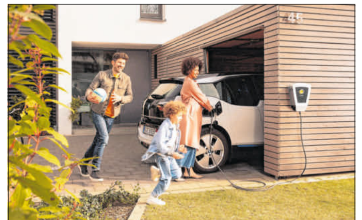
Ob zu Hause oder unterwegs: Das Laden des E-Autos sollte mittlerweile kein Problem mehr sein.

ist: Die Anzahl der Ladesäulen hat in den vergangenen Jahren kontinuierlich zugenommen. In Deutschland gab es Anfang September 2023 rund 56.500 öffentliche Ladestationen für E-Autos, die Anzahl der Ladepunkte lag bei etwa 105.600. Auch in den Niederlanden, in Skandinavien, Frankreich, Österreich und der Schweiz kann man jetzt schon problemlos und schnell laden. Länder wie Italien und Slowenien haben aufgeholt. Ökostromanbieter bieten klimaneutrale Tarife an - damit können Reisende inzwischen an über 440.000 öffentlichen Ladepunkten laden. (DJD)