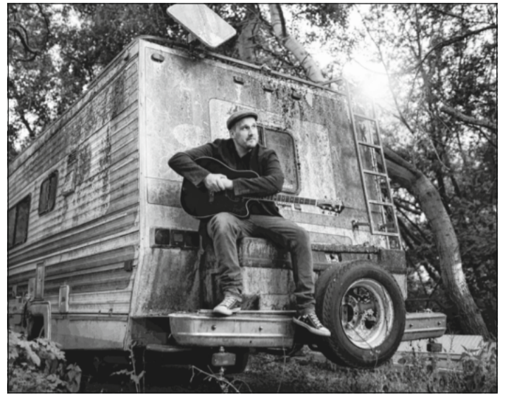
Der To wieder in Celle.