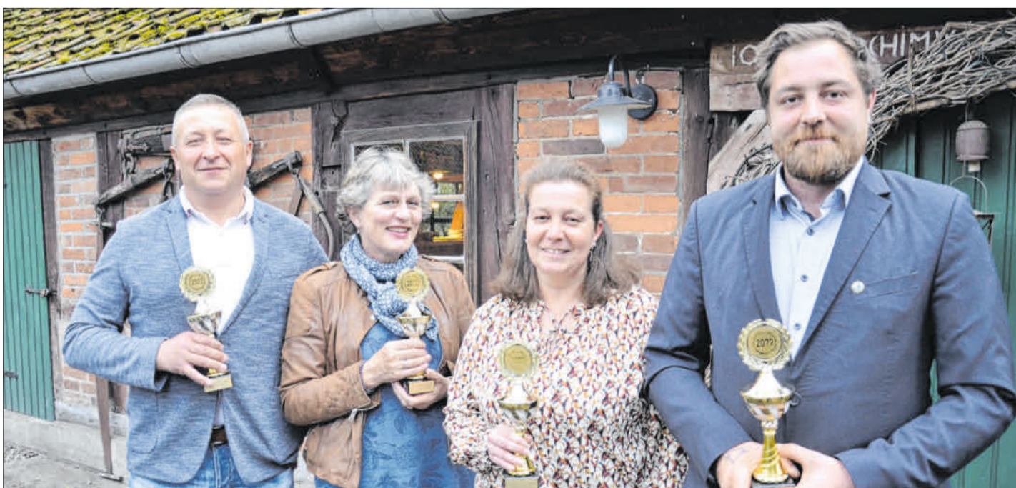
Die vorgeschlagenen Trainerinnen und Trainer werden wieder geehrt.