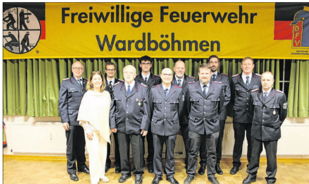
Die Freiwillige Feuerwehr Wardböhlen lud zur Jahreshauptversammlung.