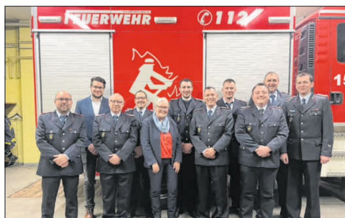
Die Freiwillige Feuerwehr Weesen traf sich vor Kurzem zur Jahreshauptversammlung.