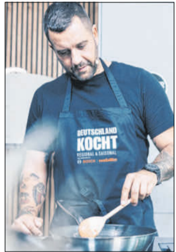
„Deutschland kocht“.

CELLE. Die Mobel Wallach GmbH & Co.KG nimmt in diesem Jahr am erfolgreichen Eventformat teil und sucht begeisterte Hobbykocher sowie regionale Lebensmittelproduzenten fur sein Team. Das Kochen von saisonalen Gerichten mit regionalen Produkten gewinnt zunehmend an Bedeutung. Ob Labskaus aus Hamburg, Maultaschen