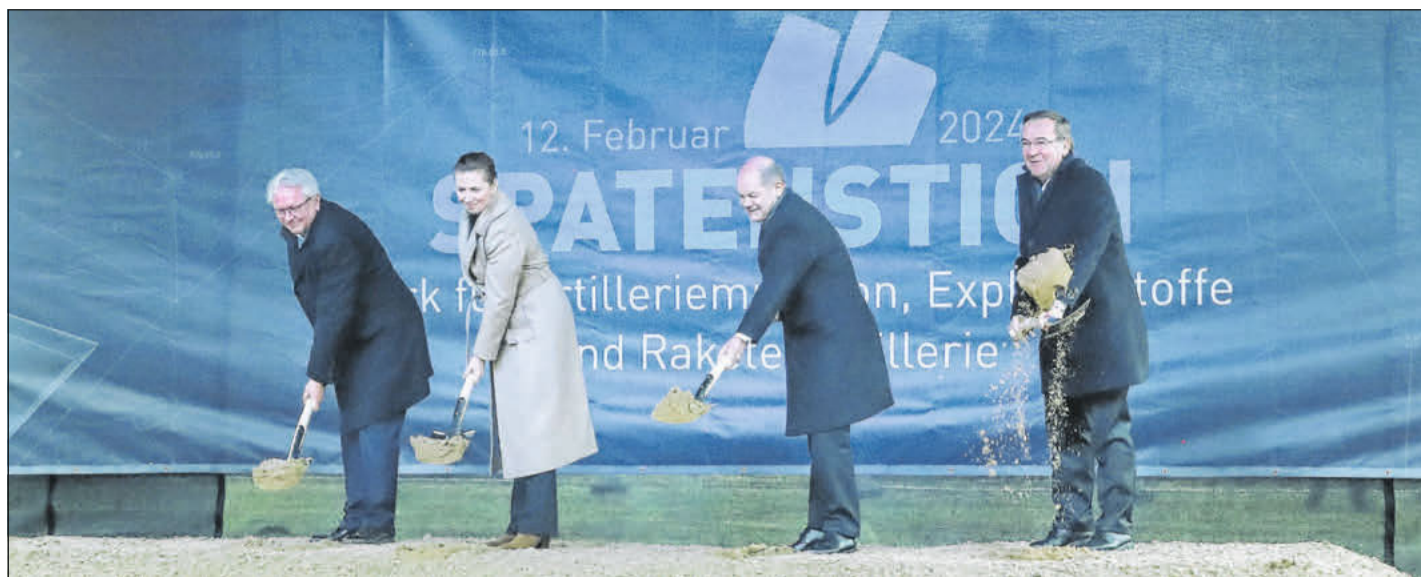
Armin Papperger (von links), Mette Frederiksen, Olaf Scholz und Boris Pistorius.