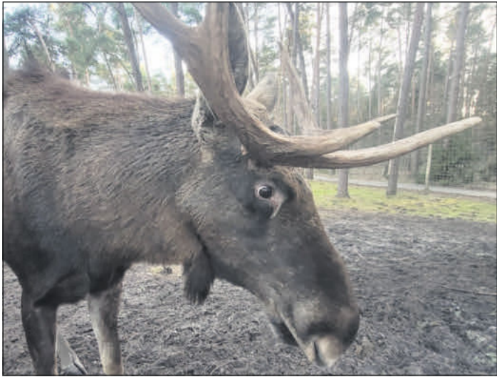
Die Tiere im Wildpark freuen sich auch in der kalten Jahreszeit über Besucher.