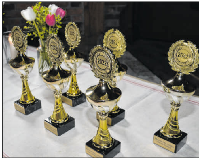
Der Celler Kurier ruft zur Wahl zum „Trainer des Jahres“ auf.