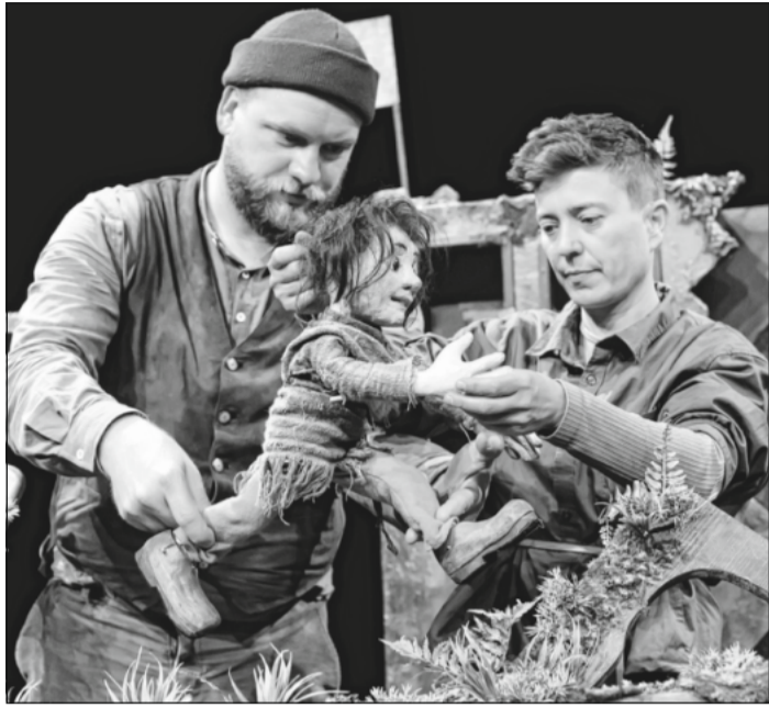
Die freie Theatergruppe „Artisanen“ präsentiert ihr Figurentheater in Celle.