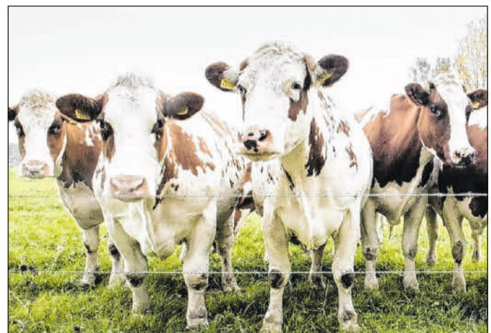
Bio ist der höchste gesetzliche Standard der Landwirtschaft und Lebensmittelproduktion.

Bio-Richtlinien für die Tierhaltung stetig weiter. Die Verbände bessern Schwachstellen aus, für die es aktuell noch nicht die beste Lösung gibt. Darüber hinaus hilft eine zusätzliche Tierwohlkontrolle der Bio-Verbände dabei, die gute Tierhaltung auf den Betrieben weiter zu stärken und Erkenntnisse zu erlangen, die für eine zukunftsfähige Tierhaltung der gesamten Landwirtschaft nützlich sind. (bölv)