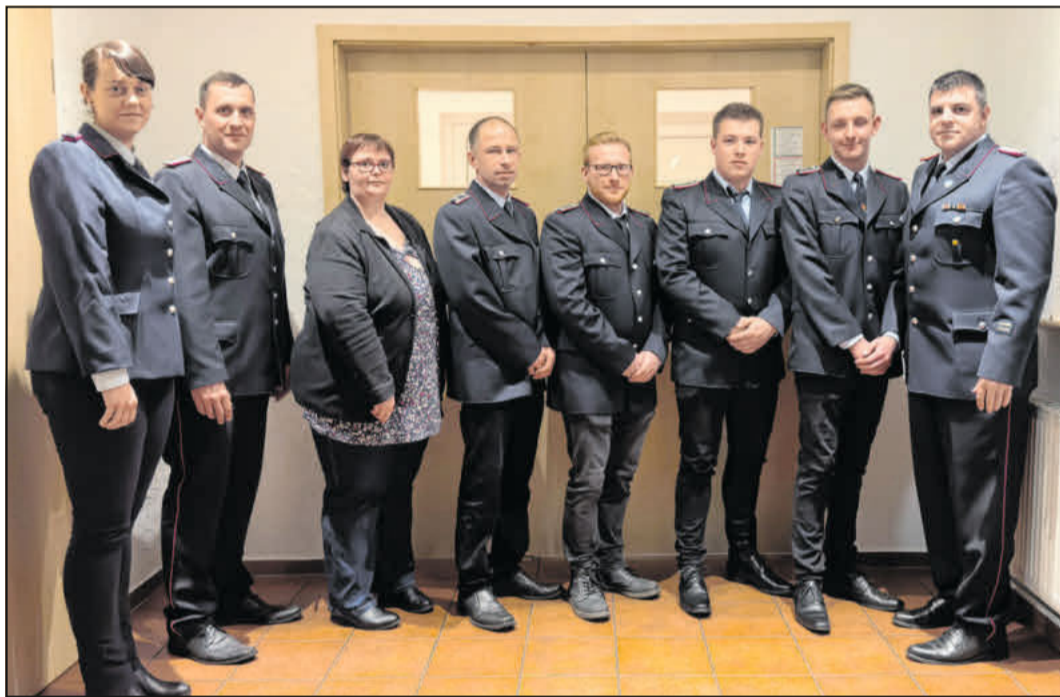
Während der Versammlung.