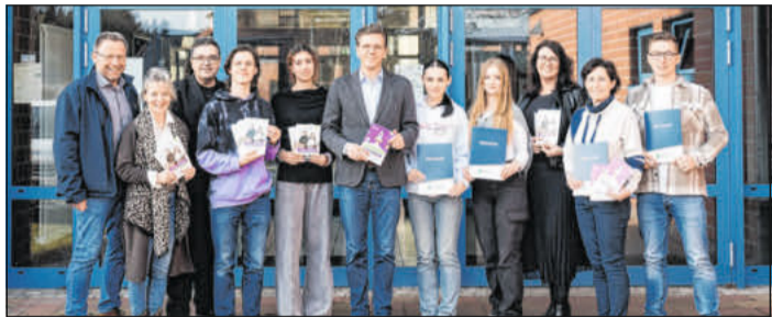
Übergabe der Flyer an die Oberschule Hermannsburg und das Christian-Gymnasium.

mann begleiteten die Veranstaltung. Bei der Übergabe der Flyer waren auch Schülerinnen und Schüler anwesend. Viele haben bereits ein paar gute Ideen für ihre berufliche Zukunft. Die Flyer wurden trotzdem gerne angenommen. Für die Oberschule gab es zusätzlich noch hochwertige Zeugnislisten für alle Jahrgänge. Die Ausbildungsmesse „Meine Zukunft in Südheide“ findet am 25. April in der Oberschule Hermannsburg statt. Unternehmen aus dem Einzugsgebiet der Schulen sind eingeladen sich zu präsentieren.