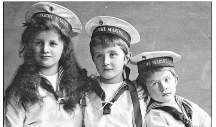
Die Matrosenanzüge der 1920er Jahre.

Die Ausstellung lädt auch zum Mitmachen und Spielen ein: So kann man sich mithilfe einer Medienstation in einem Matrosenanzug oder einem Reifrock betrachten. Die Ausstellung ist vom bis zum 5. Januar 2025 von dienstags bis sonntags von 11 bis 17 Uhr zu sehen.